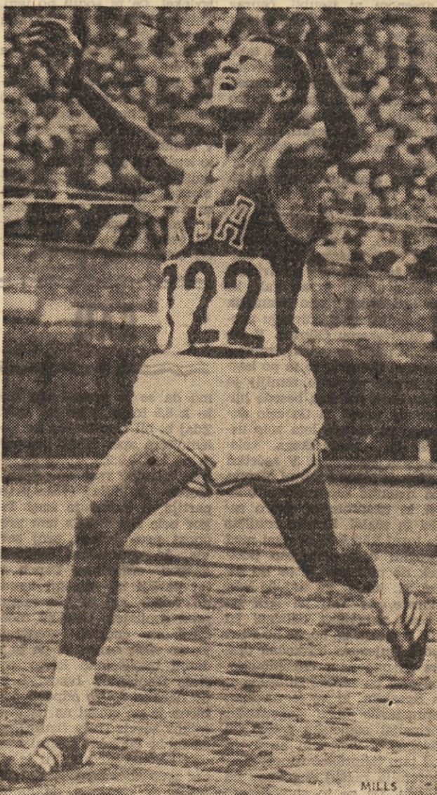
Olimpijski zmagovalca v teku na 10.000 m, Billy Mills, bo eden stebrov ekipe ZDA na dvoboju proti SZ

Končni rezultat po naših prognozah bi bil 68:50 za Sovjetsko zvezo. Če bi hoteli temu dodati še prognozo za skupni izid, bi bila - 178:168 za ZDA, se pravi druga skupna zmaga za atlete in atletinje z one strani Atlantika. Prognoza pa je vendarle samo prognoza in pri 33 panogah je dovolj možnosti tudi za precej drugačen končni rezultat. Počakajmo na največjo atletsko prireditev leta in na vsa ugibanja bomo dobili ustrezne odgovore, za nameček pa verjetno še kopico odličnih rezultatov, najbrž tudi rekordov ne bo manjkalo, kot že doslej na teh dvobojih.