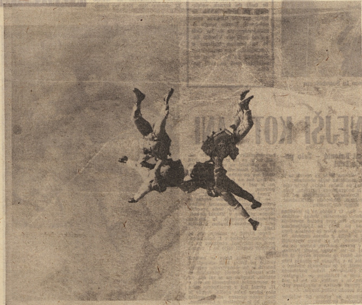
Kaj vse si privoščijo v zraku