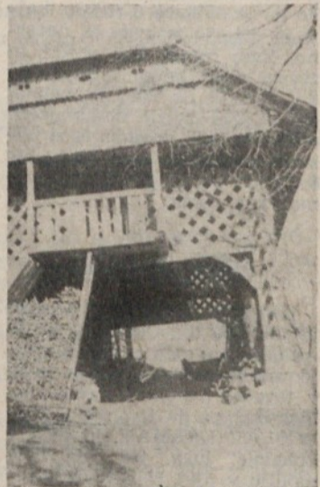
Habičev Kozolec je ena zelo redkih mojstrovčin stavbenišтва kakršno je bilo pri nas pred sto leti

— Čez čas se bom moral tudi jaz spustiti v dolino bliže mestu, če bom hotel šolati otroke. Ločitev od tega prijaznega kottička naše zemlje pa bo po tolikih letih težka. Otroci se bodo najbrž hitro privadili novemu okolju, težje pa bo za naju dva... Be-