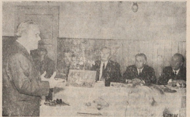
Tovaris Edvard Kardelj v pogovoru s predvojnimi komunisti iz občine Moste-Polje

In vendar za trenutek postojmo. Da si otreemo znoj s potnega čela, da se ponosno nasmehnemo drug drugemu ob pogledu na prehojeno pot, da si še bolj zravnamo neugnano rast prihodnosti, da si pogledamo v oči in zakličemo: Zdravo in srečno ob 1. maju!