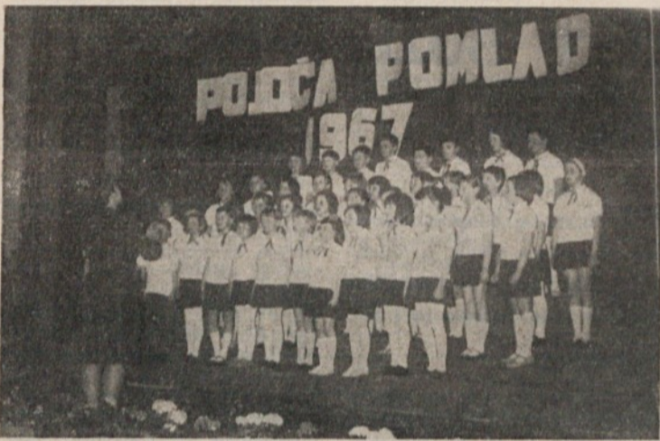
Zbor — gostitelj z osnovne šole Sostro je z uvodnim nastopom odprl letošnjo revijo

VEVŠKI PAPIRNIŠKI PIHALNI ORKESTER pričinja sezono prometnih koncertov. V okviru sodelovanja z Mestno godbo iz Metlike pripravila skupen promenačni koncert v Metliki.