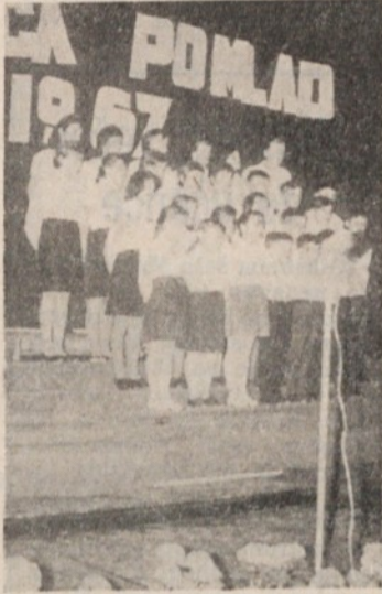
Sicer maloštevilni pionirski zbor z osnovne šole Križevska vas ogrel poslušalce predvsem z drugo svojo pesmijo