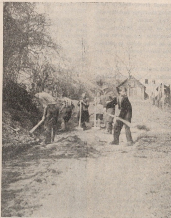
Vaščani iz Javora pri prostovoljnem delu na urejanju cestišča

ljen. Živahno je stopil pred hišo. Dolgo se je vrtel in nameščal na stolu, da bi bil na sliki čim bolj videti. Ni ga motil blišč pomladanskega sonca, ne zelenilo okolja, nasprotno — tudi on je zaživel s pomladjo in smo mu ob slovesu zaželeli, da bi jih dočaka še kar največ.