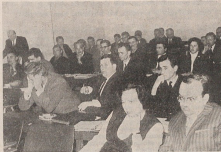
Udeleženci posvetovanja predstavnikov pristaniških in skladiščnih podjetij, ki je bilo nedavno tega v sejni dvorani občinske skupščine Moste-Polje

pravljanja po delovnih enotah. Da je bilo posvetovanje sklicano na pobudo Javnih skladišč, ni naključje, saj so Javna skladišča prav na področju delitve in samoupravnega sistema vzor drugim tovrstnim jugoslovanskim podjetjem.