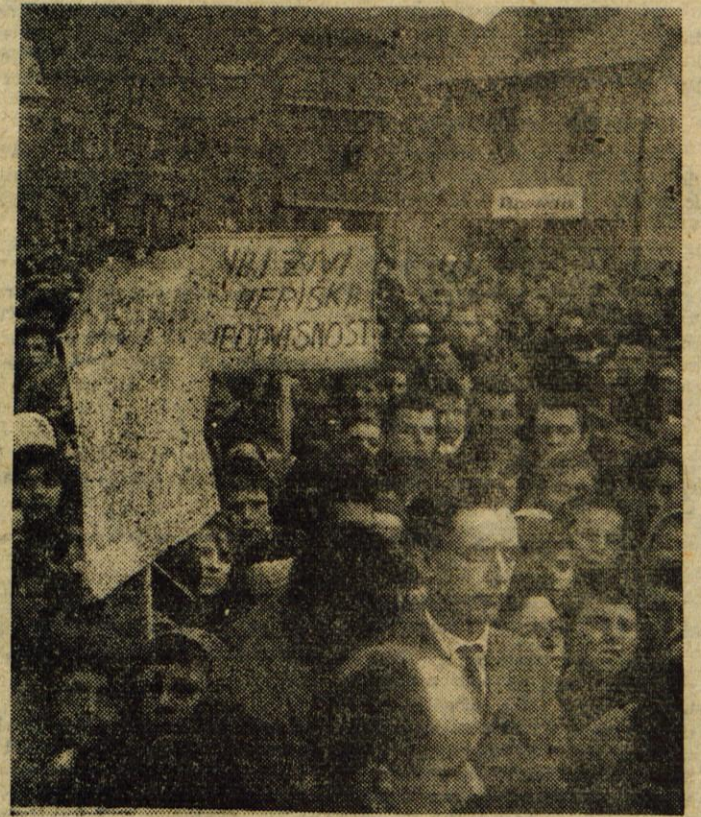
Val ogorjenih protestov proti zločinskemu umoru kongoškega premiera je zajel tudi delavsko središče Jesenice. Po vseh kolektivih so delavci ostro obsojali zapadne kolonialiste, ki hočejo zatreti težnje po svobodi v afriških narodih. Najbolj pa so jeseniški delavci izrazili svoj gnev do belgijskih in drugih kolonialistov na množičnem zborovanju, na katerem so, kot kaže slika, napolnili ulice mesta in sproščeno dali duška solidarnosti z bojem za neodvisnost Konga.

Take in podobne oblike dela je rodila že sama predkongresna dejavnost. Toda člani pričakujejo od kongresa, da jim bo preko izvoljenih delegatov dal še nove spodbude in še konkretnije nakazal nekatere smernice v prihodnjem družbenem razvoju pri nas, kar je zlasti pomembno sedaj, na pragu novega perspektivnega načrta. K. M.