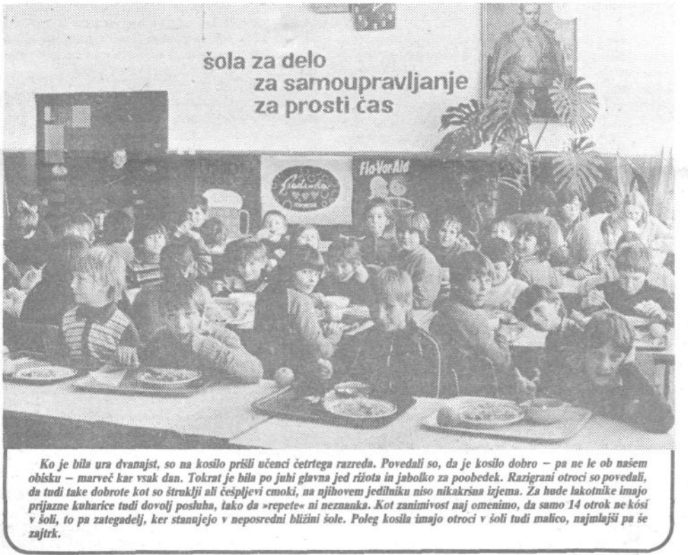
Ko je bila ura dvanaest, so na kosilo prišli učenci četrtega razreda. Povedali so, da je kosilo dobro - pa ne le ob našem obisku - marveč kar vsak dan. Tokrat je bila po juhi glavna jed rižota in jabolko za poobedeč. Razigrani otroci so povedali, da tudi take dobrote kot so štruklji ali češpljevi cmoki, na njihovem jedilniku niso nikakršna izjema. Za hude lakotnike imajo prijazne kuharice tudi dovolj posluha, tako da »repete« ni neznanca. Kot zanimivost naj omenimo, da samo 14 otrok ne kosi v šoli, to pa zategadelj, ker stanujejo v neposredni bližini šole. Poleg kosila imajo otroci v šoli tudi malico, najmlajši pa še zajtrk.