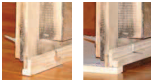
Slika 2, levo: Ko je testni vložek v panju, plodiščno okence in zaporna letvica stojita na njem (krajši krak zaporne letvice je obrnjen navzad). Desno: Ko vložka ni v panju, je krajši krak letvice obrnjen navzpred, tako da okence stoji na njem in kljub temu, da je znižano, zapira celotno zadnjo odprtino plodišča.

Z opisanim testnim vložkom sem leta 2010 tri mesece vsak dan spremljal število odpadlih varov v več 7-, 9- in 10-satnih panjih. Pri tem skoraj nisem vznemirjal čebel, mene pa ni oviralo ne vreme ne pomanjkanje dnevnega časa. AŽ-panji so seveda v čebelnjaku, to je pod streho, tako da me slabo vreme