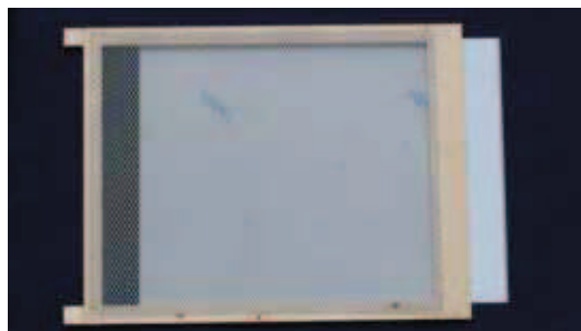
Slika 1: Testni vložek novih mer in izdelave. Zadnja letvica je širša za debelino okenca in za spodnjo debelino zaporne letvice. Je tudi 1 mm tanjša kot pri klasičnem vložku. Testna plošča je iz nerjavečega jekla, debela 0,8 mm; njena zgornja ploskev je prelepljena z zaščitno belo folijo.

6. Zlasti spomladi se lahko že v tednu dni na testni plošči nabere toliko drobirja, da je iskanje in štetje varoj ne samo brezupno, ampak tudi nesmiselno (saj precej drobirja in varoj tudi zastane za zadnjo prečno letvico okvirja). Edino smiselno bi bilo pogostejše štetje (dva- do trikrat na teden), vendar bi to povzročilo veliko več dela in več vznemirjenja čebel – seveda pa bi zahtevalo tudi več sreče s primernim vremenom in več prostega časa v urah z dnevno svetlobo.