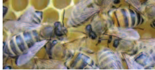
Razlika med kranjsko sivko (levo) in križancem (desno) v obarvanosti obročkov na zadku.

ske čebele. Matic iz Prekmurja oz. Gorenjske tako nismo pošiljali terenskim svetovalcem na Primorskem oz. Štajerskem in podobno. Terenski svetovalci so matice po prejemu dostavili določenim čebelarjem in jim ponudili tudi pomoč pri menjavi.