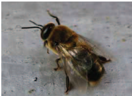
Vloga trotov je pri selekciji zapostavljena.

Ne nazadnje je pred nami še pomembna naloga nacionalnega programa – spremeniti bo treba razmišljanje čebelarjev. »Stanje duha« v slovenskem čebelarstvu je dandanes skrb zbujajoče. Vse preveč