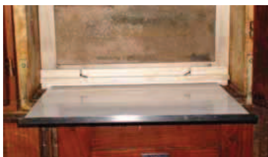
Slika 3: Testno ploščo je mogoče izvelči in vstaviti pri zaprtem plodiščnem okencu. Plošča je povsem ravna in leži neposredno na panjskem dnu. Zaradi tega in ker je zadnja prečna letvica okvirja tanjša, je med testno ploščo in zadnjo letvico okvirja več prostora za drobir kot pri klasičnem vložku.

ni moglo motiti, ker pa imam v čebelnjaku tudi elektriko, sem večino štetij opravil pri luči.