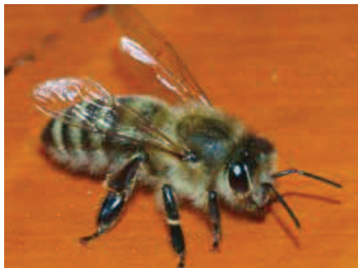
Kranjska čebela je sive barve.

2. Zagotoviti ohranjanje raznovrstnosti genskega sklada kranjske čebele. Samo velika raznovrstnost je zagotovilo, da bodo čebele lahko prežive-