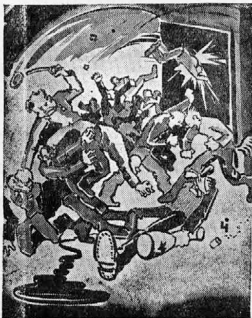
Takole je naš karikist videl sloviti brucovski krst v »Unionu«.

Leto 1934 bo spet zelo razočaralo vse optimiste, ki jih je — žalibog oziroma hvalebogu — čedalje manj. Prišlo bo pa tako daleč, da bodo še ti zginili, pri čemer bo