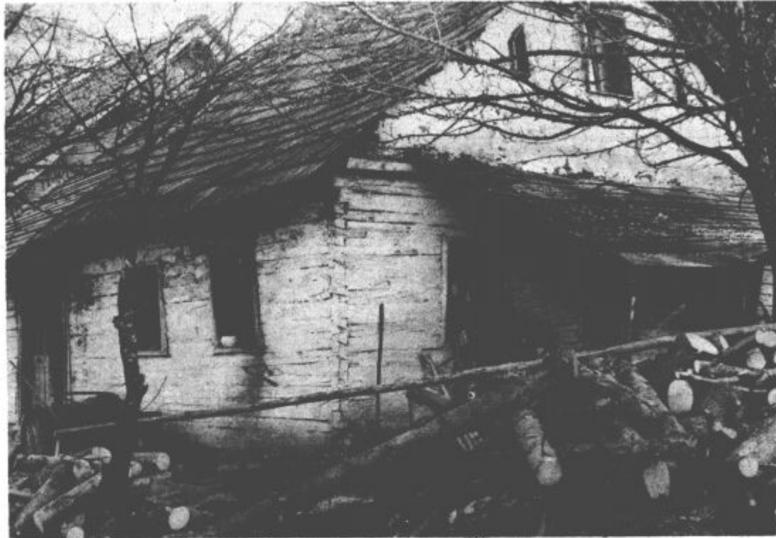
V tej podrtiji je dolga leta životalila 5-članska družina