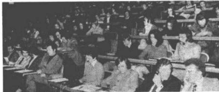
Mladi na volilni konferenci

cijami. V posameznih osnovnih organizacijah bodo ustanovili aktivne mladih komunistov, ki bodo tvorili idejno in akcijsko jedro same osnovne organizacije. Veliko skrb bodo posvečali tudi vzgoji in izobraževanju v okviru ustanavljanja marksiističnih krozkov na vseh šolah, organiziranja raznih tribun in posvetov. Borili se bodo za uveljavljanje novih študentske politike ter se aktivno vključili v priprave za uresničitev celodnevne šole. Zanimarjali bodo tudi mladinskega turizma, naprej organizirali razne lokalne delovne akcije in sodelovali na različnih in zveznih akcijah. Posebej pa se bodo vključili v delo na področju ljudske obrambe in negovali tradicije NOB.