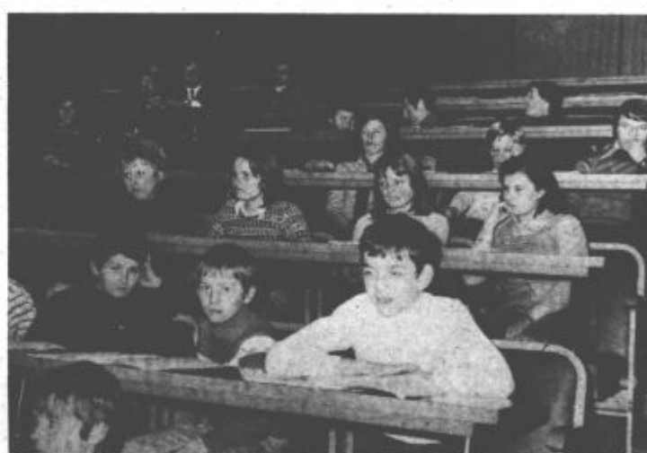
Mladi atleti na občnem zboru atletskega kluba Velenje

Se posebej so se izkazali kot organizatorji atletskega prireditelja Brezhibna in uspela organizacija Balkanskega prvenstva v krosu je bila potrditev uspešnega dela ne samo atletov na stezi, temveč tudi ostalih atletske delavcev v Velenju. Na občnem zboru pa so več govorili o prihodnjih nalogah kluba – „Skrb atletskega kluba mora biti ustvariti pogoje življenja in dela mladim, zasledovati osnovni cilj – oblikovati našo mladino v kar najboljše jutrišnje proizvajalce