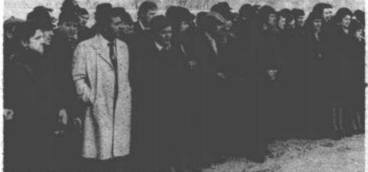
Delavci TOZD elektrostrojnih obratov so začeli uresničevati celovit program.

„Končujem z upanjem, da bodo naša stališča in interesi enotni, in da bodo naša samoupravna prizadevanja za uresničitev teh ciljev ostala tako čvrsta kot so zapisana na listini, ki jo vgrajujemo v temeljni kamen človeških hotenj.“