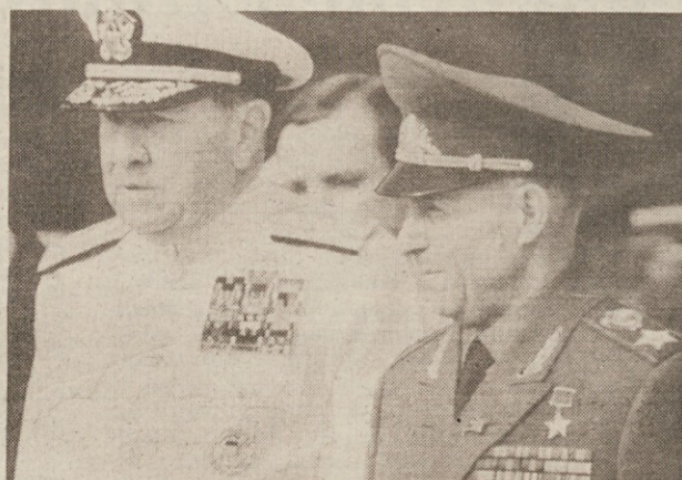
Včeraj je bil na obisku v Pentagonu načelnik sovjetskega generalnega štaba maršal Sergej Ahromejev (desno). Sprejel ga je poveljnik združenega štaba ameriške vojske admiral William Crowe.