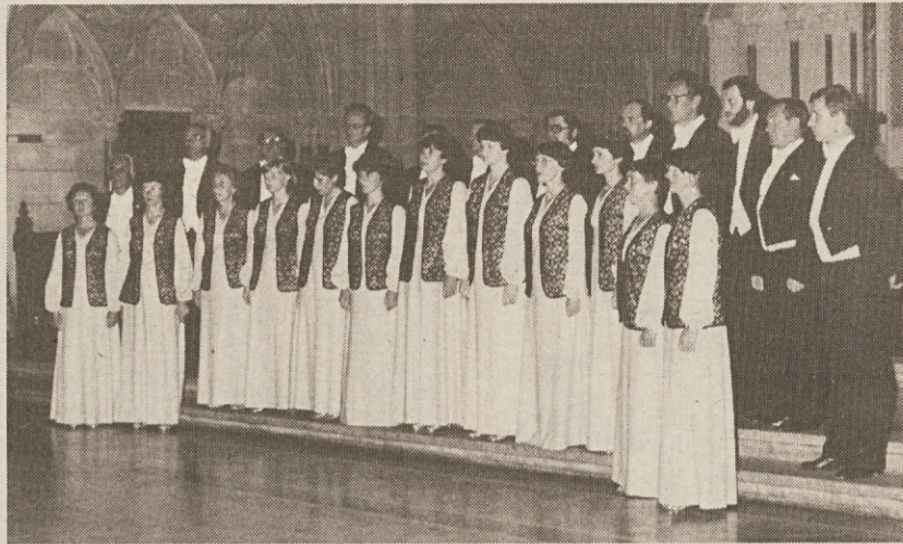
Zbor Moravšti madrigalisté iz Kromeríža na Češkoslovaškem

Strokovni posvet bo v sejni dvorani na razstavišču Espomego v ponedeljek in