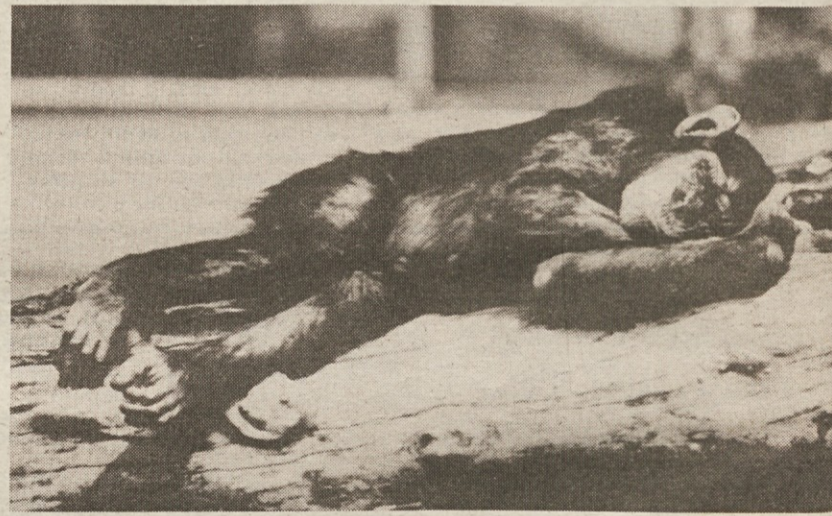
V berlinskem živalskem vrtu je te dni tropska vročina, pa si je mladi šimpanz privoščil popoldanski počitek na afriški način