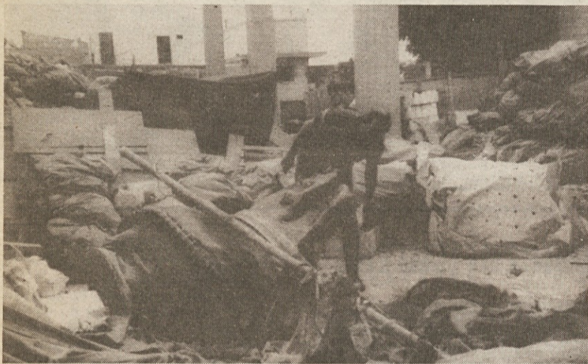
Med rednim vadbenim poletom je pakistansko vojaško letalo vrste mirage včeraj treščilo na neko tovarno v Karačiju. Pri tem je umrlo 15 oseb, 32 pa jih je bilo ranjenih