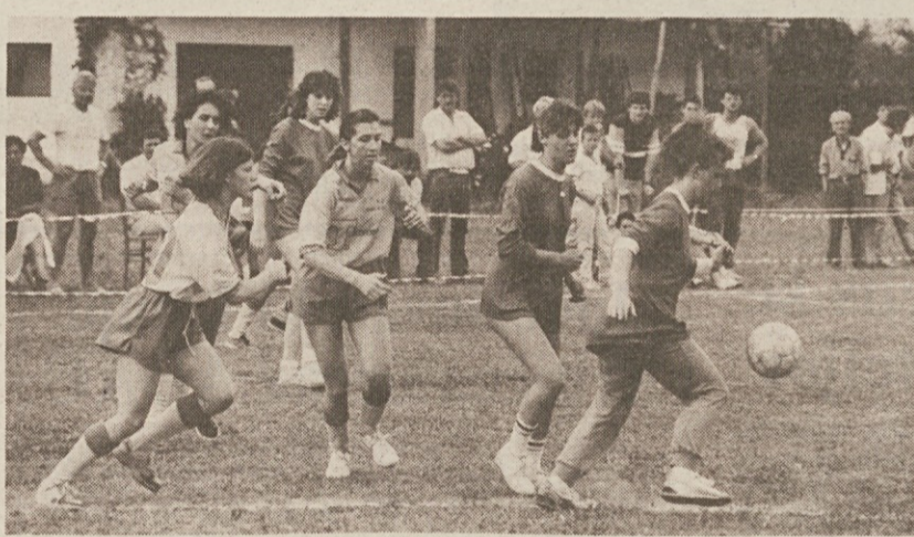
Ženski del tekmovanja vzbuja veliko radovednosti

Prireditve v Gabrjah je tudi tokrat lepo uspela in ob nogometnem igrišču se je na vsaki tekmi zbralo precej občinstva. Še največ moških radovedne- žev pa je bilo med srečanji ženskih ekip. Z navdušenjem so sledili vsemu, kar se je dogajalo na igrišču. Takih dogodkov kot prikazuje naš posnetek, pa je v Gabrjah bilo kar precej.