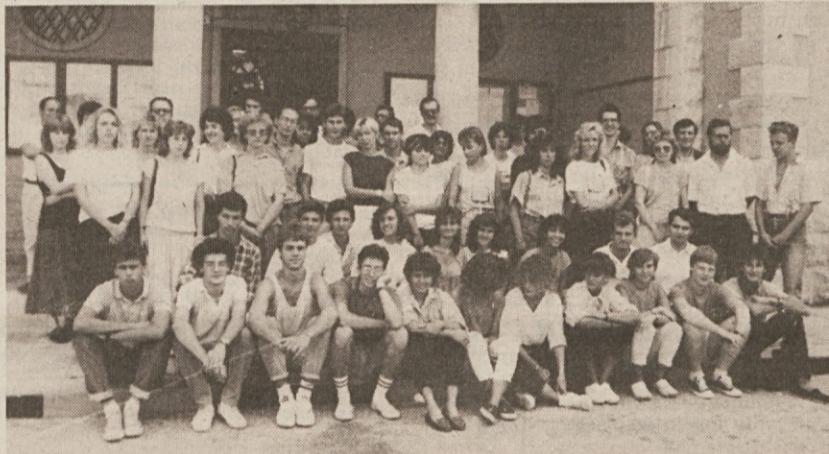
Udeleženci lanskega tabora v devinsko-nabrežinski občini

Za letošnji tabor se je prijavilo nad 30 mladih, večinoma dijakov in študentov, in od tega je več kot polovica takih, ki so bili na taboru že prejšnja leta. Raziskovalce bodo letos razvrstili v sedem skupin, strokovno pa jih bodo spremljali mentorji z obeh strani meje,