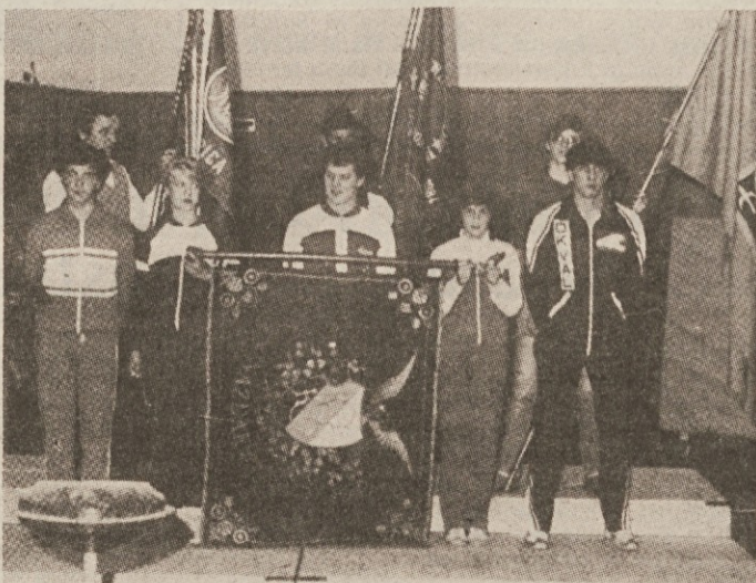
Po osemdesetih letih ponovno razvitje sokolskega prapora v Gorici leta 1984. Telovadna akademija z zgodovinsko razstavo je bila v telovadnici Kulturnega doma. Na posnetku so še prapori Slovenskega planinskega društva Gorica, Deželnega lovskega društva Doberdob in tabornikov Rodu Modrega vala

Prej sem omenil, da bom tu pa tam tvegati tudi kakšno napoved, če gre za premike in spremembe. Sedaj je tak primer: prepričan sem namreč, da ne bodo nekaj časa nič manj uspešne take vrste prireditve tudi v novi telovadnici