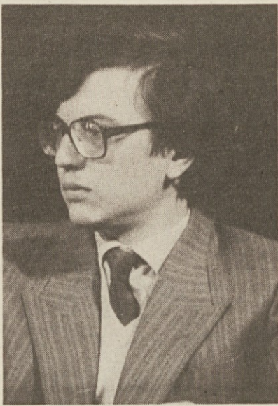
Deželni tajnik SSK Jevnikar

odgovorna vprašanja. Dosegla je namreč zastavljene cilje in kljub zelo težavnemu položaju ohranila svoje zastopstvo v izvoljenih svetih, vendar je izgubila dva rajonska svetovalca v tržaški občini. "Stranka je na deželnih volitvah številčno nazadovala (izgubila je kar 1.783 glasov), največ na Tržaškem, pa tudi na Goriškem in v pordenonski pokrajini, zelo občutno pa v videmskem in v tolmeškem volilnem okrožju. Izidi so boljše glede pokrajinskih volitev. Vse to zastavlja SSK potrebo po globoki analizi izidov, iskanju vzrokov za nazadovanje in pa ukrepov za izboljšanje položaja". Volilne izide bo deželno tajništvo stranke lipove večje podrobno ocenilo jutri na seji, ki bo v Nabrezini.