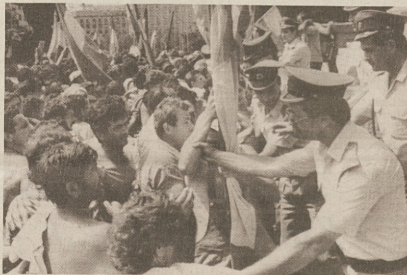
Delavci in milićniki pred zvezno skupščino

Po dogovorih v Domu sindikatov so delavci ugotovili, da niso dobili tistega, zaradi česar so prišli v Beograd, zato so se odločili, da bodo protestno zborovanje nadaljevali pred skupščino SFRJ. V popoldanskih urah je delavce pred skupščino SFRJ nagovoril predsednik predsedstva Hrvaške Ivo Latin. Povedal jim je, da se v republiki zavedajo položaja, v katerem se je znašlo Borovo. Obvestil jih je, da bo sabor 20. julija razpravljal o sanacijskem programu, nato pa jih je pozval, da bi bilo razumneje in bolj dostojanstveno, če bi pogovore nadaljevali v tovarni. Njegove besede so delavci pospremili z neprestanim ponavljanjem, kako je potrebno takoj povečati osebne dohodke. Latin jih je prosil, da bi ga poslušali, toda delavci so reagirali z žvižganjem. To ni arena, je dejal Latin, nakar so ga delavci prekinili, da bi do konca povedal, kar je mislil. (dd)