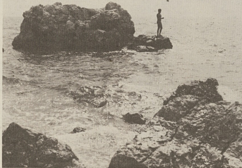
Za skok v motno vodo pa je le treba imeti nekaj poguma...

Pet kopaljš je namreč že tri leta zaprtih. Pri Dami bianci, v kopaljših pristaniške ustanove in železničarjev, v kopaljših Muggesan in Velikih motorjev je morska voda v glavnem nasičena z raznovrstnimi bakterijami, ki prinašajo virusne bolezni. Tudi ob obali Ribiškega naselja, kjer sicer ni kopaljša, stalno beležijo previsoke količine bakterij. Druga boleča točka, za katero naravovarstveniki — pred kratkim pa tudi sindikat CGIL — krijejo krajevne uprave, pa je nezadovoljivo čiščenje grezničnih odpadkov in nezadostno število čistilnih naprav. V grezničnem omrežju tržaške pokrajine namreč ni učinkovitih naprav, ki bi dokončno klorirale in nato še deklorirale odpadne vode (to je edini način, da »steriliziramo« človeške odpadke in da hkrati ne onesnažimo morja). Po fotografskem gradivu, ki ga je pred kratkim zbral oddelek za javne službe CGIL, pa celo kaže, da se v Škednju izlivajo v morje greznične vode, ki ne gredo skozi noben filter. Pogosto pa se tudi dogaja, da pride zaradi preprostega (!) neurja do okvar na kanalizacijskem sistemu tik pred kopalno sezono, kar dokazuje, da bi