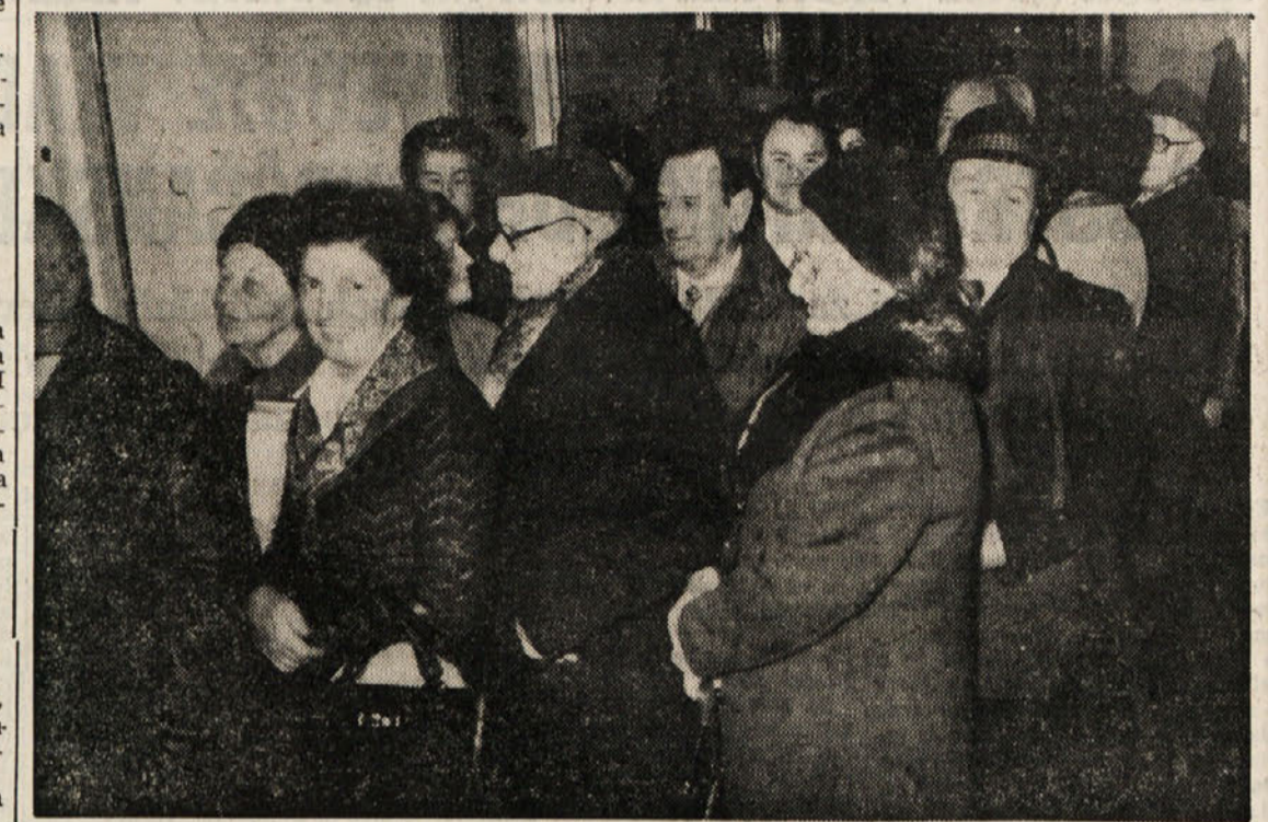
Pred sobo št. 22 so večeraj zjutraj že navsezgodaj čakali, da bi se vpisali za izlet Primorskega dnevnika

Za tri izlete na Poljsko oddani že dve tretjini razpoložljivih mest - Prostorji so tudi še za izlet na Daljni vzhod