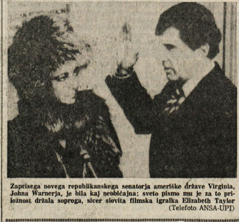
Zaprisega novega republikanskega senatorja ameriške države Virginia, Johna Warnerja, je bila kaj neobčujna: sveto pismo mu je za to priložnost držala soproga, sicer slovitna filmska igralka Elizabeth Taylor