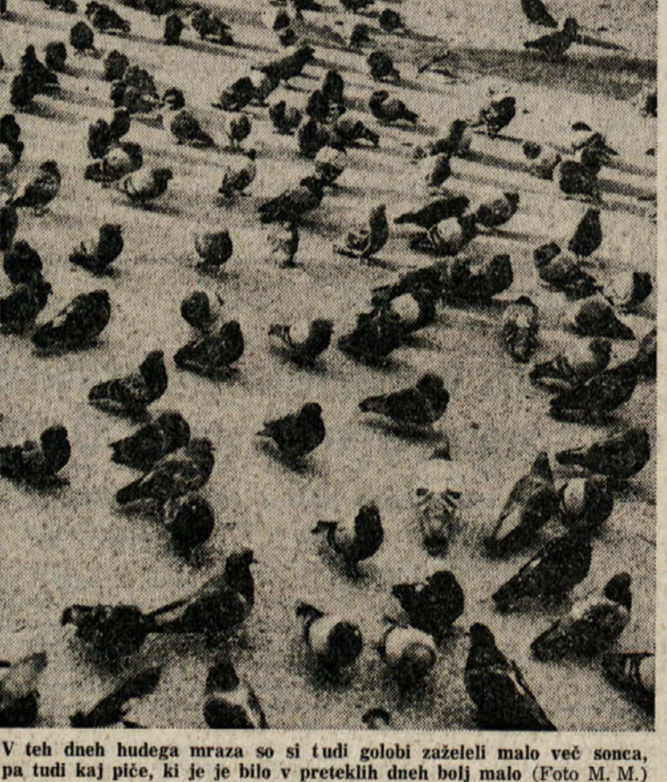
V teh dneh hudega mraza so si tudi golobi zatekli malo več sonca, pa tudi kaj pite, ki je je bilo v preteklih dneh bolj malo