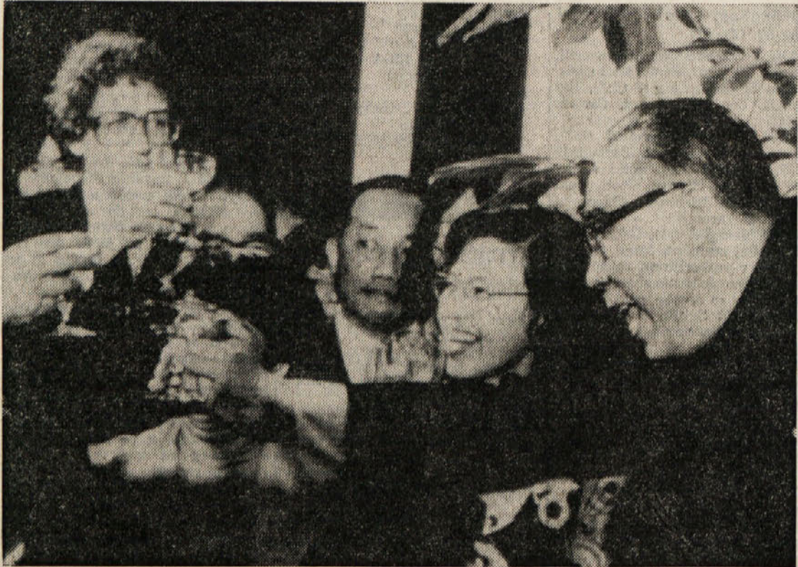
Gala sprejema v proslavitev normalizacije kitajsko-ameriških odnosov se je včeraj udeležil tudi bodoči pekinški veleposlanik v Washingtonu (na sliki desno), ki je med napitnico naglasil, da bo sodelovanje v velebilama zajezilo sovjetski ekspanzionizem in agresivnost