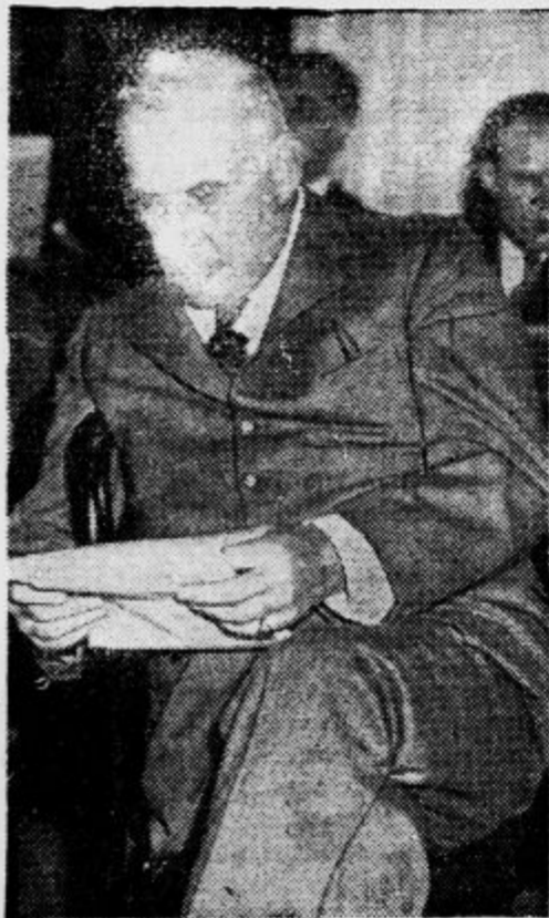
Ameriški finančnik John Pierpont Morgan, ki je svojo dosežanje banko spremenil v zasebno podjetje