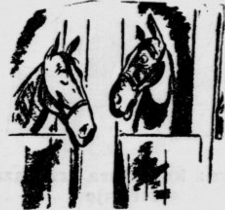
»Ali bi me uslišala, če bi zmagal pri naslednjih konjskih dirkah?« (»Judge«)