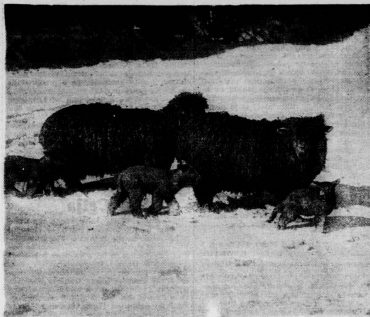
Ta prikupen posnetek so napravili v Devonu na Angleškem