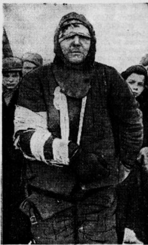
Ranjen ruski vojak, ki je prišel na bojišče v roke finskih sanitetcem. Za njegovim hrbtom je zbrana radovedna mladina