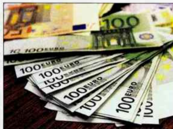
Pošiljatelji obvestil kvazi elektronskih loterij naslovniku obljublajo denarne dobitke od nekaj tisoč do milijonov evrov.

Prav tako tudi v Sloveniji še vedno krožijo tudi t. i. nigerijska pisma in druga afriška pisma, v katerih pošiljatelj prosi prejemnika za pomoč pri izvedbi transakcije, za kar mu obljublja določen odstotek denarja. Tudi zanje se je izkazalo, da gre za go-