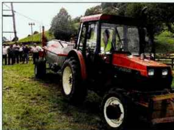
Kmetje bodo letos morali plačati davek že od polovice prejetih subvencij.

Društvo kmetov ter žena in deklet na podeželju Ježica - Dol in kmetijska svetovalna služba bosta tudi letos pripravili tradicionalno velikonočno razstavo. Razstava bo na cvetno nedeljo, 9. aprila, od 18. do 17. ure v župnišču na Ježici. C. Z.