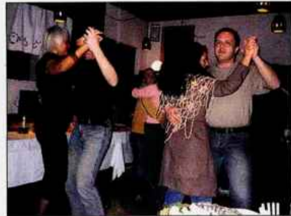
Valček, polka in rock'n'roll.