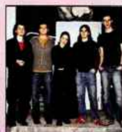
I.C.E. / Foto: Polona Baldasin

je tudi zapel. Hatlak je vsekakor dokaz, da harmonika ne služi zgolj preigravanju polk in valčkov, saj se v svetu glasbe kot izredno zahteven instrument, ki daje neverjetno veliko možnosti, vedno bolj uveljavlja.