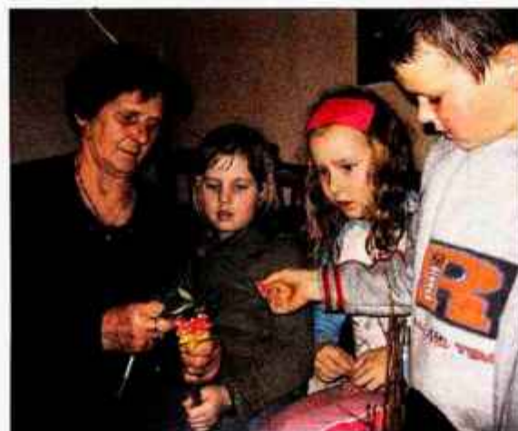
Velikonočna delavnica v Budnarjevi hiši v Zgornjih Palovčah pri Kamniku.

butarice navadno niso bile narejene iz lesov, ki jih uporabljajo za "beganice" na podeželju. Večinoma so bile namenjene meščanom, ki niso imeli svoje zemlje in ne živine in zato s sedmerimi (deveterimi lesovi), ki so jih kmetje sicer razporedili v različne kote na svoji kmetiji, niso imeli kaj dosti početi. Tudi njihova izdelava je zahtevala kar nekaj natančnosti in truda. Večinoma so bile te butare pobarvani, umetno zaviti in naokrog napolnjeni oblanci. Po blagoslovitvi pa so bile te butare večinoma predvsem lep sobni okras.