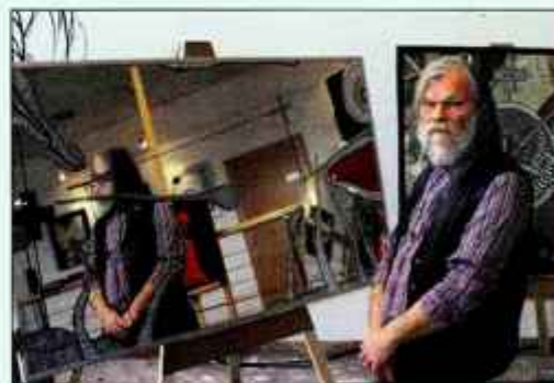
V spremljevalnem programu je nastopil Mešani pevski zbor Iskra Kranj.

niško izživetje uporablja tradicionalna izrazna sredstva, s katerimi sledi novim izzivom in poskuša ustvariti nekaj drugačnega, še nevidnega. Prežet je z nenehno raziskovalnostjo, z iskanjem novih likovnoformalnih in vsebinskih rešitev, znotraj katerih mu uspeva ohraniti avtorsko prepoznavnost, je ob odprtju razstave povedala umetnostna zgodovinarica Anamarija Stibilj Šajn. Po takih pravih ustvarjalnosti bi se morali ravnati vsi, brez izjem, ne le najpogumnejši. "Vsi potrebujemo nove ideje, da bi lahko v neprizanesljivem tekmovalnem svetu uveljavili edino prednost, ki