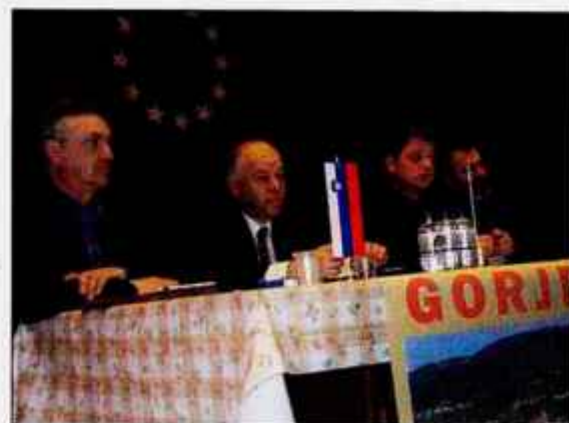
Z javne tribune v Gorjah.