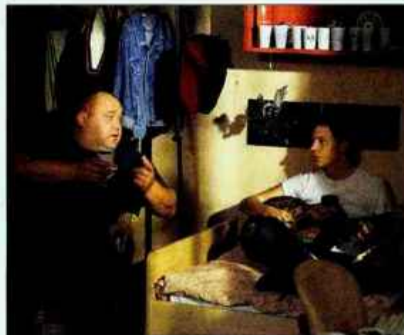
Prva epizoda ima naslov Marihuana.

koval že v svojem prvencu "Kruh in mleko". Iz epizode v epizodo spremljamo "poslovne napore" Perota, družinskega očeta, ki ob obveznem pivu in nasvetih starega zvestega prijatelja Fernandla skuša bolj ali manj uspešno polniti družinski proračun. Ob tem ga ljubeče podpira bistra boljša polovica Alma. Za dinamiko v družini dodatno skrbi njun sin, srednješolec Bobi. V svetu preprostih in toplih ljudi, kjer brezposelnost ni nujno tragedija, kjer denar ni nujno sveta vladar, kjer kilogrami niso merilo nepopolnosti, srečamo vse fenomene sodobnega slovenskega življenja, jih prepoznamo in se