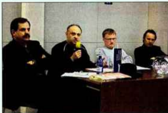
Predstavniki Razvedrilnega programa Televizije Slovenije in ustvarjalci prireditve so v začetku marca festival predstavili podrobneje.