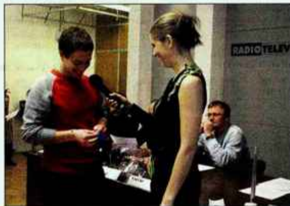
Član ansambla Storžič je izžrebal številko ena.

popestrili plesni nastopi plesalcev iz plesne šole Mojce Horvat in priredbe iz zakladnice slovenske narodne glasbe v izvedbi Per-