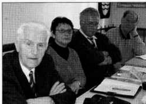
Del udeležencev sestanka o projektu Za višjo kakovost življenja doma.

Največji problem starejših ljudi je osamljenost, pri tem pa bi jim v okviru projekta lahko največ pomagali prostovoljci iz upokojenskih društev.