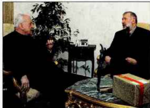
... in z zunanjim ministrom dr. Dimitrijem Ruplom.