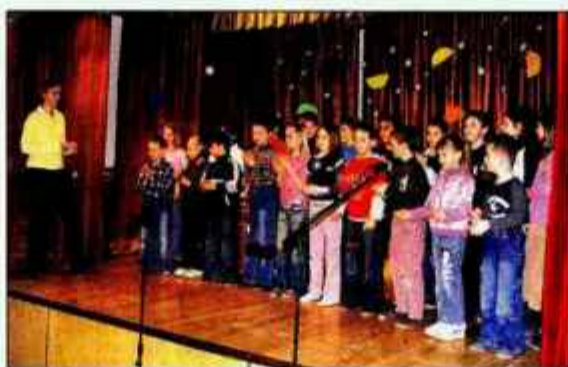
Učenci v Podljubelju so se letos posvetili vodi.

Program, ki so ga pripravili učenci, je bil tako povezan z vodo. Prvošolčki so zaigrali igro Pod medvedovim dežnikom, učenci drugega in tretjega razreda so na zabaven način predstavili vodo v različnih agregatnih stanjih - sneg so, na primer, prikazali kar s priljubljeno Sankško polko. Četrtošolci so organizirali modno revijo z dežniki. Prikazali so tudi kratek šestminutni film Kako smo postavljali mlin-