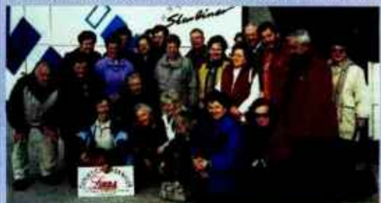
Z nageljni in dobro voljo - udeležence in spremljevalci izleta za materinski dan na Limbarsko goro.

Prijave: Gorenjski glas: 04/201 42 41; narocnine@g-glas.si / vplačilo rezervacije 3.000 sit (12,52 eur) v agenciji Linda, Staneta Žagarja 32, Kranj: 04/235 84 20 ali 041/248 773