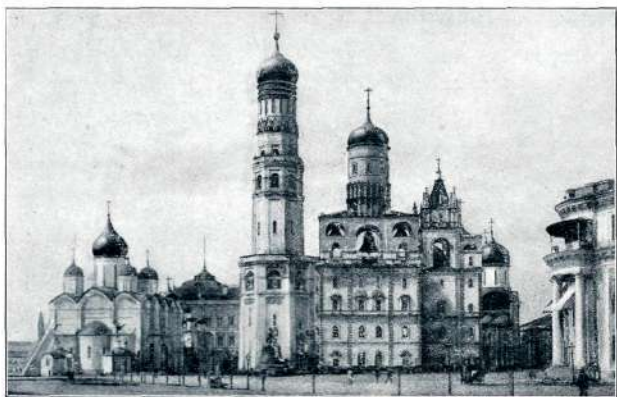
Moskva: Zvonik Ivana Velikega.

ob počitnicah, prilezejo malčki do matuške Moskve in na široko odpirajo usta, ko jim učitelj in učiteljica razlagata kremlevske znamenitosti.