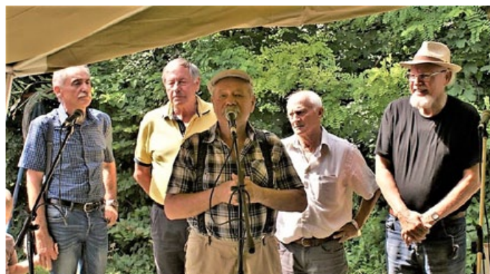
Ustanovni člani Radiokluba Cirkulane.

Poleg vseh izzivov, ki so jih morali rešiti za obstoj in razvoj dejavnosti, je bil gotovo največji selitev na novo lokacijo v lastne prostore v Pohorju 25 a (lokator: JN76XH). Od leta 2008, ko je bila otvoritev majhne obnovljene hiške, je zrastle pravi radioamaterski dom, na katerega so ponosni vsi člani RADIOKLUBA CIRKULANE. Vanj se je zlila energija vseh radioamaterskih generacij, ki so v Cirkulanah vzpostavljali veze s celim svetom, in številnih sponzorjev in donatorjev, ki so s pomočjo pridnih rok omogočili njegov nastanek. Za razvoj radioamaterstva v Cirkulanah naprej so dani odlični pogoji in z odlično ekipo članov bo razvoj tudi šel naprej. Kljub modernim možnostim komuniciranja s svetom bo radioamaterstvo še vedno izziv. Znak S59DDR ali pa S59H bo odzvanjal v etru tudi v prihodnje.