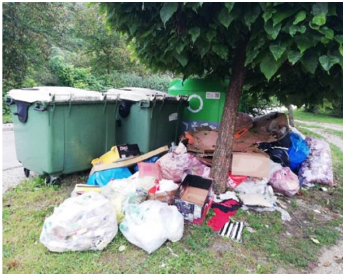
Odpadki v naravi so velik problem.

veznih občinskih gospodarskih javnih služb ravnanja s komunalnimi odpadki in Tehnični pravilnik o ravnanju s komunalnimi odpadki prepovedujeta kakršno koli ravnanje v nasprotju z določili odloka, tehničnega pravilnika in drugih predpisov, ki urejajo ravnanje s komunalnimi odpadki, so podatki zadnje čistilne akcije Očistimo Slovenijo 2018 pokazali, da temu ni tako.