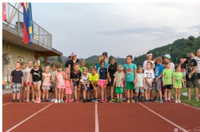
Na letošnjem že 12. Aninskem teku.

U7, U9, U11, U13 ter U15, slednja selekcija je skupna z NK Zavrč. Otroci nastopajo v ligah MNZ Ptuj, redno se udeležujejo turnirjev in prijateljskih tekem in pod strokovnim vodstvom trenerjev pridno nabirajo nogometne izkušnje.