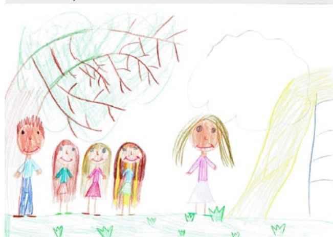
Nia Žuran, 2. a