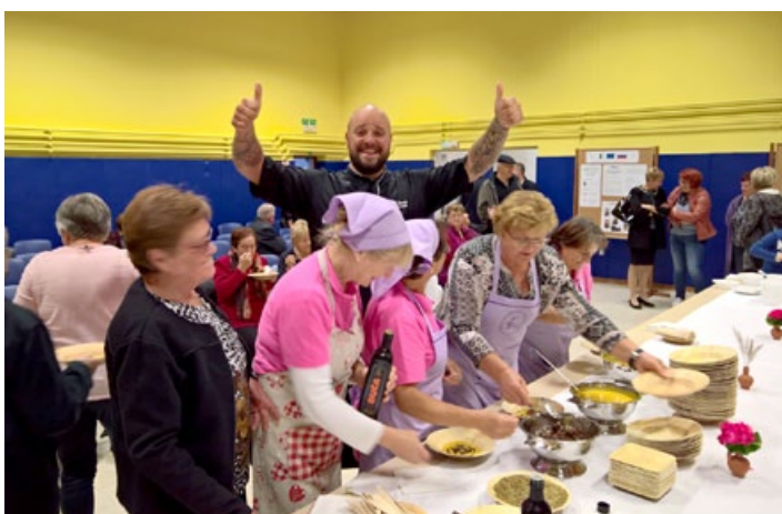
Pri cirkulanskih gospodinjah se zmeraj kaj dogaja ...