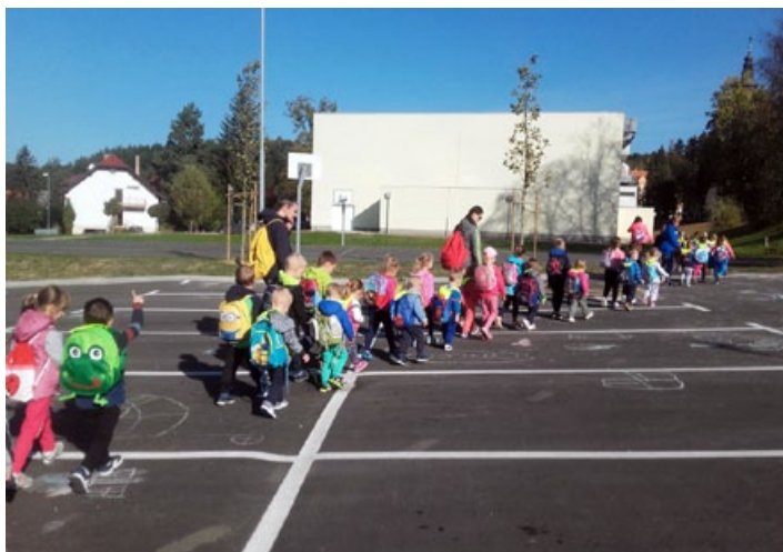
S polnimi nahrbtniki smo se podali na Gradiški Hum. Bravo mi.

nam je omogočila izvedbo samega programa. Namen Kolesarčkov je preko igre otrokom na neprisiljen način predstaviti in jih poučiti o vedenju v prometnem okolju. Otroci so na štirikolesnikih na nožni pogon spoznavali prometne znake, pravila v prometu in pravilno prečkanje cestišča. Tukaj vsekakor ne smemo pozabiti omeniti, kakšne pohvale smo bili deležni. Izvajalci programa so zelo pohvalili motorične sposobnosti naših otrok ter izpostavili, da smo eden redkih vrtcev s tolikšno motoriko.