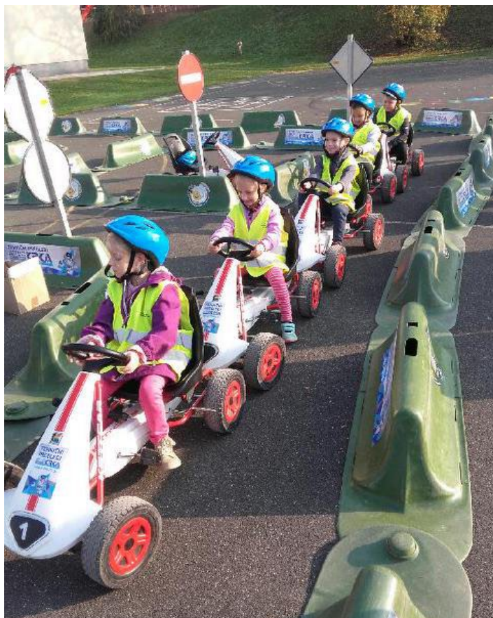
Pikapolonice so spoznavale pravila v prometu.

si zagotovo ne morete predstavljati. Mi pa vam s ponosom povemo, da smo vse te »muhe« in izzive z veseljem obkljukali ter šli novim zmagam naproti.