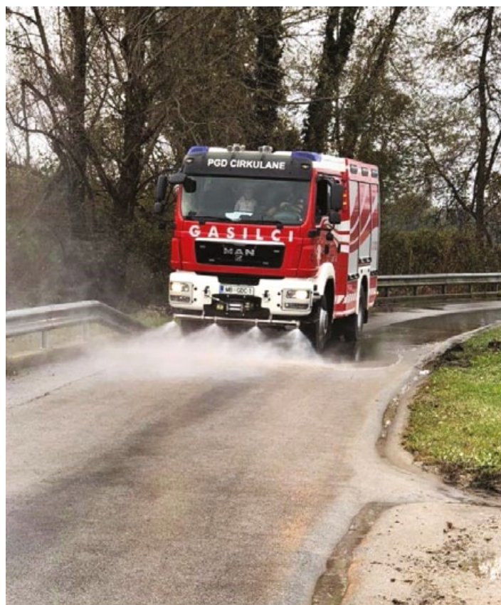
Na praznični dan, 1. novembra, so operativci PGD Cirkulane pomagali gasilcem PGD Stojnci pri čiščenju poplavljenega cestišča.