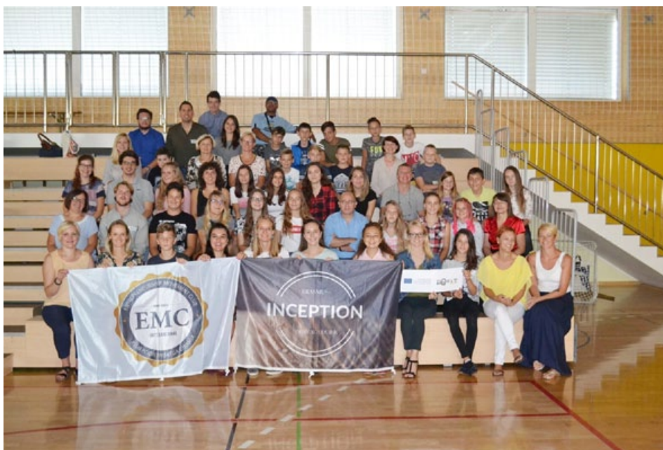
Udeleženci Erasmusovega projekta TwInception.

V mesecu oktobru se naše ERASMUS+ sodelovanje nadaljuje. Naši partnerji bodo Hrvaška, Latvija in Klub podjetniškega gibanja. Gre za raziskovalni pro-