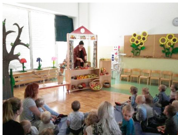
Spoznali smo branjevko in dobre te tržničnega dne.

Kmalu za tem smo na obisku imeli gasilce in člane civilne zaščite. Izvedli smo še eno uspešno evakuacijsko vajo, kasneje pa pogumno raziskovali gasilsko vozilo in pripomočke.