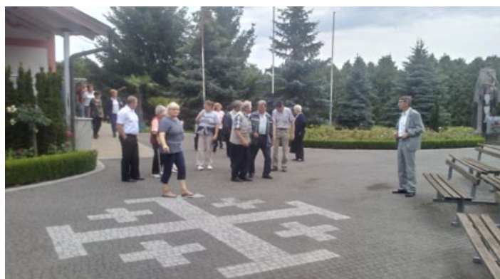
Barbarski romarji pred kapelo zaobljube.

Tako je v soboto, 16. junija, ob pol osmi uri zjutraj avtobus romarjev krenil iz Cirkulan, čez mejni prehod Zavrch proti našemu glavnemu cilju: Ludbregu. Tja smo sicer prispeli z manjšo zamudo, a še vedno dovolj zgodaj, da nam ni bilo potrebno spreminjati načrtovanega programa. V cerkvi Svete Trojice smo najprej opravili romarsko sveto mašo. Namesto pridige pa nam je domači župnik v nekaj kratkih besedah orisal zgodovino mesta in cerkve. Po njegovih besedah je bila na tem področju poznana naselbina že v rimskem obdobju, v 4. stoletju bi naj imela že tudi škofa, a je v obdobju preseljevanja narodov naselbina propadla. Po legendi naj bi mesto osnoval plemič Lotbring 1100 ob vrnitvi s križarskih vojn. Cerkev je bila zgrajena približno dvesto let kasneje in naknadno barokizirana. Čeprav ne obstajajo nobeni pisni dokumenti, pa izročilo pravi, da se je leta 1411, leto po posvetitvi cerkve, v kapelici bližnjega dvorca zgodil nenavaden dogodek. Med mašo se je duhovniku, ki je dvomil v resničnost besed spremitve, med lomljenjem hostije v kelihu pojavila resnična kri. Prestrašeni duhovnik je tekočino shranil v stekleno po-