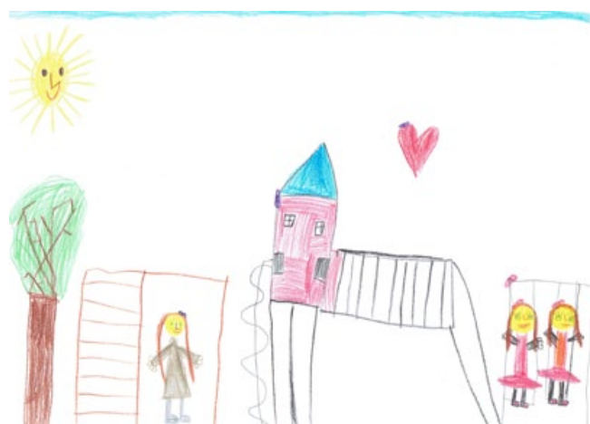
Iva Pisanec, 1. a