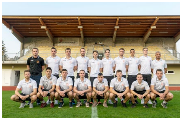
Članska ekipa NK Cirkulane v letošnji sezoni nadaljuje z dobrimi igrami ...

Kot vedno smo naprej aktivni pri delu z mlajšimi selekcijami. Trenutno pri nas trenira približno 60 otrok v selekcijah