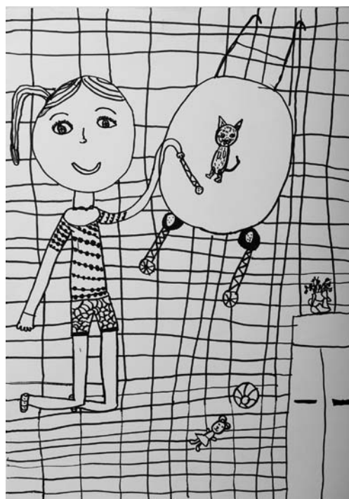
Rubi Kolednik, 5. a