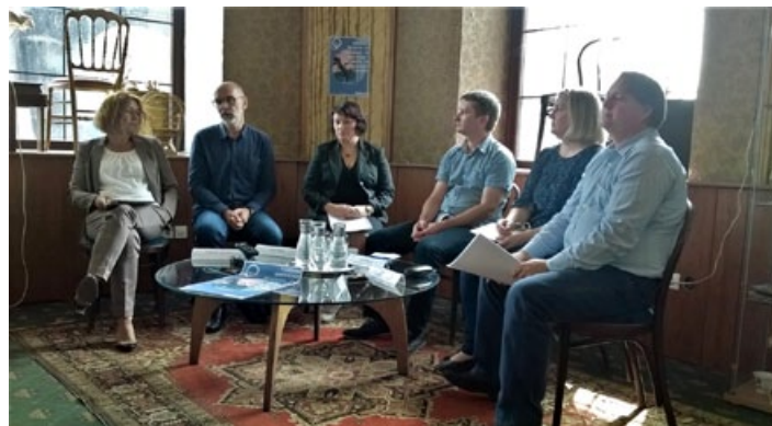
Utrinek s tiskovne konference.

da podeželska območja obsegajo okrog 90 % ozemlja EU, na katerih živi približno 60 % prebivalstva (SURS, 2016). Spremljanje razvoja podeželja je ena od prednostnih problematik področij EU. Dejstvo je, da se posamezna podeželska območja med sabo močno razlikujejo, tako na ravni EU kot na ravni Slovenije. Glavni cilj razvojnih programov je, čim bolj zmanjšati razlike med območji in zagotoviti trajnostni razvoj na družbenem, okoljskem, predvsem pa gospodarskem področju. Uvajanje pristopov socialnega podjetništva, združništva na območju Haloz lahko da pozitivne odgovore na nekatere od demografskih, gospodarskih, okoljskih in širših družbenih problemov, kot so: staranje prebivalstva, odseljevanje mladih in delavno aktivnih prebivalcev, ki so bolj izobraženi. Pomanjkanje delovnih mest, pomanjkanje opremljene infrastrukture, obmejnost in obrobnost, manj ugodni naravni pogoji za kmetijstvo so ključni razlogi, da govorimo o strukturnih problemih podeželja na območju Haloz. Z iskanjem inovativnih družbeno odgovornih rešitev, ki temeljijo predvsem na povezovanju in združevanju kadrovskih virov, zainteresiranih deležnikov z razvito podjetniško kulturo je možno s pomočjo pristopov socialnega podjetništva in združništva