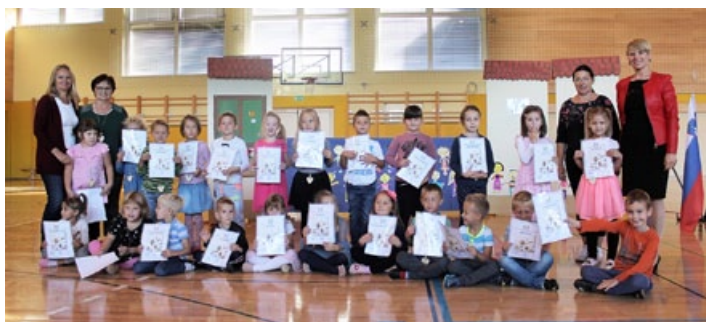
Sprejem prvošolčkov v šolsko skupnost.