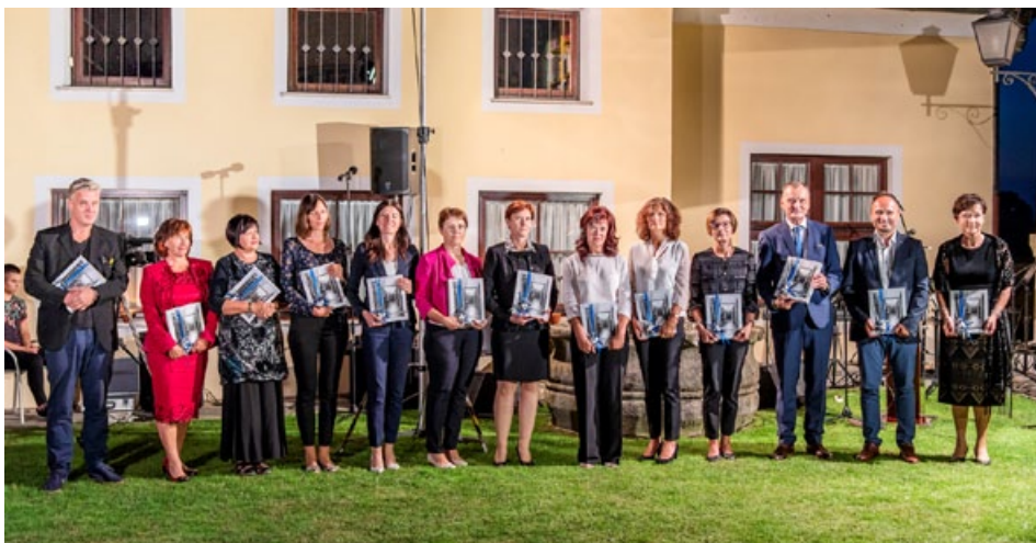
70 let delovanja Knjižnice Ivana Potrča Ptuj so knjižničarji obeležili z izdajo jubilejnega zbornika in z razstavo prestižnih knjižnih izdaj.

V zadnjem desetletju dopolnjuje knjižnica svoje delovanje z različnimi storitvami v digitalnem okolju. Uporabnikom zagotavlja dostop do elektronskih baz podatkov ter elektronskih arhivov serijskih publikacij, skrbi za digitalizacijo knjižničnega gradiva in njegovo vključitev na domoznanski portal Kamra ( www.kamra.si ) in Digitalno knjižnico Slovenije ( www.dLib.si ), s čimer zagotavlja trajno ohranjanje knjižničnih gradiv in pisne kulturne dediščine nacionalnega pomena. V dLib je