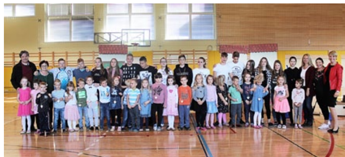
Mali in veliki prijatelji (1. a in 9. a z učitelji).