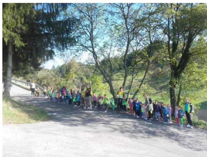
Veselo na pohodu.