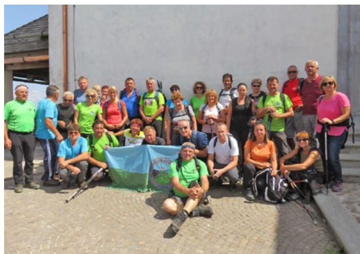
V družbi planincev PD Haloze in PD Hajdina na Višarje.

Svete Višarje so romarski kraj Slovanov, Germanov in Ro-