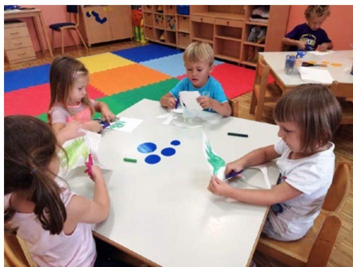
S škarjicami so se rokovali Sončki.

ja, predvsem pa časa, ki ga namenite najbližjim. Še preden pa se leto uspeha poslovijo, se slišimo in beremo v dnevih, ko bo iz marsikatero kuhinje pridišalo po okusnem čaju in toplih piškotkih. Mmm ... tudi mi pripravljamo majhno presenečenje.