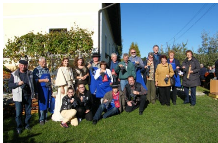
Člani DVS Haloze, ki so prinesli svoje grozdje na ocenjevanje, v družbi vinskih kraljic.