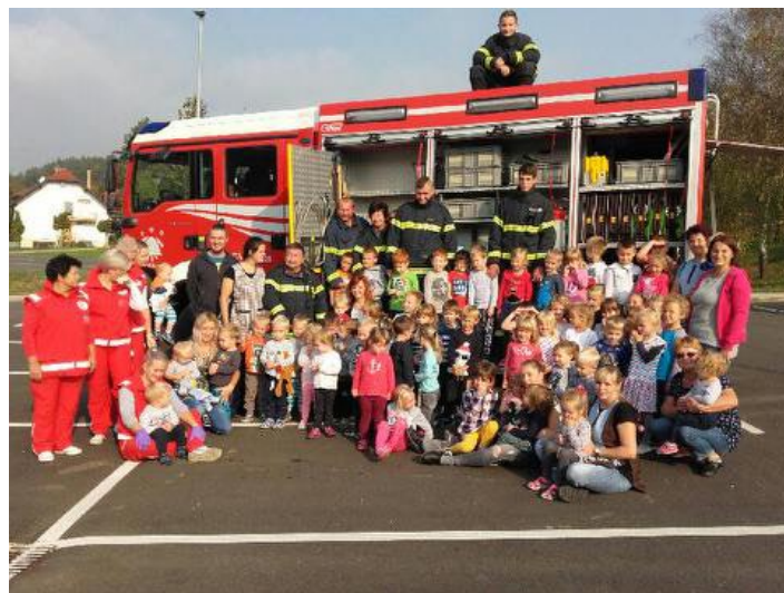
Uspešno smo izvedli še eno evakuacijsko vajo.