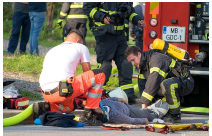
Utrinki z vaj v mesecu varstva pred požari.

V mesecu juniju smo se člani društva odpravili na strokovno ekskurzijo, k poklicnim gasilcem gasilske brigade v Puli, ki je ena največjih poklicnih brigad na Hrvaškem. Pri ogledu gasilske tehnike, s katero razpolagajo, ter s področjem, ki ga