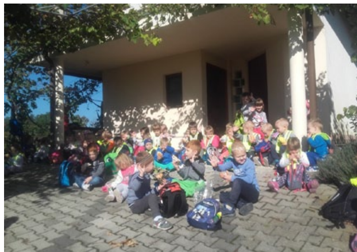
Obvezen počitek in težko pričakujoča malica na pohodu vrtca.

Ob hladnih jutrih, ki prihajajo, vam želimo le dobrega zdrav-