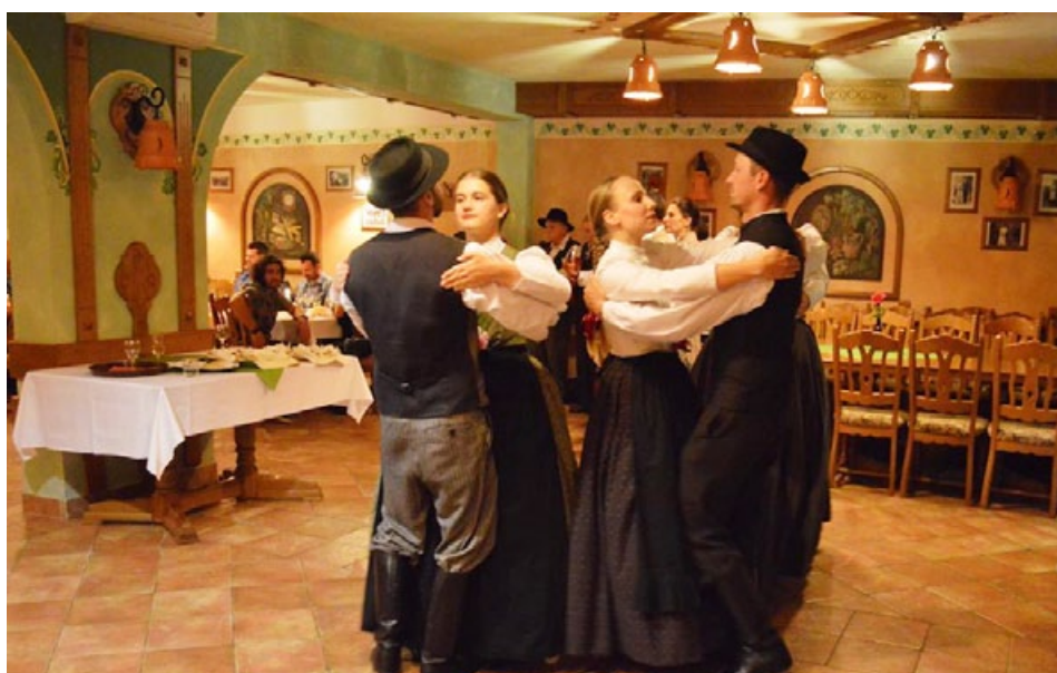
Plesali smo na kulinaričnem večeru na Turistični kmetiji Pungračič.