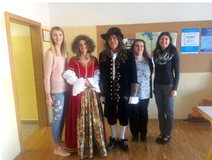
Člani društva kot gostje kulturnega dne v osnovni šoli v Cirkulanah.

Tako smo nadaljevali z akcijo zbiranja spominov na Borl, izdali smo novo številko lastnih Novic in pred Borlom pozdravili več skupin obiskovalcev, ki jih zanima zgodovina gradu in delovanje našega društva.