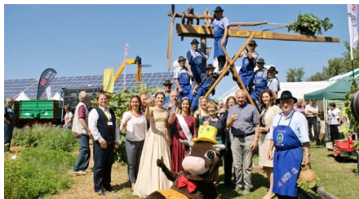
Člani TD Cirkulane – stari običaji slavnostno postavili klopotec na sejmu v Gornji Radgoni.