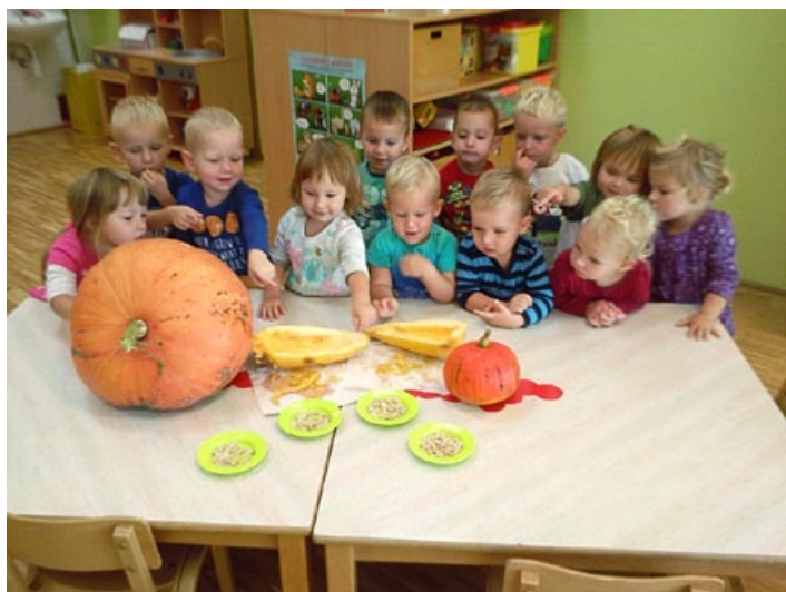
Pri Škratih se je na obisku oglasila buča velikanka.

podali na dolgo pričakovane počitnice, kmalu zatem pa se že srečali ulico višje, med šolskimi klopmi. Ponosni smo na prav vsakega posameznega otroka, skupino in vzgojitelja, ki je znal v preteklem šolskem letu pričarati življenje v vrtcu čarobno, zabavno, predvsem pa pustolovsko. Koliko smeha, radovednosti in včasih trme je prisotno v našem vsakdanu,