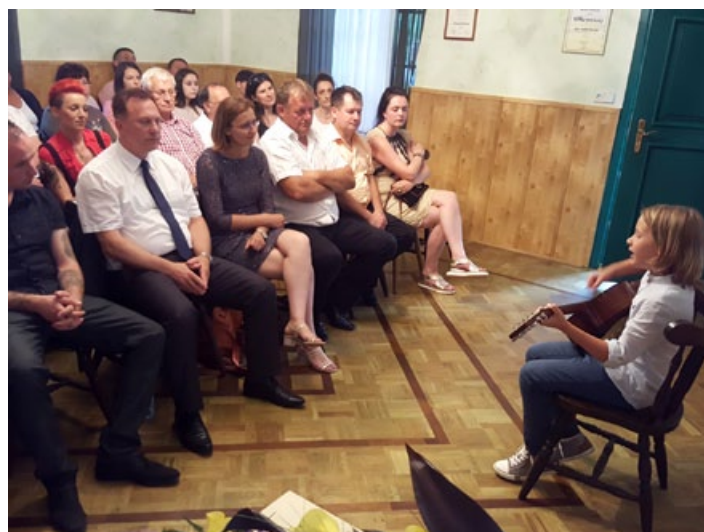
Dan pred osrednjo občinsko proslavo je bila v prostorih lovskega doma slavnostna seja občinskega sveta z vabljenimi gosti in občinskimi nagrajenci.