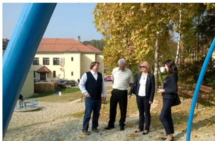
Člani SMC Cirkulane so poslanko seznanili z aktualnimi projekti v občini.