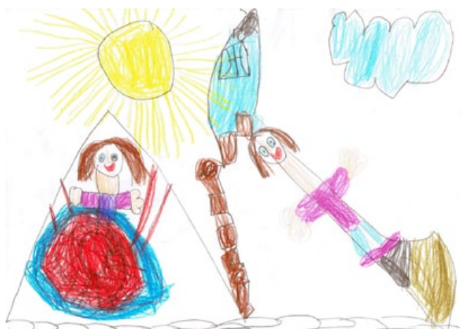
Neža Tolič, 1. a