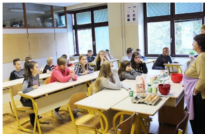
7. a z Društvom gospodinj na kulturnem dnevu.