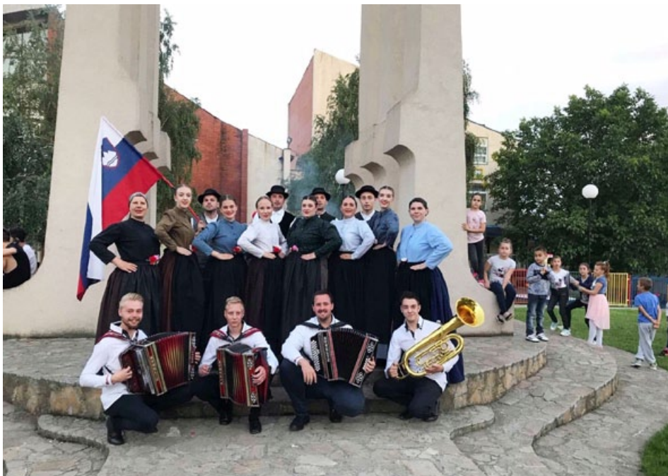
Na turneji v Srbiji so z nami bili tudi člani Harmonikarskega orkestra Modras.

ti. Konec novembra za vas prirejamo tradicionalni letni koncert, na katerega prav lepo vabljeni že sedaj. Biti del folklorne in član Folklorne skupine Cirkulane je res nepozabna izkušnja. Poleg plesa, dobre volje in novih prijateljev spoznavamo slovensko ljudsko izročilo, ki je tako pisano in zanimivo.