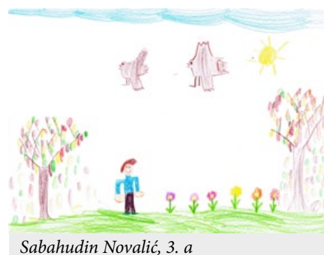
Sabahudin Novalić, 3. a