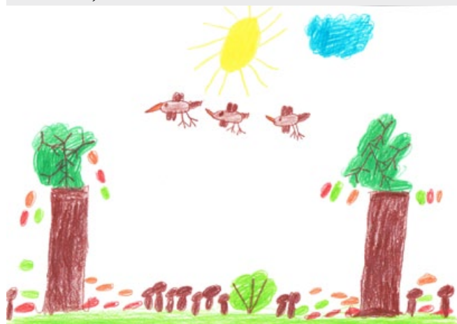
Gal Černivec, 3. a