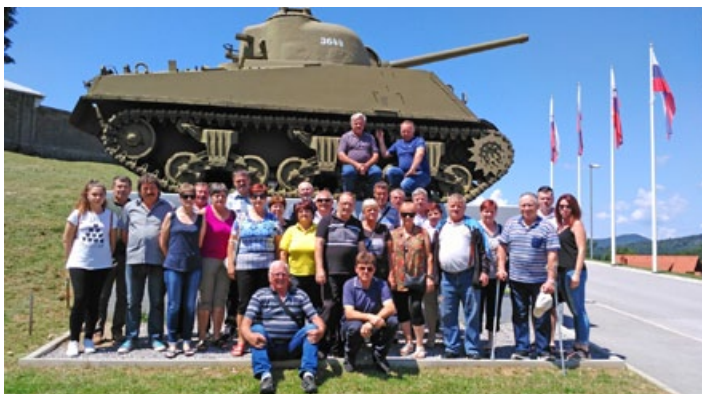
Ekskurzija cirkulanskih čebelarjev v Pivko in Ilirsko Bistrico.

Letošnjemu izobraževanju smo dodali ekskurzijo v Pivko in Ilirsko Bistrico. V Pivki smo si ogledali Muzej vojaške zgodovine, kjer smo predvsem moški obujali spomine na vojaški rok. V Ilirski Bistrici smo obiskali Čebelarsko društvo Ilirska Bistrica, kjer nas je pričakal gospodar in nam razkazal del mesta. V čebelarskem domu smo si ob razlagi o društvu ogledali Muzej čebelarstva – stalna razstava.