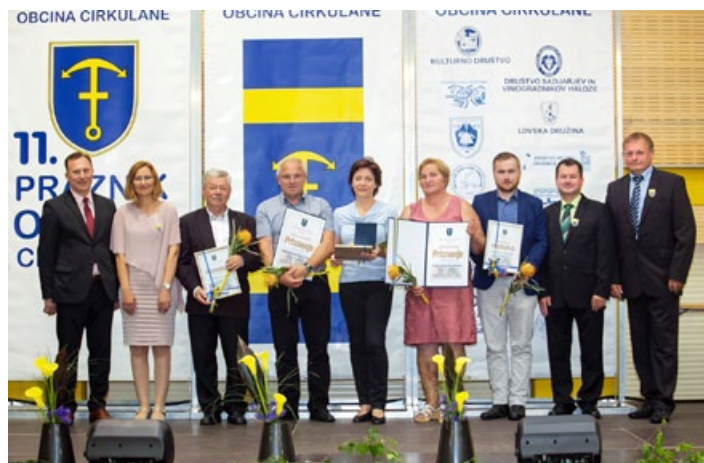
Letošnji nagrajenci občine Cirkulane ob 11. občinskem prazniku.