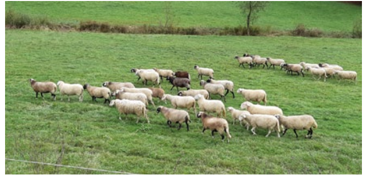
V Društvu rejcev drobnice Haloze so lahko zadovoljni, saj imajo dovolj članov in lepo število zdravih živali.

število članov. V zadnjem obdobju se nam je pridružilo nekaj zelo perspektivnih kmetij z območja Slovenskih goric, ki redijo tudi večje število živali. V večini gre za mlade prevzemnice kmetij, ki rejo vidijo kot dodatni vir prihodka na kmetiji in imajo tudi od 40, pa celo do 100 plemenskih živali na kmetiji.