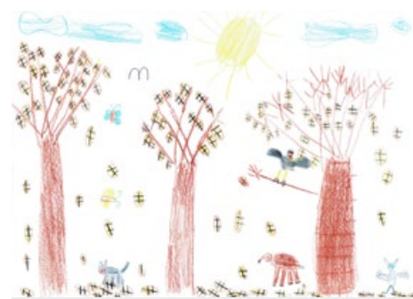
Žan Bratušek, 2. a