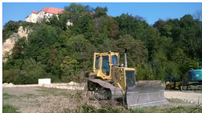
Pričetek sanacijskih del pri Borlu.