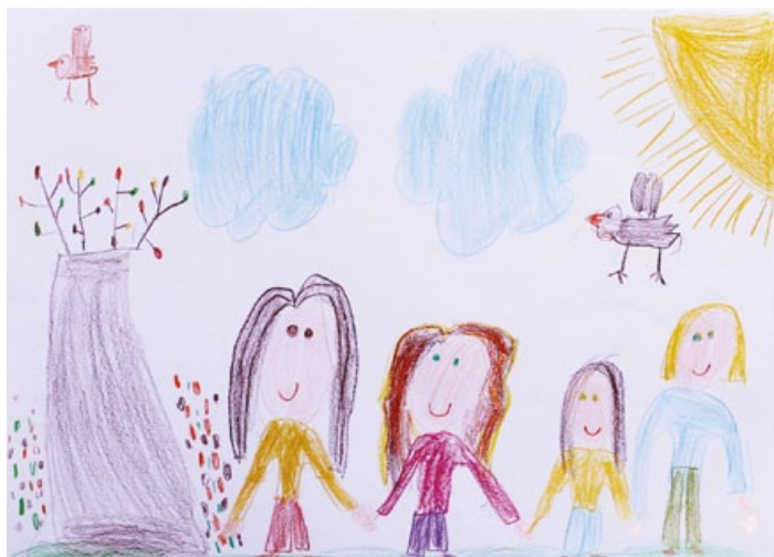
Ines Zamuda, 3. a