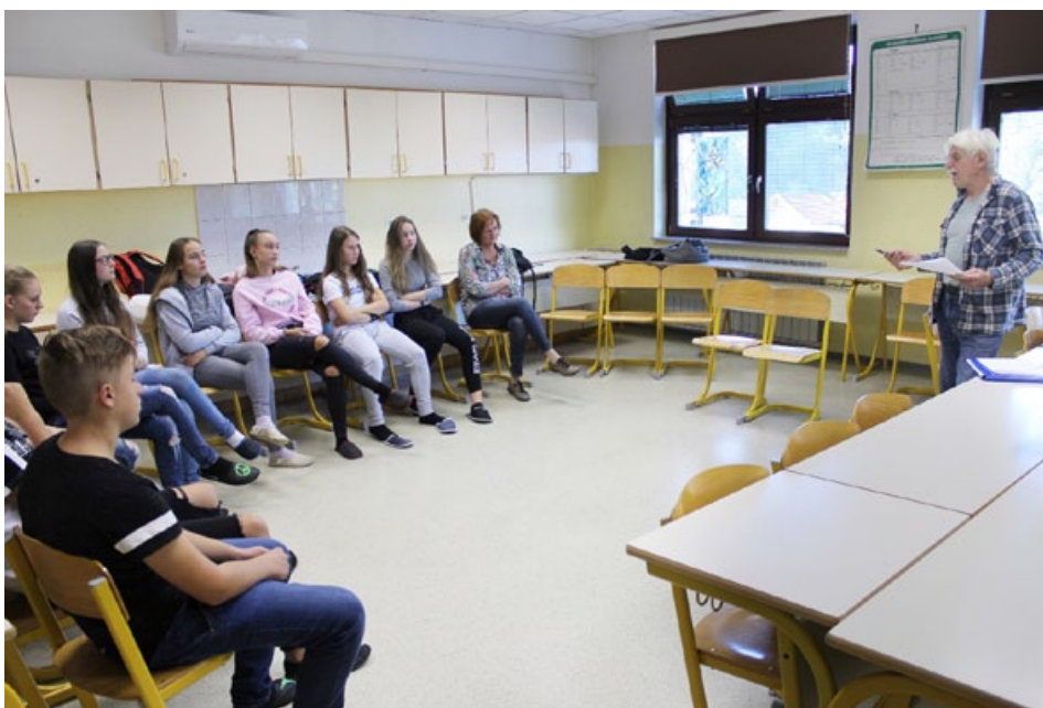
Ura ljudskega petja.