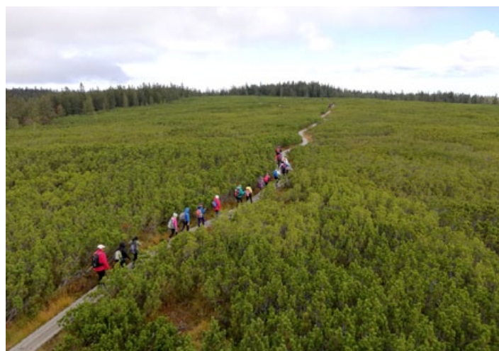
Po potki do Lovrenških jezer.

Nazaj smo se odpravili po »uri orientacije« v smeri Rogle.