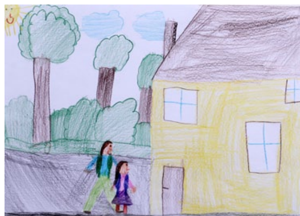
Teja Topolovec, 2. a