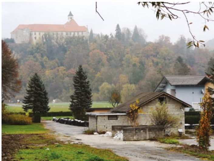
V Dolanah so s skupnimi močmi naredili 64 m dolg in 70 cm visok zid, v katerega so vgradili dobrih 16 ton mivke.