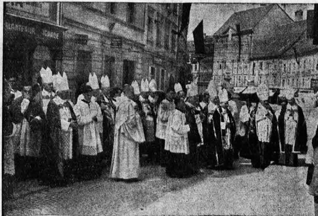
Nadškofje in škofje s papeškim nunejem pri pogrebu.

Sledila je nato močna godba gojencev z Rakovnika, zopet enajst zastav raznih verskih kongregacij, dalje lepa skupina mladih fantov kongreganistov v lepih belih srajah in z modrimi kravatami, tem pa so sledili ostali kongreganisti z Ljubljane in dežele. Posebno lepo skupino v tem delu sprevoda so tvorile dijakinje iz Zigorice s prekrasnim vencem in tremi zastavami, dalje dekletadijakinje s Poljan z lepim šopkom na čelu. V tej skupini so tudi nosili venec dekliške podzveze iz Celja, katerim je nato sledilo okrog 250 mladih deklet, društevni članice.