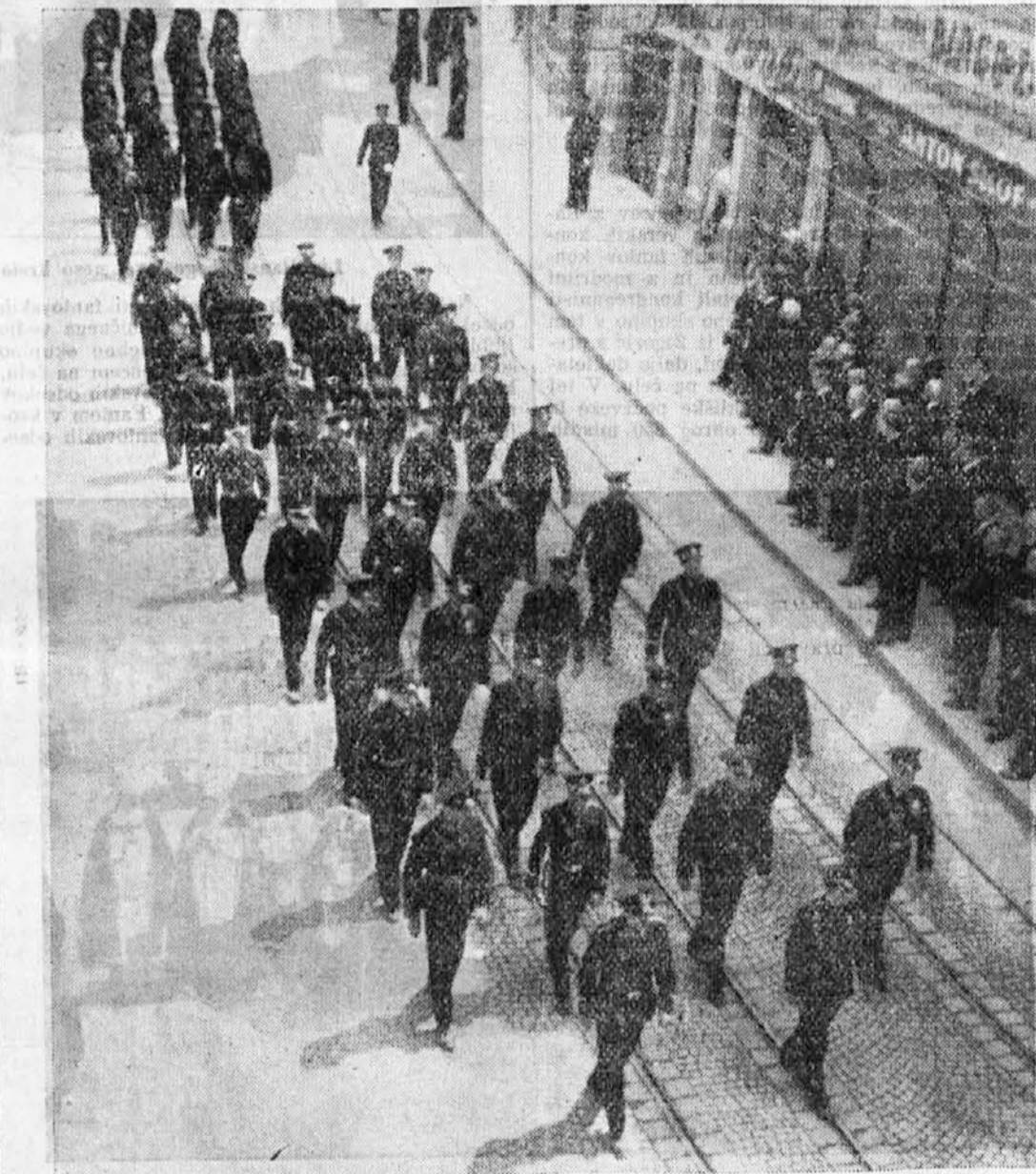
Gasilec v sprevodu

Mladini je ustvaril podlago za nadaljnji razvoj v slovenskem duhu in vodil svoje ljudstvo od stop-