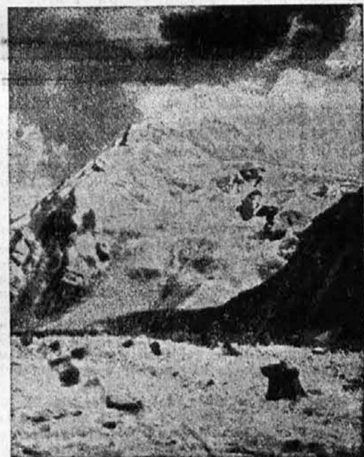
Nanga Parbat v Himalaji, druga najvišja gora na svetu, kjer je plaz zagnil v večini led letošnje nemško ekspedicijo