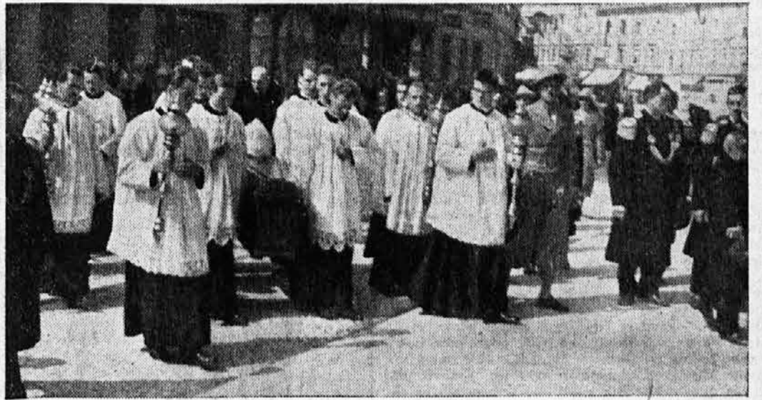
Ljubljanski bogoslovci neso krsto pokojnega vladike iz škofije v stolnico.

Pogreba svojega velikega prijatelja so se seveda s posebnim veseljem udeležili tudi naši fantje, ki so šele pred kratkim zopet mogli javno nastopiti v svojih novih fantovskih krojih. Na čelu te skupine so fantje nesli svoje v žalne trakove zavite zastave, tem je sledila železničarska godba »Sloga«, nato pa je korakalo predsedstvo zveze fantovskih odsekov.