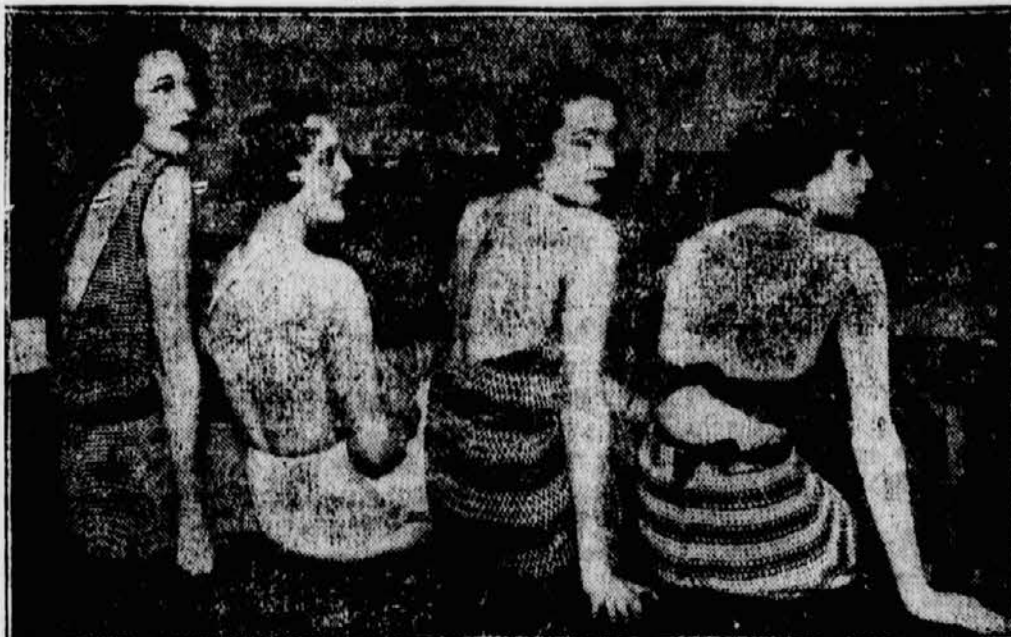
Die Modefirmen arbeiten schon für den Sommer und erfinden immer neue Modelle für Badeanzüge.