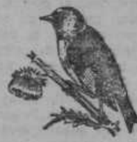
Štiglic: 18 let