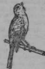
Kanarček: 15—20 let