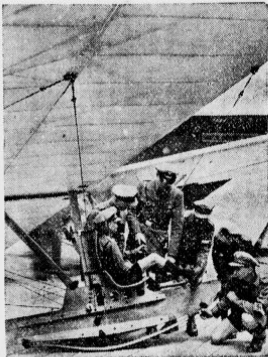
V Berlinu so odprli razstavo za vodna in zračna sportna letala. Prav posebno je veliko zanimanje za jadrna letala, katerih je tam veliko razstavljenih.

V nasprotju z Abesinci pa je italijanska poročevalska in dovozna služba vzorno delovala in ima brez dvoma velike zasluge za zmago. Uspehi Italijanov v tej smeri dokazujejo, da je italijanski generalni štab svojo nalogo dobro pripravil.