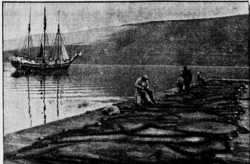
Na severni obali Islandije pri Akureju se ribiči pripravljajo na ribolov.

»Kako bom pa živel?« »Kako? Ali ste mar učenjak?« »Ne, pač pa brivec in lasuljar.«