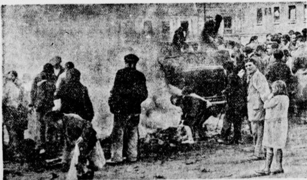
Komunistični nemiri v Španiji. V madridskem predmestju Puente de Vallecas so na cesti zažigali avtomobile.

»Ali je podjetje, v katerem je vaš sin, veliko?« »Bi rekel, da je. Celih 14 dni traja, preden pride dovtip od učenca do šefa.«