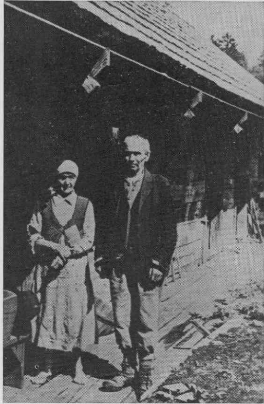
Neurejeno vprašanje lastništva je najbolj prizadelo upokojence