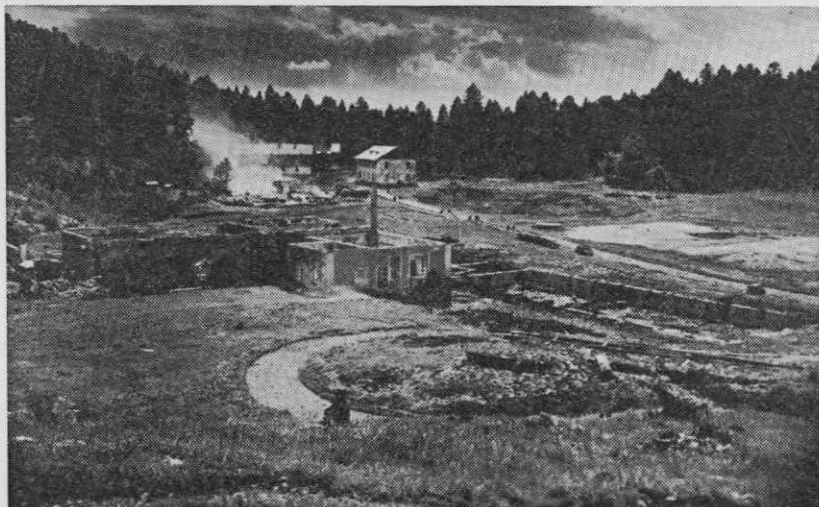
Zaga Rog aprila 1933. Dim nad ostanki stavb, ki so v ospredju prejšnje slike

Med njimi sta bili knežja in turjaška grofovska veja. 40 Vzrokov, zakaj ni tudi v teh treh primerih prišlo do sporazuma, je več. Glede knezov je verjetno eden izmed bistvenih momentov njihova tesna povezanost s politiko, ki je bila že desetletja nasprotna Slovencem. Pretežno so živeli izven slovenskega etničnega ozemlja, na svojih čeških in slo-