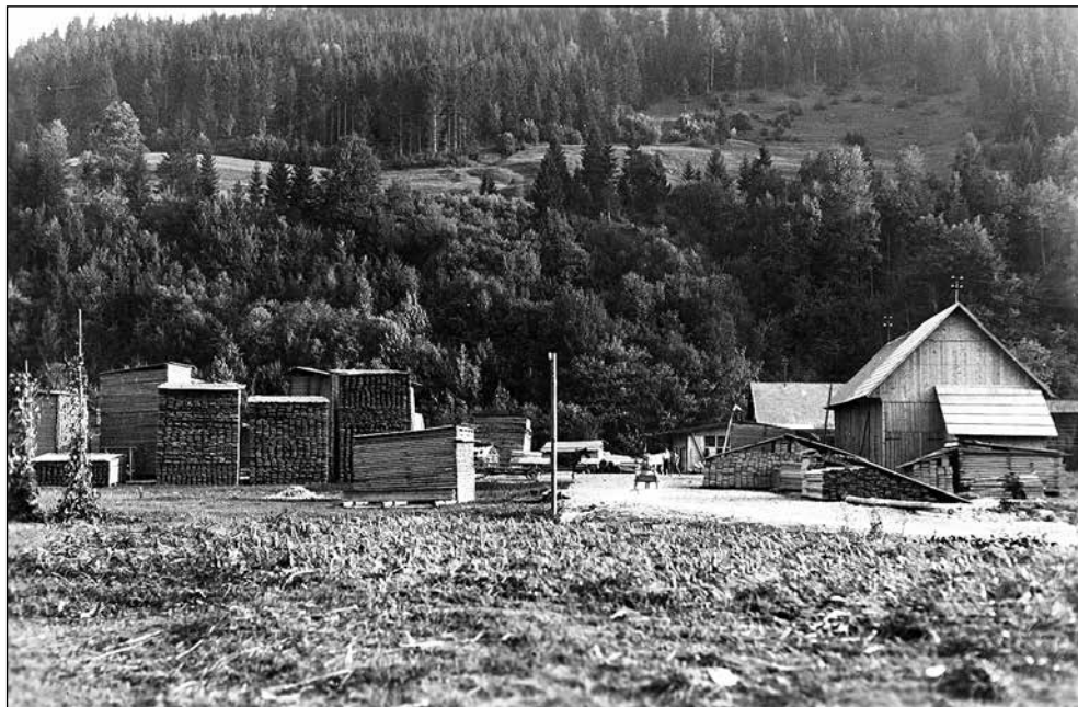
Na Centrali leta 1947.

29. 6. 1939 se je število članov povzpelo na 76. Dosegali so 20 din višjo ceno kot drugje, hkrati pa so zaslužili tudi s prevozom lesa z lastno vprežno živino. S poslovanjem so bili naslednji dve leti zelo zadovoljni, vendar so že pred vojno cene lesa padle. Vojna je, razumljivo, upočasnila razvoj, vendar se je