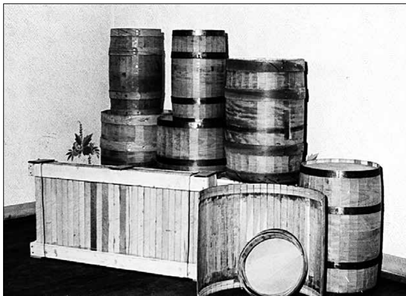
Nagrajeni zložljivi sodi, ki se žal niso uveljavili.