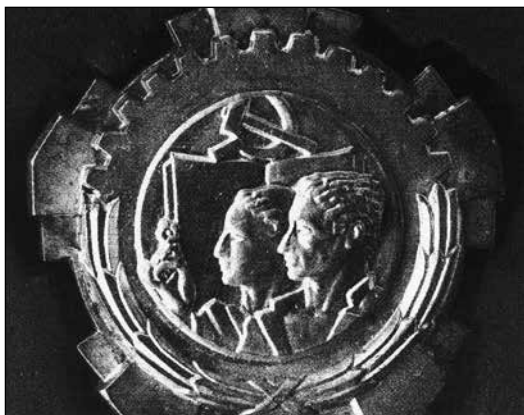
Priznanje človeku, ki je začel svojo poklicno pot z organizirano združeno prodajo hlodov in jo zaključil z industrijsko proizvodnjo lesnih izdelkov.