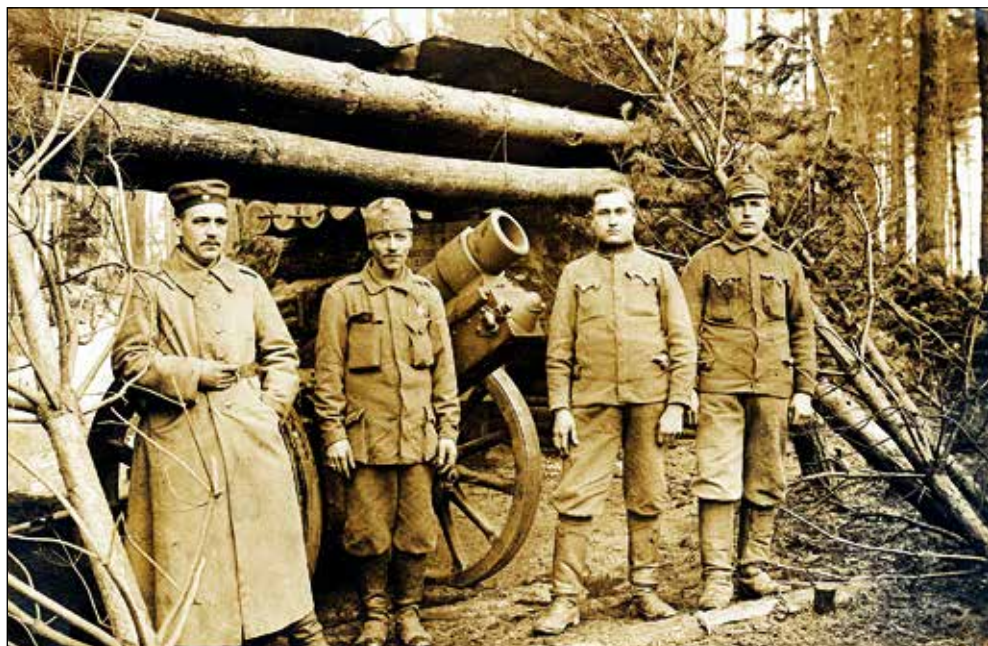
Kot avstro-ogrski vojak na fronti.