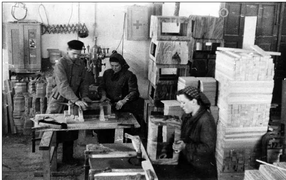
Zaboarna leta 1957, kjer so dobile delo pridne roke ne le moških, ampak tudi žensk. Ker je manjkalo delovne sile, so po vojni dekleta in žene dobile pozive, naj se zglasijo v tovarni.

Sodelovanje se je očitno obneslo. Poleg žage so zgradili še zaboarno, mizarso delavnico, sodarno, kotlovnico in sušilnico za les, mehanično delavnico, električno centralo, in prerasli okvire Zadruga. Delovali so na treh lokacijah: na Centrali, na prostoru sedanjega Alplesa, v Podzavrniku in na Kemperlovi žagi.