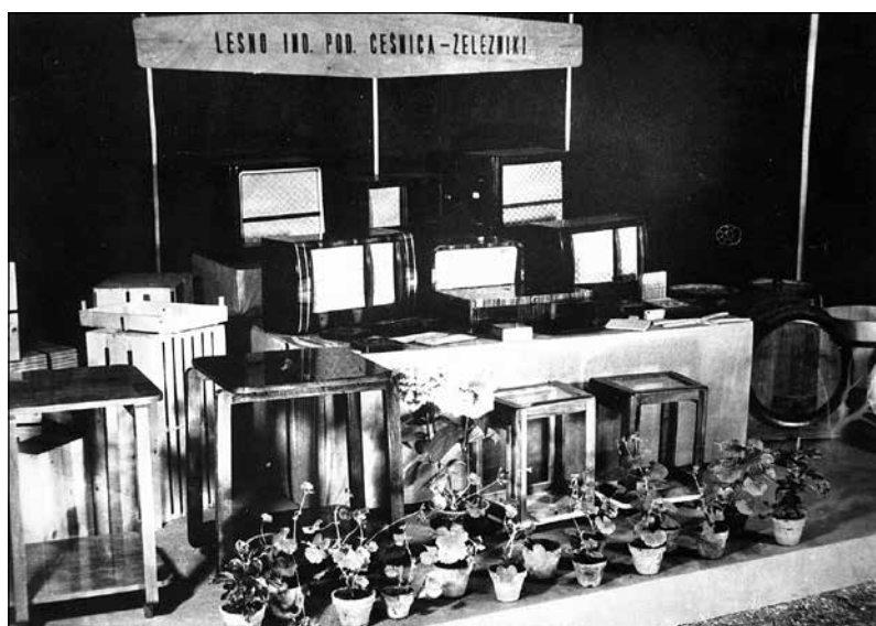
Sejemska stojnica podjetja LIP na enem izmed sejmov.