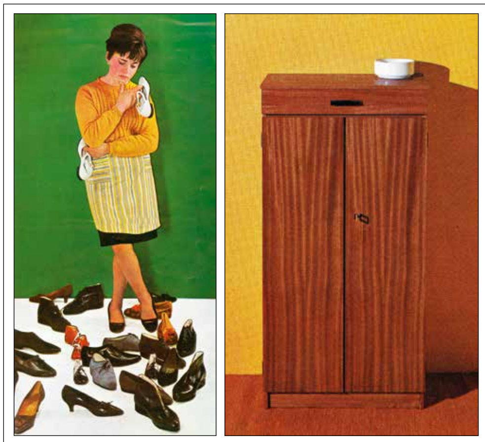
Reklama za omarico za čevlje LIP.