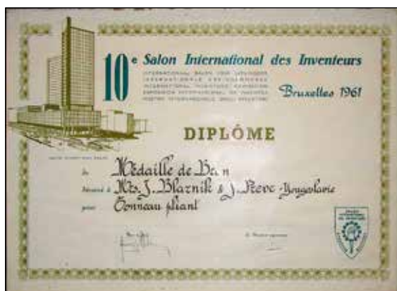
Bronasto priznanje iz Bruslja 1961 za zložljive sode.