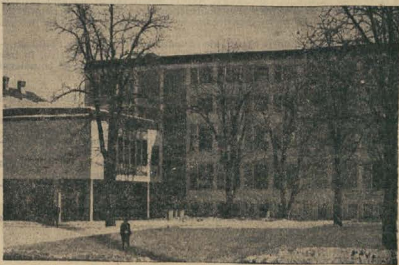
(Nadaljevanje z 2. strani)

Podrobne informacije o študiju na Visoki ekonomsko-komercialni šoli lahko dobite na šoli pismeno ali ustno ali pa na vseh sedežih enot za izredni študij.