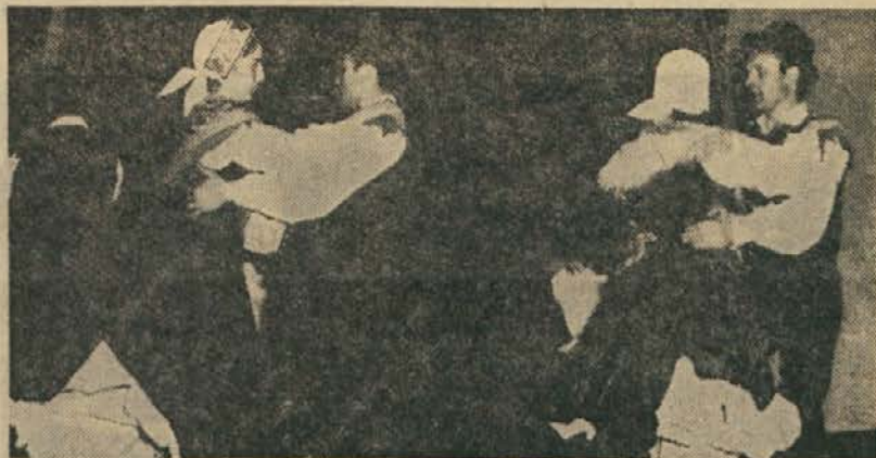
VKLJUČITE SE V VRSTE KUD ŠTUDENT!

Prostori uredništva so v novem študentskem domu, Ob parku 7.