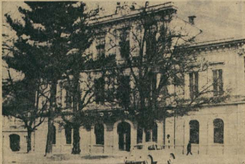
Slovensko narodno gledališče v Mariboru

Urniki predavanj so največkrat žal tako sestavljeni, da študentje niso z njimi najbolj zadovoljni, to pa predvsem zaradi tega, ker so predavanja dopoldne in popoldne v vmesnimi prekinitvami. Razlogi so v tem, da izredni