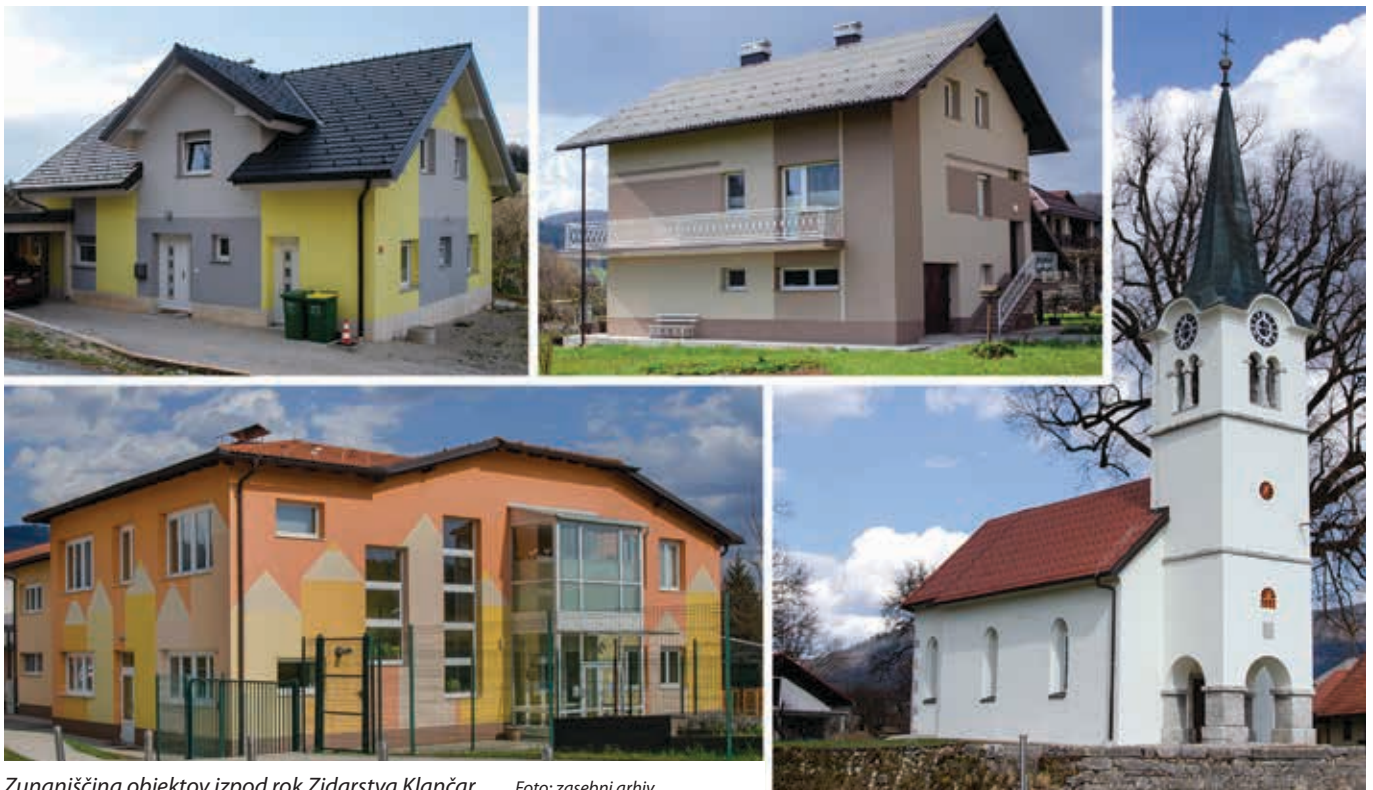
Zunanjščina objektov izpod rok Zidarstva Klančar