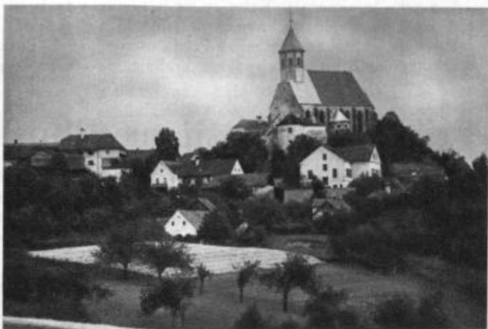
Ptujska gora z znamenito gotsko cerkvijo

»Ni mi všeč, da zvoniš. Zvesta sem svoji obljubi in ni treba, da me nanjo spominjaš. Ti je morda kdaj toča pobila ali povodenj grozila ali te kaka druga nesreča zadela?! Če se to tvoje zvonjenje ob hudem vremenu še kdaj ponovi, bodo strele razrušile tole zidovje v prah in pepel in stopile zvonove, da bo od vsega ostala le groblja, in toča bo stolkla v zemljo vso letino in vihar bo razdejal vaše domove.«