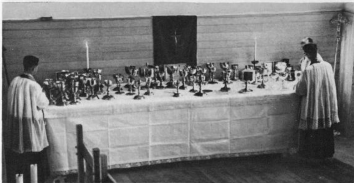
KKK: Toliko kelihov in ciborijev je bilo treba pri obhajanju mladine

Tretji dan po svetem Petru, ko je že ječmen dozorel in se je rž že belila in je pšenica že odcvetela, pa je popoldne nenadoma postalo temno: črni oblaki so zakrili sonce in prevlekli nebo; blisk na blisk je švigal iz njih in se cepil na sto koncev in več, tresk je tresku sledil in grmelo je, kot bi bil sodni dan. Ljudje so vsi prestrašeni pometali srpe in motike pa kose in drugo orodje v žito ter zbežali domov. Gospodinje so na ognjiščih zažigale žegnane leskove šibe, gospodarji so škropili okrog oglov z blagoslovljeno vodo, drugi so se zaprli v hiše, se preplašeni stiskali okrog peči in molili, da bi jih Bog obvaroval pred hudo uro in jim ohranil žito za kašče, in prosili tudi za vse tiste, ki ob tisti strašni uri niso našli zavetja, saj je bilo zunaj hudo, da bi človek še psa ne nagnal izpod strehe.