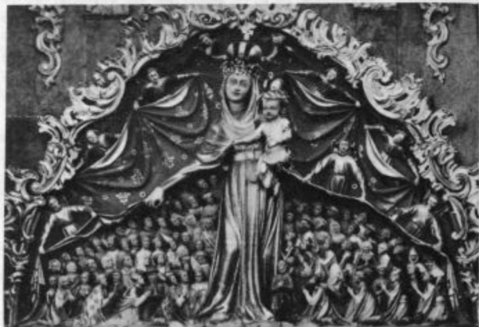
Čudodelna podoba Matere božje na Ptujski gori (Glej dopis str. 208)

In zato radi imejmo rožnovensko Kraljico in bodimo zvesti Mariji velesovski z Jezuškom tudi mi.