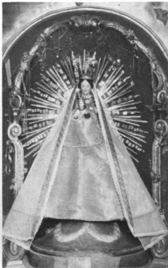
Milostna podoba Matere božje v Velesovem

Prva je tale: Največja in prva z a p o v e d božja za nas ljudi je, da m o r a m o verovati. Kristus je prišel na svet, kajne, da bi svet odrešil. Odrešil ga pa ni samo s svojo krvjo na križu, ampak tudi z resnicami, ki nas jih je učil in ki jih moramo sprejeti in verovati pod kaznijo večnega pogubljenja. Tole so njegove lastne besede: »Kdor ne bo veroval, bo pogubljen« — dobiš jih v evangeliju sv. Marka v 16. poglavju. In pri sv. krstu ti je položil Sv. Duh božjo čednost sv. vere v srce, zato da moreš s to vero sprejeti in verovati njegove razodete resnice. Če hoté in vedé vržeš vero iz svojega srca, če jo pred svetom zatajiš, je prav tako, kakor da si ugasnil sonce na nebu: ves si zavil v temo, mraz ti stiska srce in iz gluhih temin ti bobni na ušesa beseda