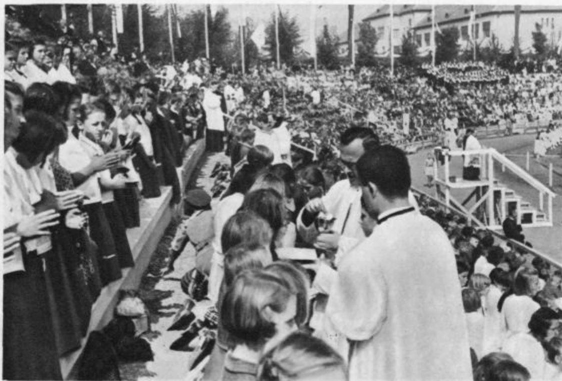
KKK: Med obhajilom mladine na Stadionu

V zvoniku je zazvonilo dan prav tisti hip. Prelepo je brnel zvon svoj jutranji pozdrav Mariji, tatu je ganilo v srce in po dolgem času je spet kot nekoč Gabriel v Nazaretu