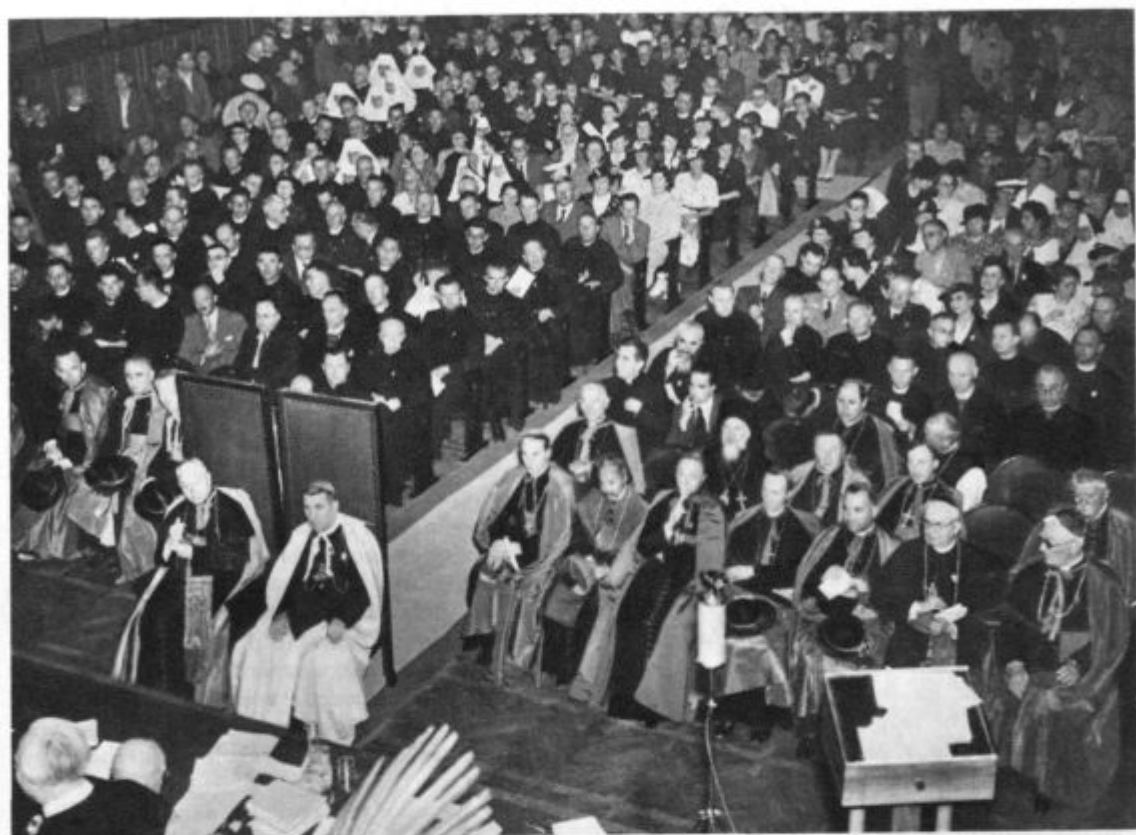
Prizor z zborovanja KKK v Unionski dvorani v Ljubljani — Spredaj kardinal Hlond (levo) in kardinal Piazza, patriarh beneški (desno) — V prvih vrstah nadškofje in škofje