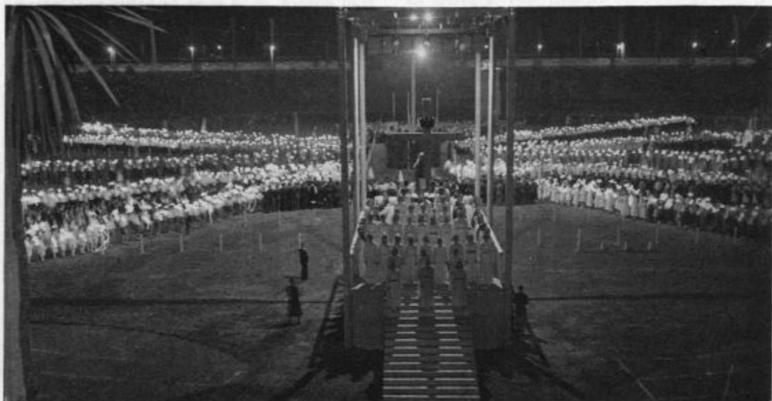
KKK: Med igro prihaja z vseh strani nova mladina z gorečimi baklicami. Nepopisen prizor!

Čimdalje bolj se je bliskalo, čimdalje huje je treskalo in tam daleč nekje je že vršalo in grozilo, da pride toča vsak čas in da uniči vse, da stolče v tla že skoraj zrelo rž in odcvetelo pšenico in vse žito, ki je tako lepo kazalo, in da oklesti sadje vsaj za pet let.