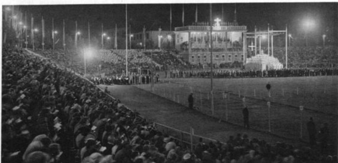
KKK: Igra o Kraljestvu božjem. Večerni prizor. Desno: Skupina angelov