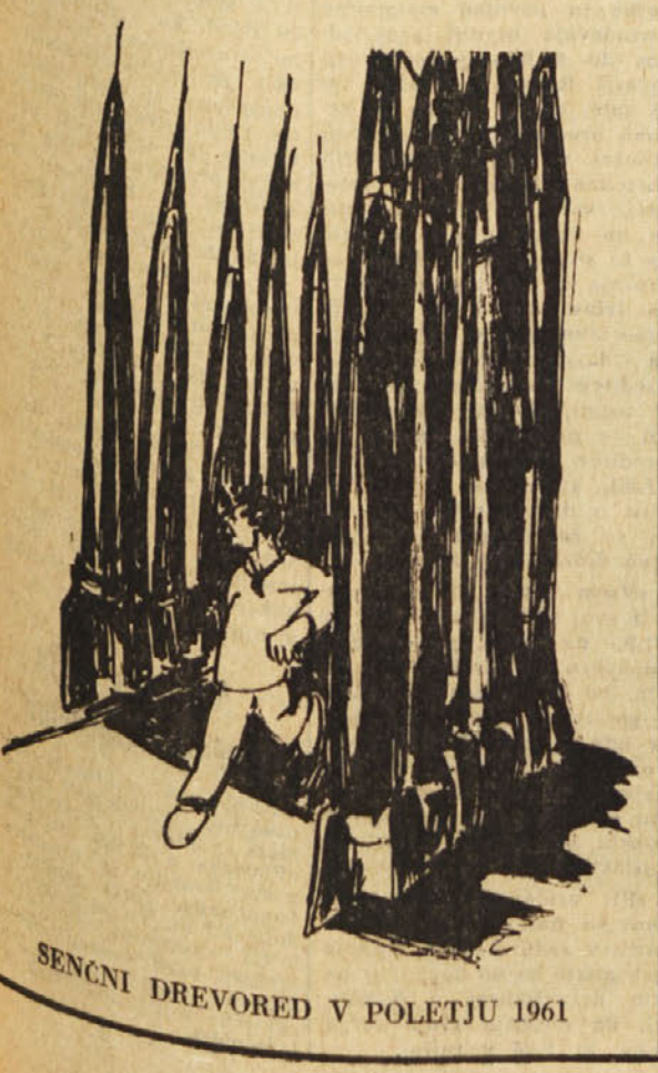
SENCNI DREVORED V POLETJU 1961