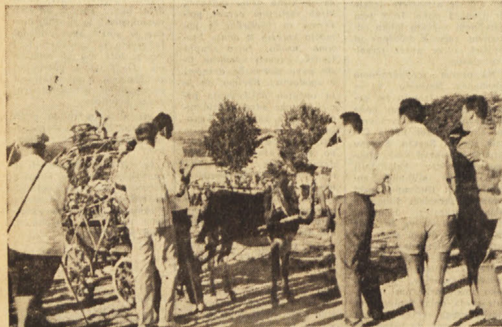
Oslica — zmagovalca pozira domačim in tujim fotografom