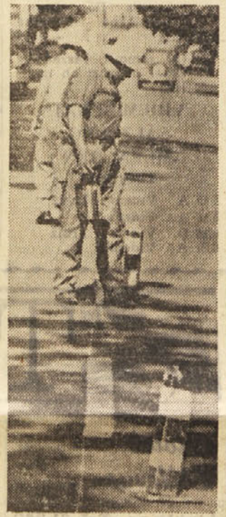
V turistični sezoni, ko je večji promet, je toliko bolj potrebno, da so prometni znaki dobro vidni. Pred dnevi je skupina delavcev zadrževala sredino Karza, da bi vozilki vedeli, kje so na levi strani, neha njihov ved. Točna označba sredine cestni je toliko bolj potrebna, ker je postal Korzo, dasiravno je zelo širok, preozek za sedanji promet, ker parkirajo na obeh straneh avtomobili, ki njegovo širino močno zožujejo.