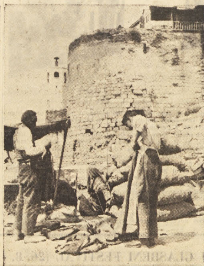
Prodajalci starega blaga pred trdnjavo v stari Ankari

Presenečeni ste, ko stopite v predverje, nato pa skozi ozka okrogla vrata v cerkev si treni ladjami in stebri. Kot pri resnični cerkvi je na koncu apsida, strop pa ima kupolo. Poleg tega najdete še vse druge elemente, ki so značilni za cerkev. Ponekod so