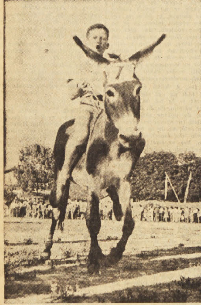
Najmlajši jezdec na najlepšem osličku

Se to. Poklicnih fotoreporterjev in amaterjev iz raznih držav, ki so slikali in filmali tekmo, je bilo več kot na marsikateri športni tekmi.