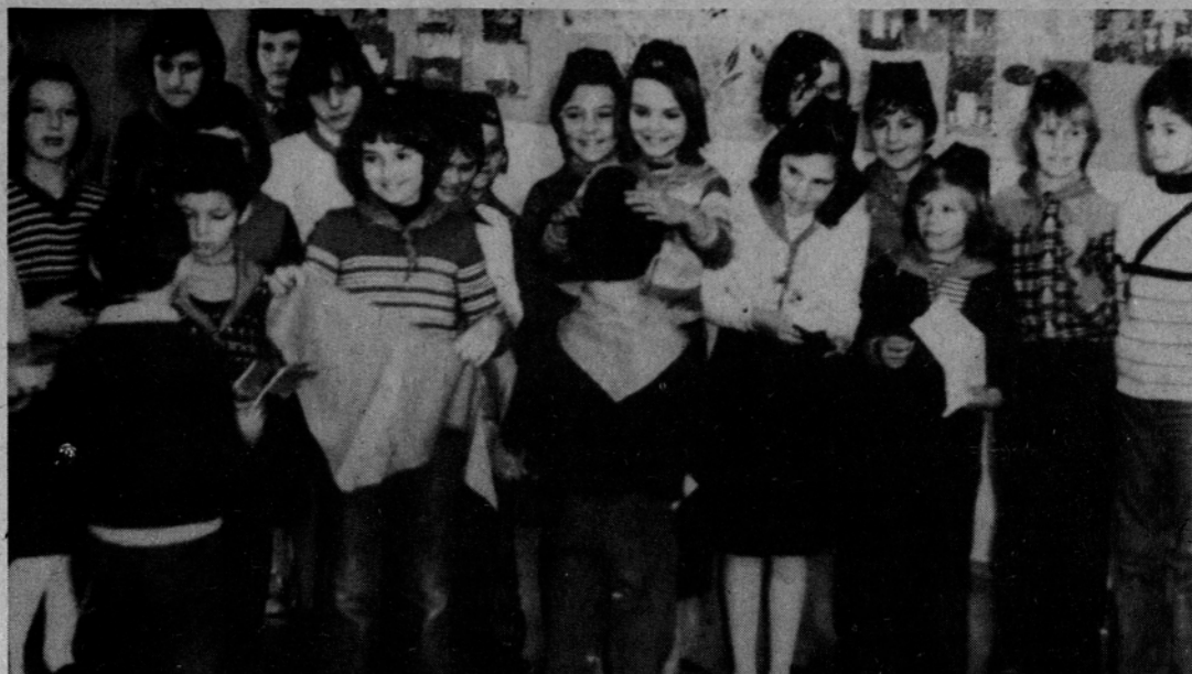
Razposajena nestrpnost pred svečanim trenutkom

Preden smo se poslovlili smo jo še vprašali kar nas je zanimalo. Rada nam je odgovorila. Eno izmed vprašanj je bilo, kako je sploh začela igrati harfo. Odgovorila nam je takole: „Ko sem bila stara približno šest let sem se vpisala h klavirju. Moja