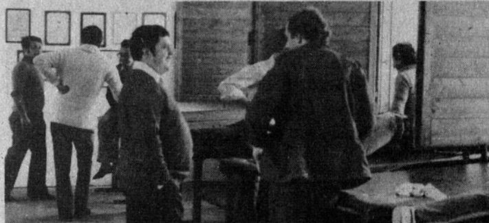
Razgovor med vadbo v prostorih strelišča

Celotno strelišče so z nabavo bencinskega agregata elektrificirali, kar je še posebej pomembno za dvoranjo za streljanje z zračno puško. V zgradbi so preuredili strelske linije za streljanje z malokalibrsko in vojaško puško, tako, da sedaj omogočajo vadbo in streljanje iz vseh treh položajev. Zgradbo so s te-