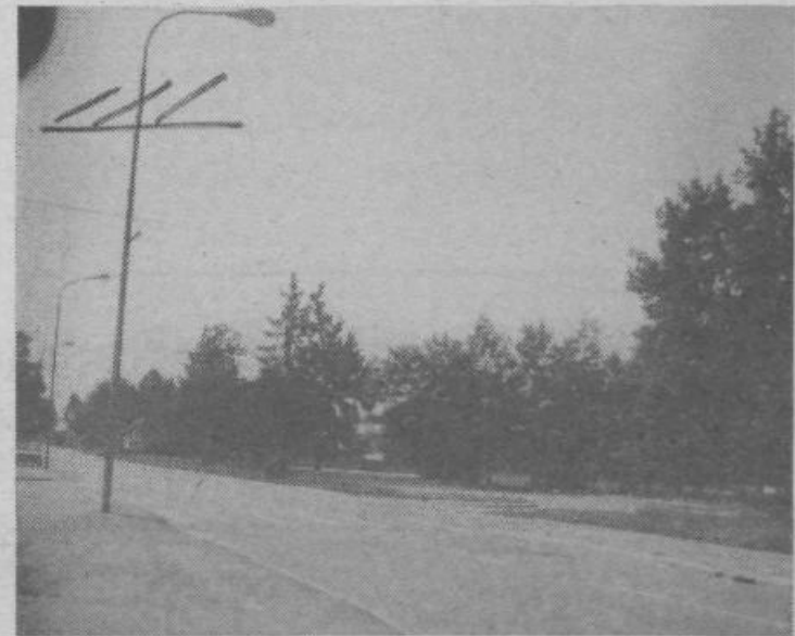
Križišče pred šolo v Polje—Zadobrova je za otroke zaradi neoznačenega cestišča izredno nevarno