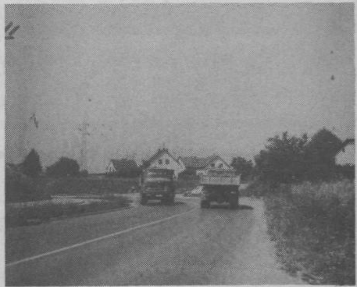
Takoj za ovinkom je podvoz v Zalogu. Cestni znaki pa postavljeni tako, da jih voznik zagleda, ko je skoro že v podvozu. Take označbe ne koristijo nikomur