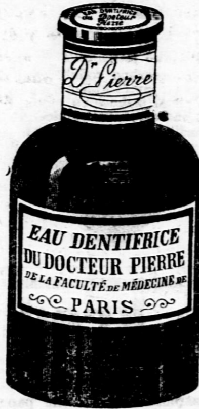
Svetovnoslavna ustna voda. Dobiva se povsod. (2105-45)