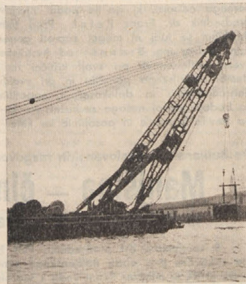
S sodobnimi napravami domače proizvodnje gradijo tovarno pristanišče v Koprju

Zaradi svojega geografskega prometnega položaja — severni Jadran velja kot posrednik med srednjo Evropo ter toplimi deželami Bližnjega, Srednjega in Daljnega vzhoda — se bo koprsko pristanišče v nadaljnji izgradnji specializiralo za južno sadje in lahko pokvarljivo blago na sploh. Tako specializacija ne zahteva le notranje tržišče, marveč jo še posebno narekuje stremenje po prireditvi tranzitnega prometa. Že dosedanji kontakti z inozemskimi interesenti — zlasti iz sosednih dežel, med katere spada tudi Avstrija — so dokazali, da obstajajo lepe možnosti za uspešni razvoj pristanišča v Koprju. Pristanišče se je namreč začelo uveljavljati tudi v inozemstvu in so že trenutno ustvarjeni pogoji za povečanje tranzitnega prometa. Tako postaja Koper vedno bolj potencialni posrednik prekomorske trgovine.