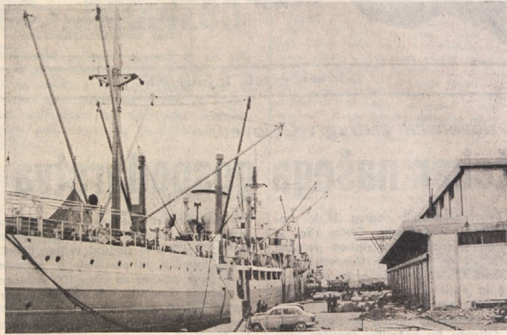
Ceprav je koprsko pristanišče še v izgradnji, igra že danes pomembno vlogo v mednarodnem pristaniškem prometu

se že uvršča v mednarodni pristaniški promet