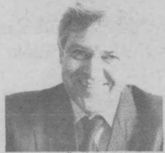
MILAN KUČAN, diplomirani pravnik, rojen 1941. leta.

Kandidat za predsednika predsedstva republike Slovenije