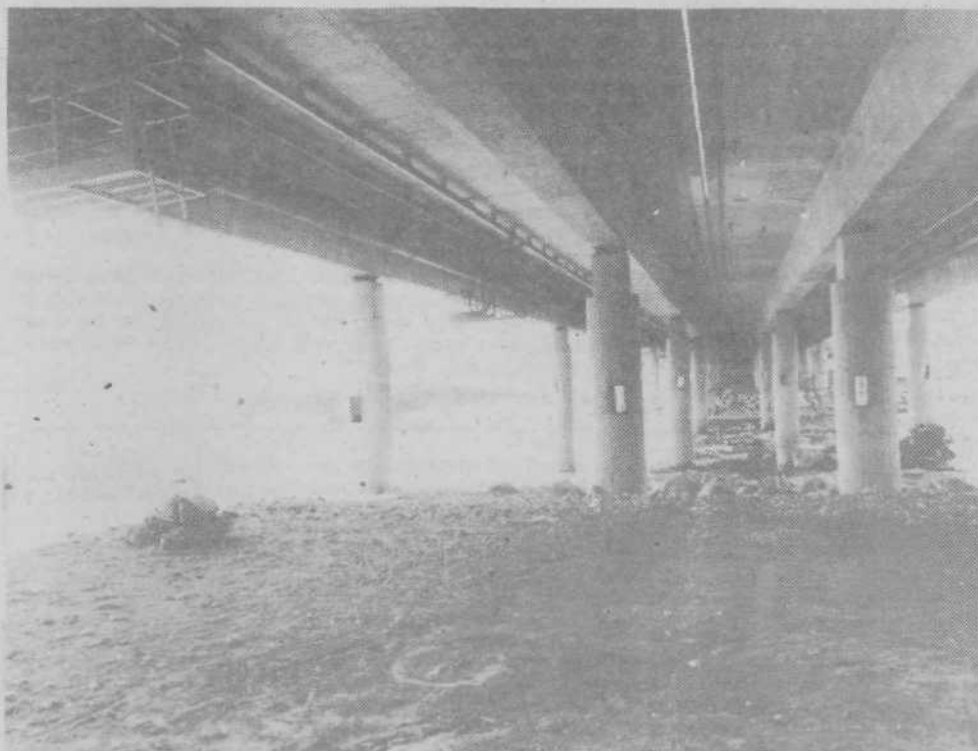
Magistralni vodovod Jarški brod-Titova cesta prečka Savo po novem mostu. Obešanje cevi na mostno konstrukcijo je bil najtežji del pri gradnji tega vodovoda.