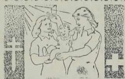
Prispevajte za Rdeči križ

Svoji delavcev naj prejmejo v tistem podjetju, kjer je zaposlen glavni družine. Dolžnost vsakega referenta je, da ta-ke nepravilnosti odklanja.