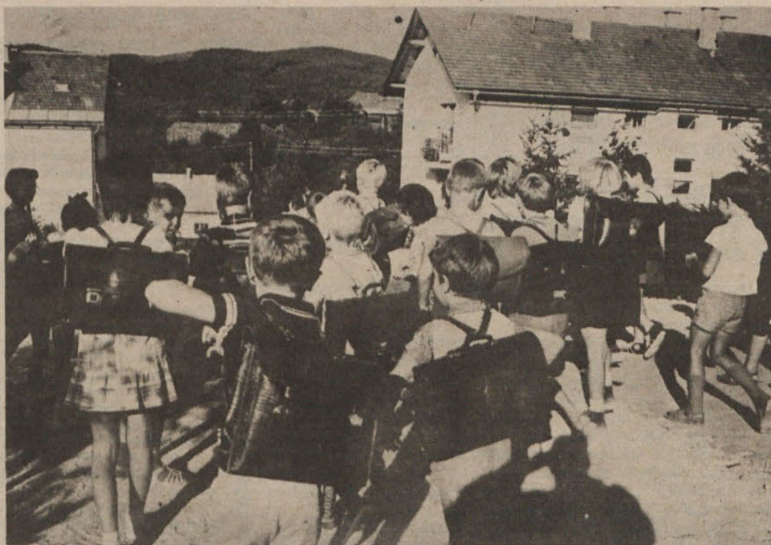
naši najmlajši so si spet oprtali šolske torbe, saj so se že odprla šolska vrata

se bodo morali voziti na celjske osnovne šole, da bi nemoteno opravili svoje učne dolžnosti itd.