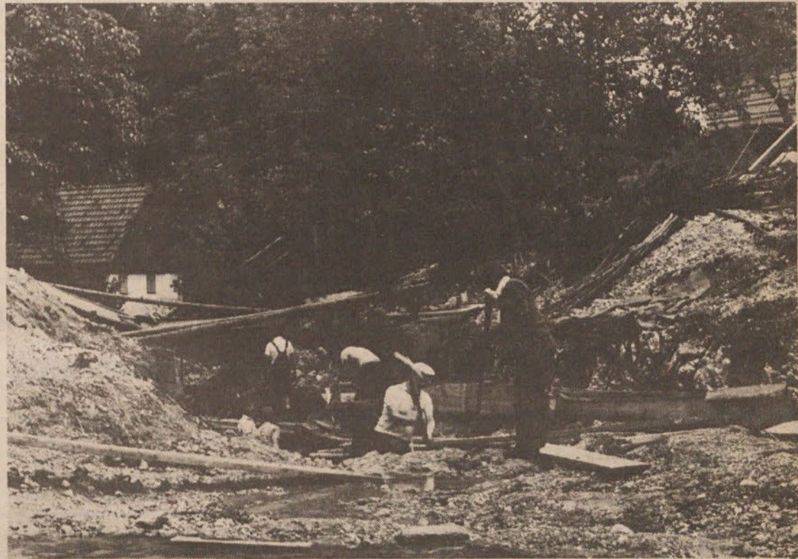
Občani so s prostovoljnim delom prispevali k hitrejši izgradnji nujno potrebnega vodovodnega omrežja