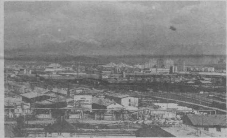
Obrati DO Izolirka — tozda Ljubljana in delovne skupnosti skupnih služb Ob železnici 18 (Fotoarhiv Izolirke)