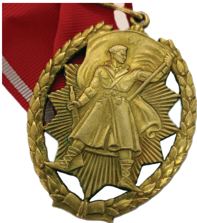
Red narodnega heroja Jugoslavije

cialnim realizmom, slovenskim narodnostnim vprašanjem ter socialno in družbeno tematiko.