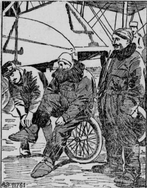
Letalci pred odhodom.