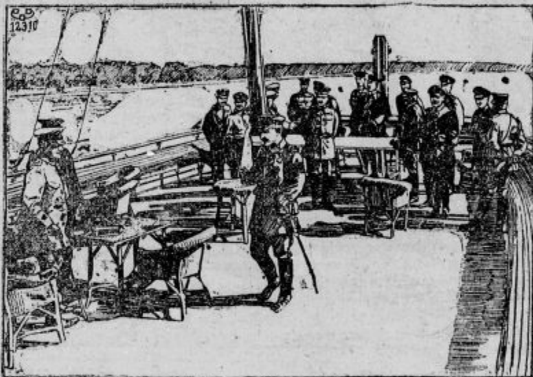
Cesar v Romuniji.

Rusija. Nobene gotovosti, vse v neredu. — Na demokratičnem posvetu se je sklenilo tole: Ruska demokracija ima trdno