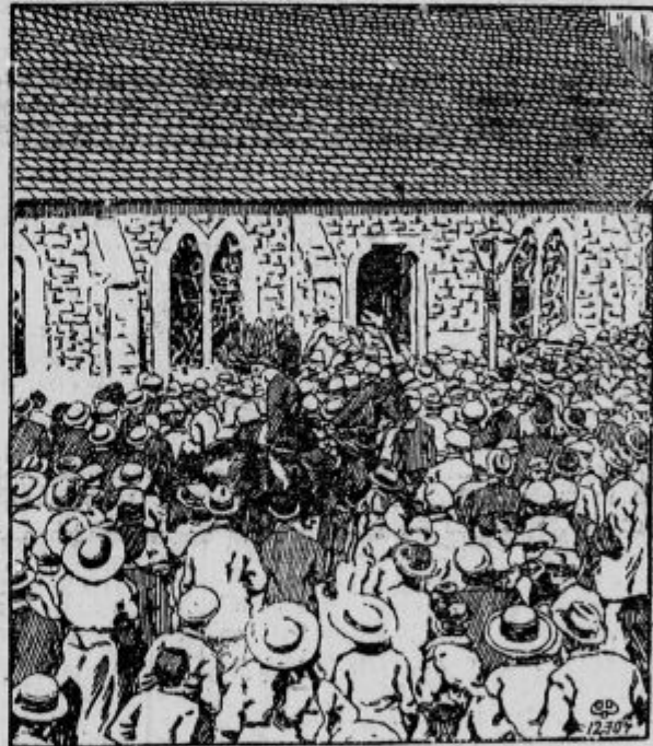
Kako se angleška vlada miru boji.

Luna: 16. oktobra ob 3. u. 41 m. zjutraj mlaj.