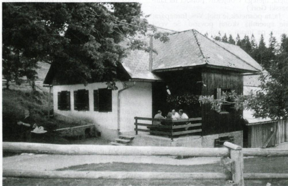
Urejena okolica koč.