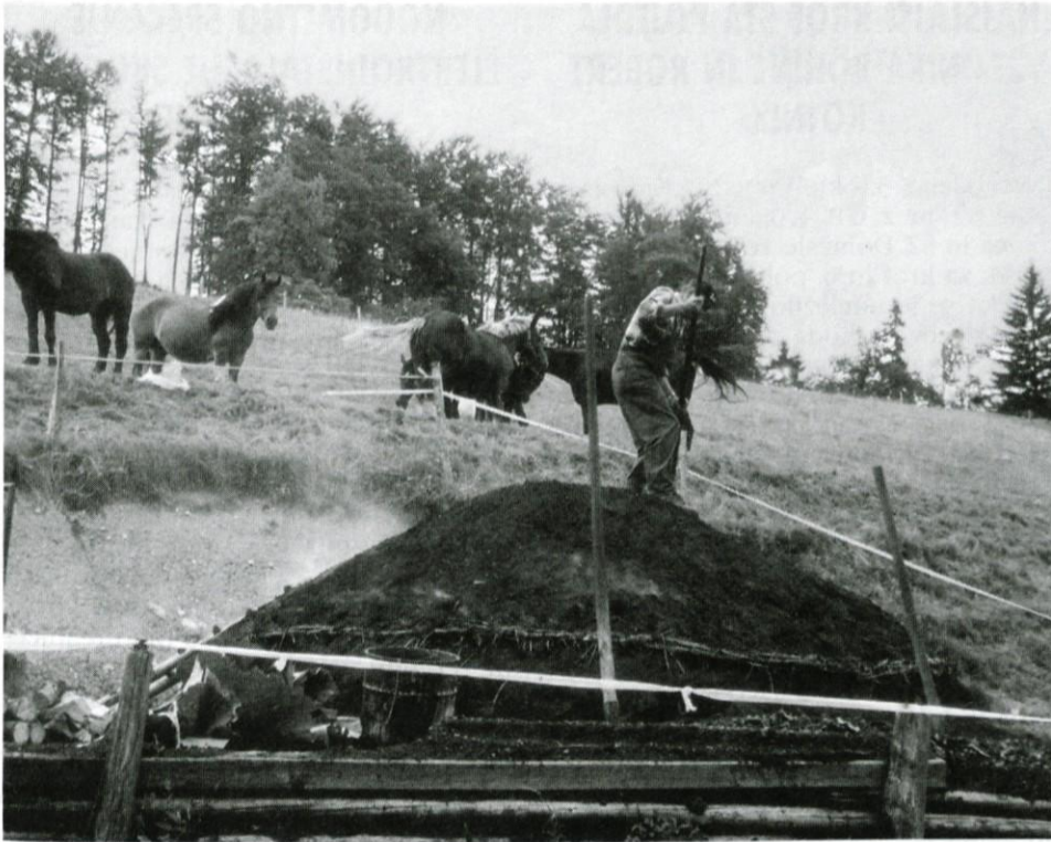
Na Lipovcu žgejo ogljje.