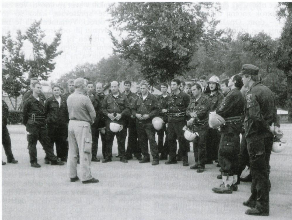
Udeleženci praktičnih vaj na Igu