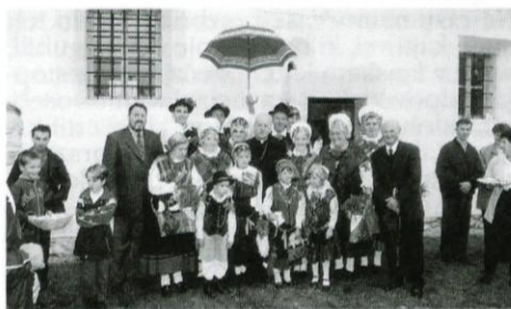
Slovesnost so zelo popestrile narodne noše, ki se rade odzovejo povabilom.