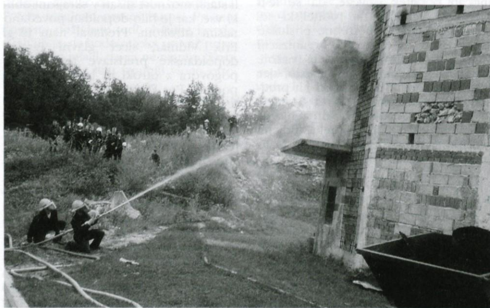
Taktična vaja gašenja