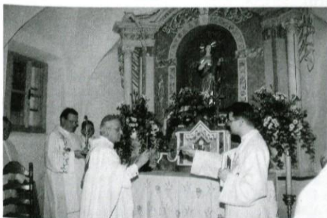
Blagoslovu vseh obnovitvenih del je sledil tudi blagoslov obnovljenega kipa Sv. Neže in tabernaklja.

Sveto mašo je vodil ljubljanski nadškof in metropolit dr. Rode, somaševali pa so tudi številni duhovniki iz okoliških krajev. V svoji pridigi je nadškof pozval vernike k bolj aktivnemu sodelovanju v župnijskih skupnostih in h krepitvi vere. Poudaril je, da mora biti naš odnos do Boga iskren in da moramo živeti tako, da bomo ostalim za zgled. Na koncu je Sloveniji napovedal svetlo prihodnost, ki naj bi bila po njegovem mnenju odvisna predvsem od posameznikovega sodelovanja in odnosa do družbe in države.