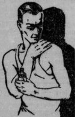
SLOAN-ov Liniment odstranja bolečine

d Kmetijska šola na Grmu je zaključila letno šolo 1928/29 dne 31. oktobra t. l. Slovesnosti se je udeležil g. komisar ljublj. oblastne samouprave dr. M. Natlačen, ki je pred razdelitvijo izpričeval nagovoril učence, podajajoč jim na pot nekaj lepih misli. Priporočal jim je, naj bodo ukaželjni, pri-dni in delavni, varčni in naj bo vse njih-