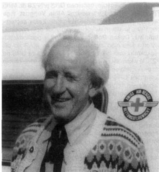
Ludwig-Wiggerl Gramminger, desetletja stober nemške Bergwacht, začetnik IKAR, plemenita duša, iznajditelj reševalnih pripomočkov