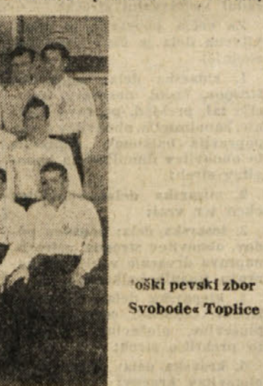
Moški pevski zbor Svobode« Toplice

kor smo že omenili — povečalo od 180 na 320 članov, kjer je najvažnejše to, da se je njegovo članstvo povežalo v enoten,