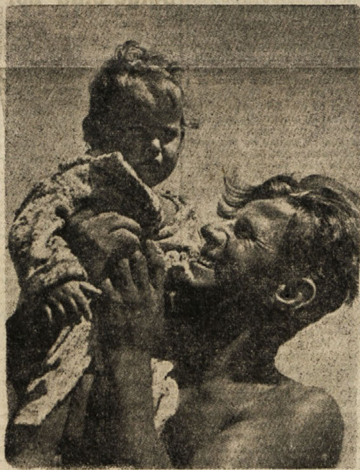
Po vsem okraju Trbovlje se vršijo od 31. maja do 7. junija prireditve v okviru »Tedna matere in otroka«. O podrobnostih bomo poročali.

veljavni teh cerkvenih zakonov cerkveni poglavarji te države, v kolikor nimajo prejšnje odobritve in potrebna pooblastila apostolske stolice, na noben način ne morejo nekaj objubiti ali kar koli potrditi, niti ustno niti zamisliti niti predloga kakršnega koli sporazuma, za katerega bi šlo. Kar ni v skladu z normami, o katerih smo govorili, je v največji meri škodljivo za dobro cerkve in duš.