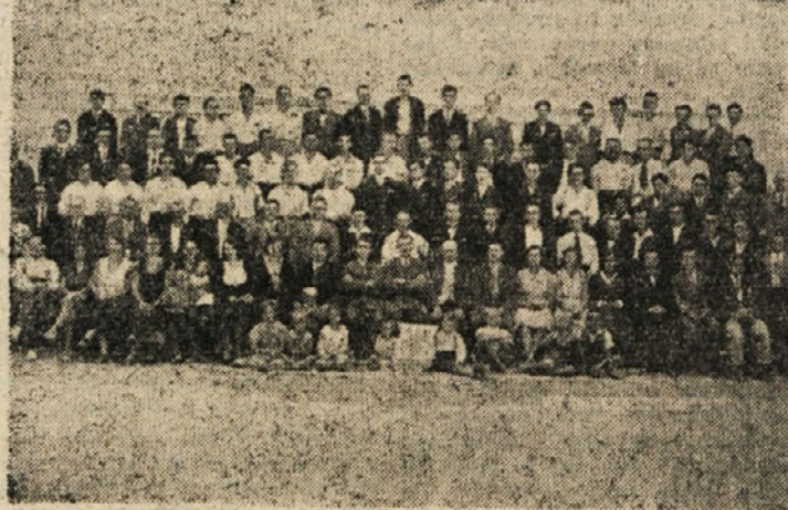
Društvo »Svoboda«, slikano pred Delavskim domom na Lokah leta 1932

stranke, sindikata in mladine. Ta konferenca je bila pri Ravnikarju na Ciglanci. Na konferenci so sklepali o bodočem ilegalnem delovanju. Po nekaj dneh so imeli drugo konferenco