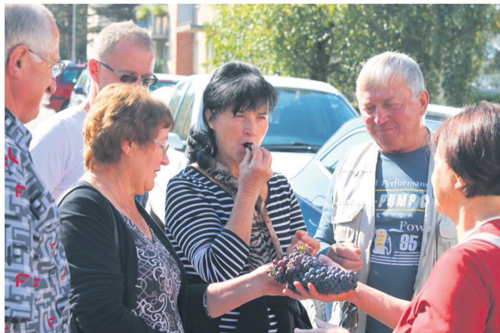
Pokušina grozdja, ki je povezano z najstarejšo trto na svetu, ni ravno vsak dan. Obiskovalci prireditve Vinska trgatve to dobro vedo.