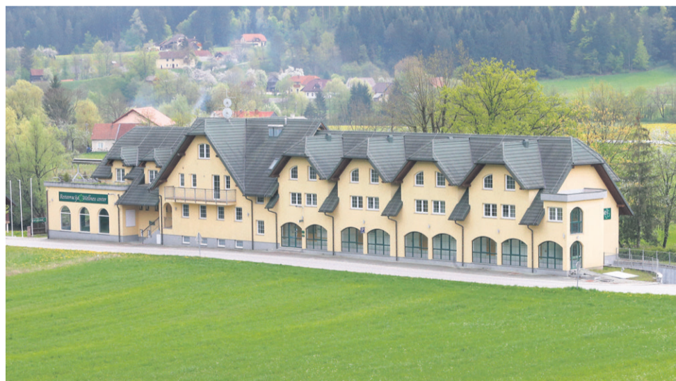
Čeprav so vsa oprema aparthotela Natura že pred časom pobrali upniki, so v stavbo vlomili že dvakrat. Prvič so vlomilci hoteli odnesti radiatorje, a so jim namero še pravi čas preprečili. Drugi vlom se je zgodil v začetku tega tedna, a ker je stečajna upraviteljica poskrbela za alarmne naprave, so bili vlomilci tudi tokrat neuspešni.