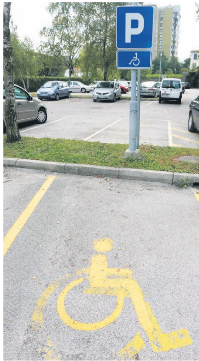
Četudi v Medobčinskem društvu delovnih invalidov Celje pravijo, da v Celju ni več veliko težav zaradi neupravičene zasedenosti parkirnih mest, pritožbe prihajajo predvsem iz nekaterih stanovanjskih sosesk. Predvsem z Otoka, s Hudinje in z Lave, kjer naj ne bi bilo zarisanih dovolj parkirnih mest.

Zato ker v Sloveniji v popolnoma nobenem zakonu, odločbi, pravilniku ali kakršnekoli drugem predpisu ne piše, da mora nekdo parkirno karto, na primer po smrti invalida, vrniti. Ravno zaradi tega se v praksi vsakodnevno dogajajo kršitve. Svojci pokojnih invalidov tako parkirno karto še naprej uporabljajo za parkiranje na parkirnih mestih za invalide.