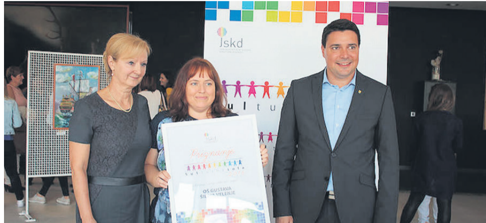
Naziv naj kulturne šole 2016 med srednje velikimi šolami so prejeli učenci in mentorji Osnovne šole Gustava Šiliha.

Najbolj kulturna šola leta 2016 je po mnenju strokovne komisije Osnovna šola Luisa Adamiča Grosuplje. Med srednje velikimi šolami si je v tem letu laskavi naziv prislužila Osnovna šola Gustava Šiliha Velenje. Kot je povedala koor-