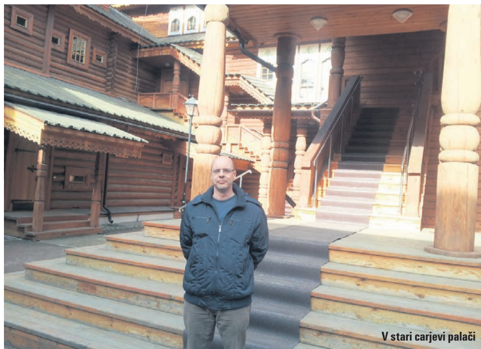
V stari carjevi palači