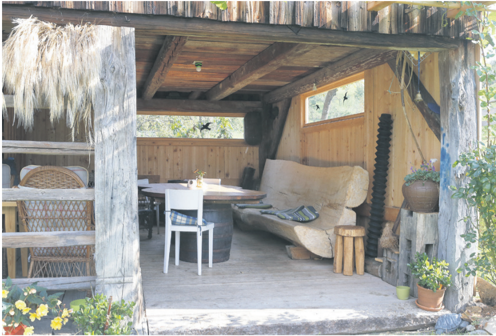
Ópazna klop iz lipovega debela