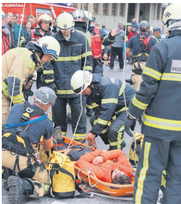
Kljub težavam, na katere opozarjajo gasilci, je očitno, da gasilstvo postaja poslanstvo, ki je z leti vendarle vedno bolj cenjeno, kar se kaže tudi tako, da se zanj odloča vedno več mladih.

Druga večna težava je ureditev statusa prostovoljnega gasilca, pri čemer gre predvsem za težave, ki se poja-