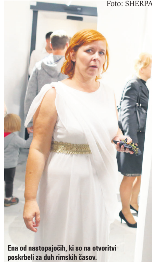
Ena od nastopajočih, ki so na otvoritvi poskrbeli za duh rimskih časov.