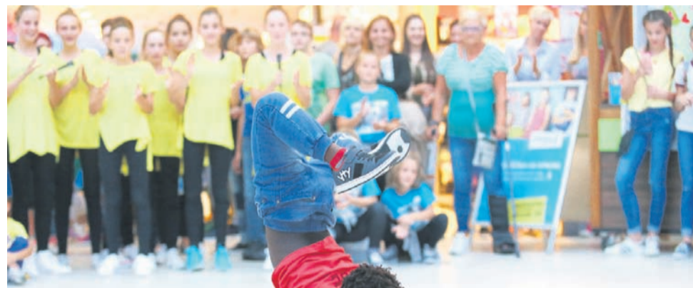
Na Festivalu občolskih dejavnosti se je predstavila tudi Plesna šola Superstar.