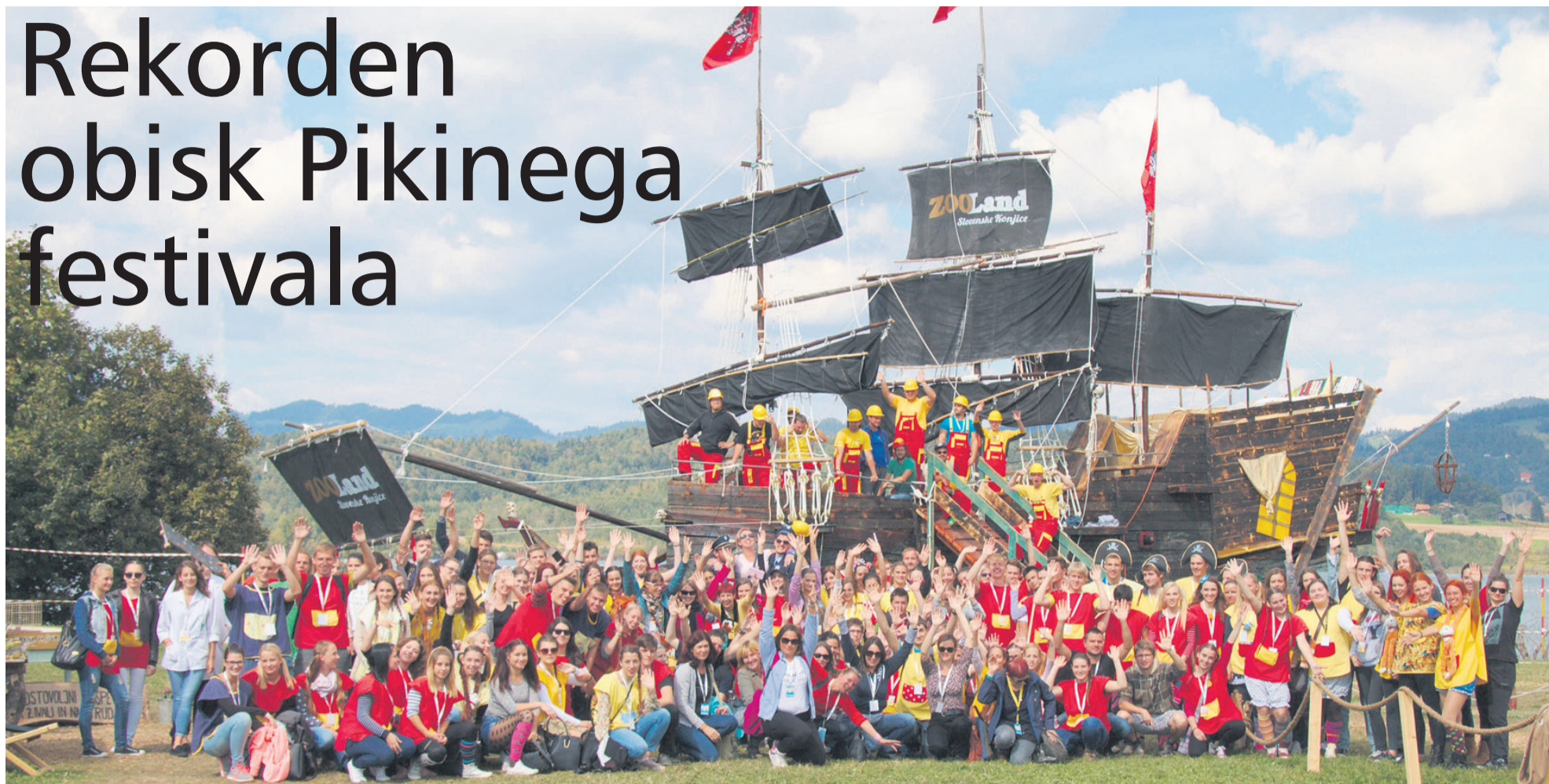
Za izvedbo festivala je tudi letos skrbelo več kot 350 ljudi, ožja organizacijska ekipa pa je štela več kot 30 članov.

V soboto se je končal 27. Pikin festival, ki je letos nosil slogan Sam svoj mojster. V sedmih razigranih dneh so mladi in stari ustvarjali ter raziskovali na več kot stotih kreativnih delavnicah, uživali v sedemdesetih gledaliških, lutkovnih, plesnih in glasbenih predstavah, sedmih mojstrskih umetniških četrtih in na tematskih razstavah, športnih in pustolovskih dogodkih ter v ostalem bogatem zabavnem in izobraževalnem dogajanju na prostem.