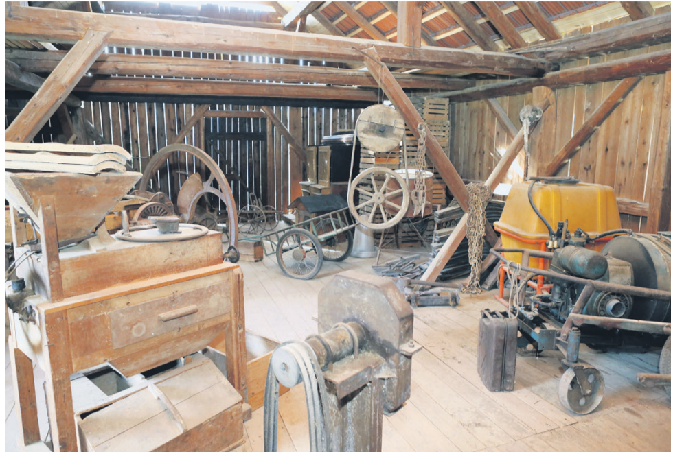
Kmetija je bila nekoč samooskrbna. Na kozolcu je razstavljeno vse, kar je kmetija potrebovala, da je preživela.