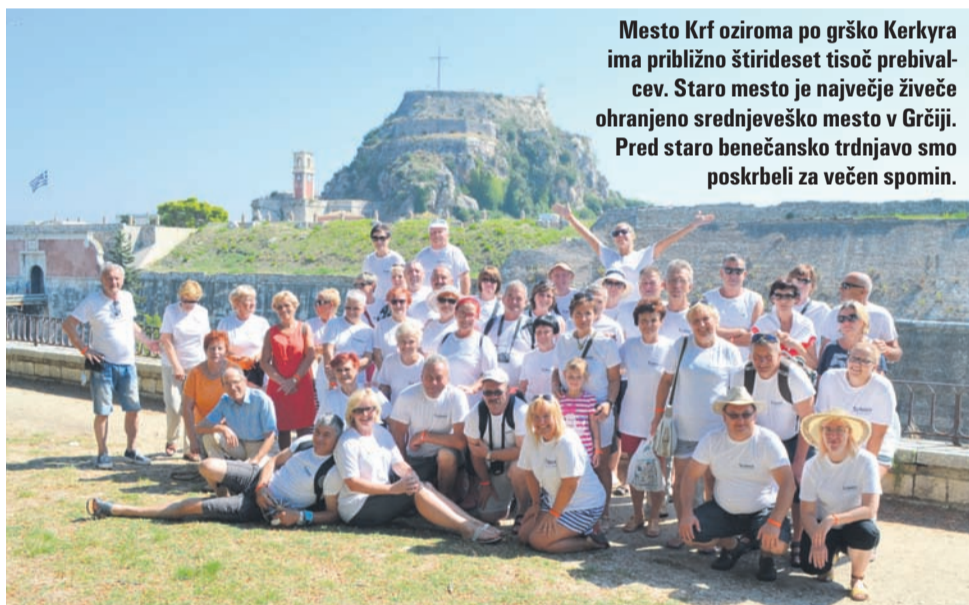
Mesto Krf oziroma po grško Kerkyra ima približno štirideset tisoč prebivalcev. Staro mesto je največje živeče ohranjeno srednjeveško mesto v Grčiji. Pred staro benečansko trdnjavo smo poskrbeli za večni spomin.

Več fotografij na www.nt-rc.si in na facebook Novi tednik in Radio Celje