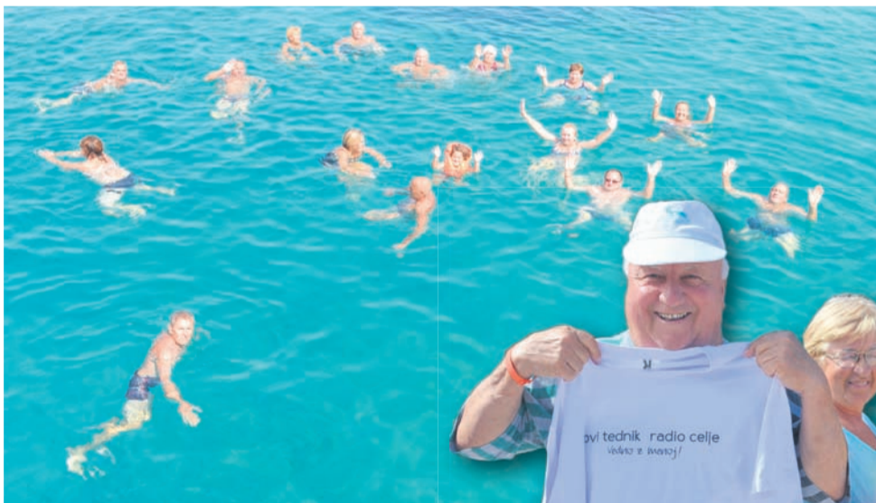
Z ladjico smo se zapeljali do zaliva Modra laguna, kjer smo uživali v kristalno čistemu morju.