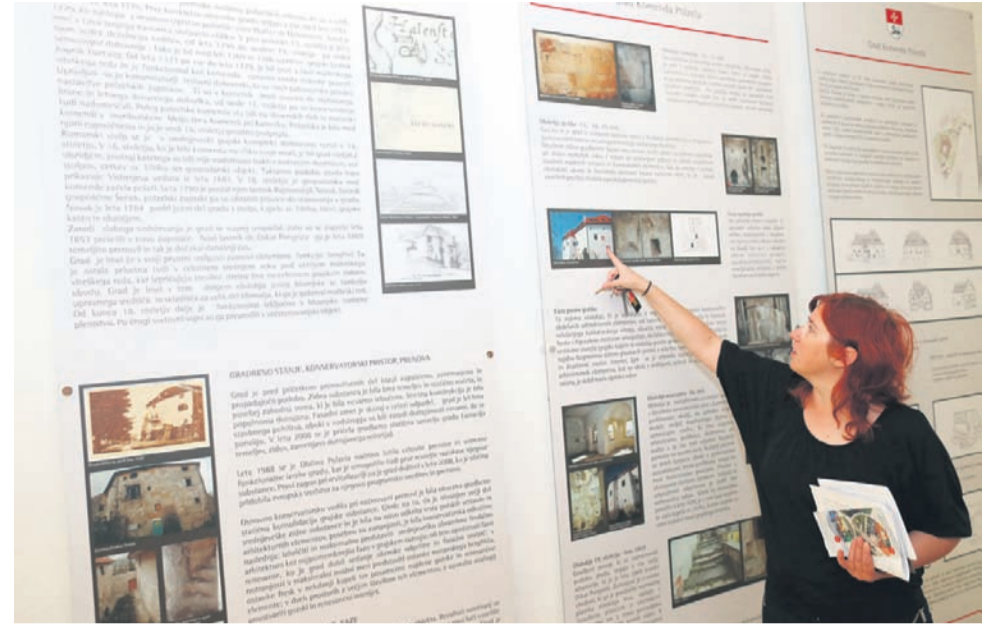
V grajski galeriji sta predstavljeni zgodovina gradu in pot njegove obnove. Grad si je mogoče ogledati pod vodstvom grajskih vodnikov.