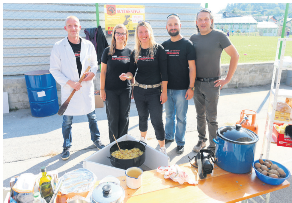
S tekmovanja v praženju krompirja. Med sedmimi ekipa je bila tudi ena iz kinološkega društva.