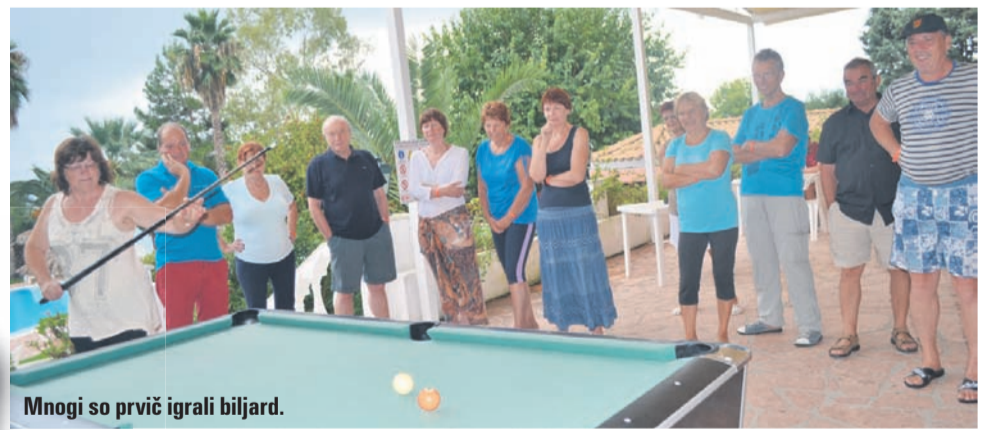
Mnogi so prvič igrali biljard.

Krf zaradi smaragdne barve zelenja velja kot eden lepših grških otokov. Vsekakor je najbolj zelen grški otok. Pravijo tudi, da je najsrečnejši. Bil je zadnja postaja znamenitega Odiseja, ko se je vračal na rodno Itako. Je na svetovni lestvici med najbolj obiskanimi grškimi otoki in odet v zelenje cipres, oljk ter druge vegetacije privabi veliko turistov z različnimi okusi. Tokrat se je tja s Turistično agencijo Relax turizem odpravila tudi karavana poslušalcev Radia Celje in bralcev Novega tednika. Potepali smo se po otoku, spoznavali različne zanimive koticke, se kopali v čudovito toplu mirnem morju in se zabavali ob številnih animacijskih igrah.