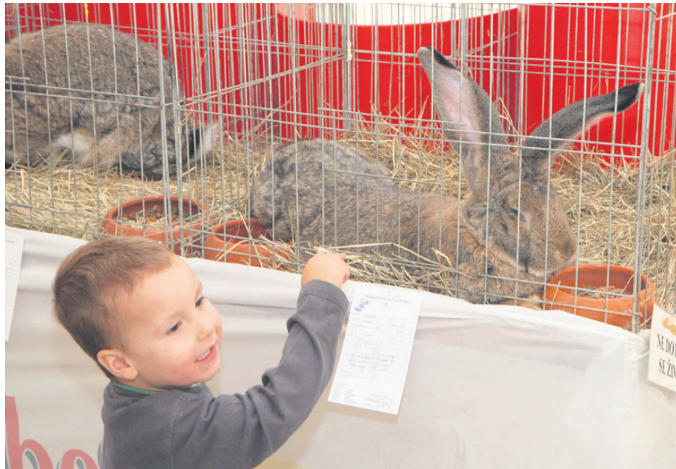
Kunci so navduševali najmlajše obiskovalce.

»Cilj vzreje je ohranjanje pasem. Številne, ki jih vzgajamo, so bile začetnice farmskih križancev. Nekatere pasme so redke in ogro-