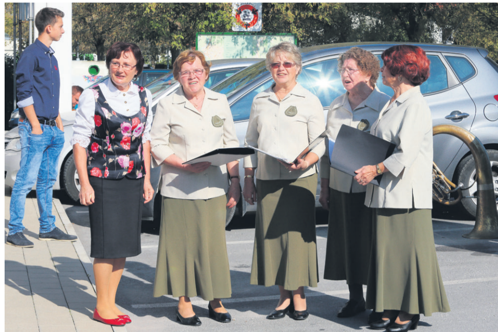
Na temo trte in vina so zapele Taščice.