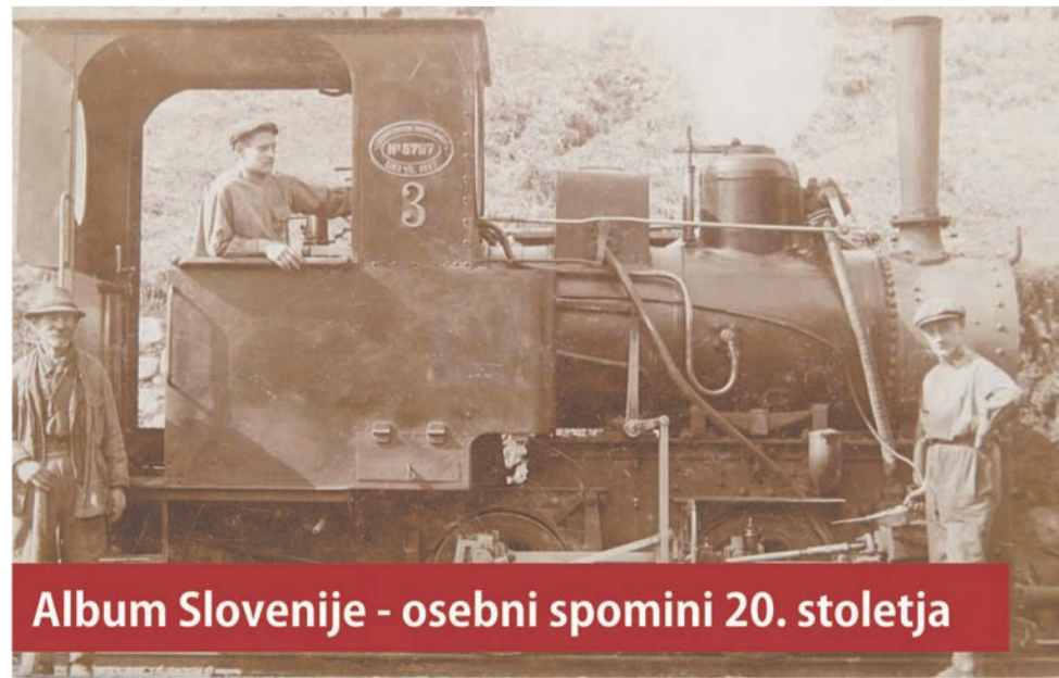
Album Slovenije - osebni spomini 20. stoletja