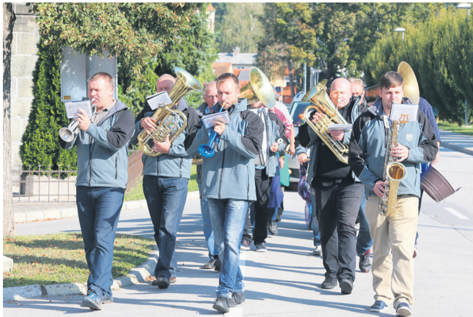
Za slovesno trgatveno vzdušje je poskrbela tudi pihalna godba z Ljubečne.