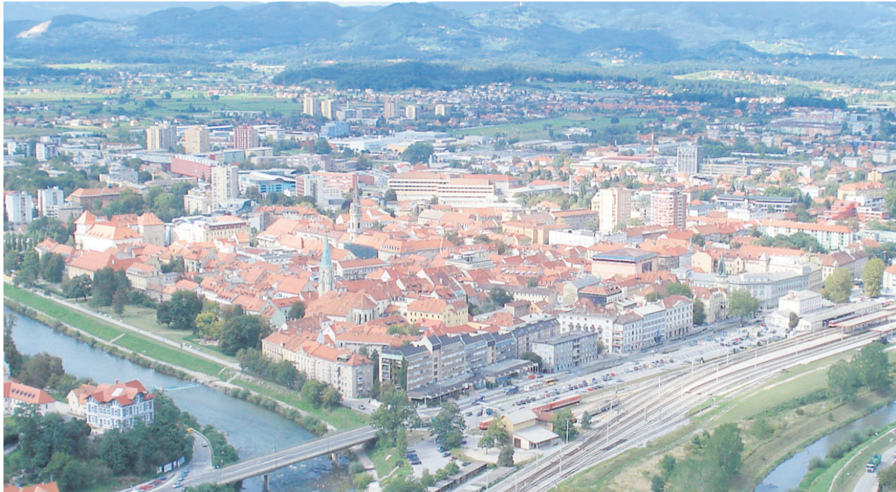
Prihodnost Celja so visokotehnološka podjetja

Celja kriza ni tako prizadela kot Maribor ali Kranj, tudi stečajev z izjemo gradbenih podjetij ni bilo veliko. Še vedno je na tretjem ali četrtem mestu po gospodarski moči v državi in brezposelnost ni velika. Vendar je še vedno delež prihodkov, ki jih podjetja ustvarijo z izvozom, nizek. Dodana vrednost na zaposlenega pa je med najslabšimi v državi, slabši je le Maribor. Celje zato potrebuje več visokotehnoloških podjetij oziroma visokotehnoloških delovnih mest, ki prinašajo tudi višjo dodano