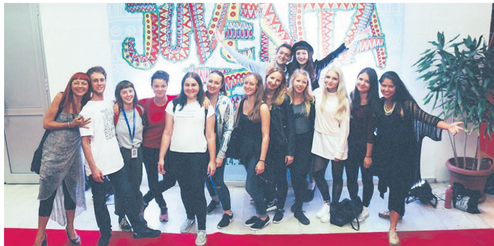
Mladi so se s festivalov vrnili polni lepih vtisov