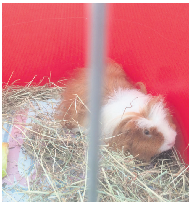
»Zjutraj se nisem uspel počesati.«