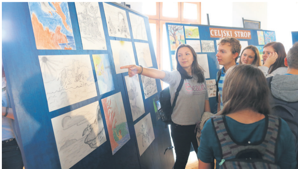
Mladi ob svojih umetninah