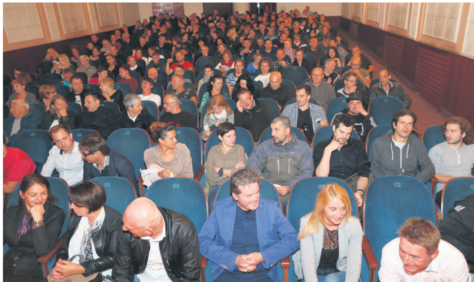
Polna dvorana Mestnega kina Metropol