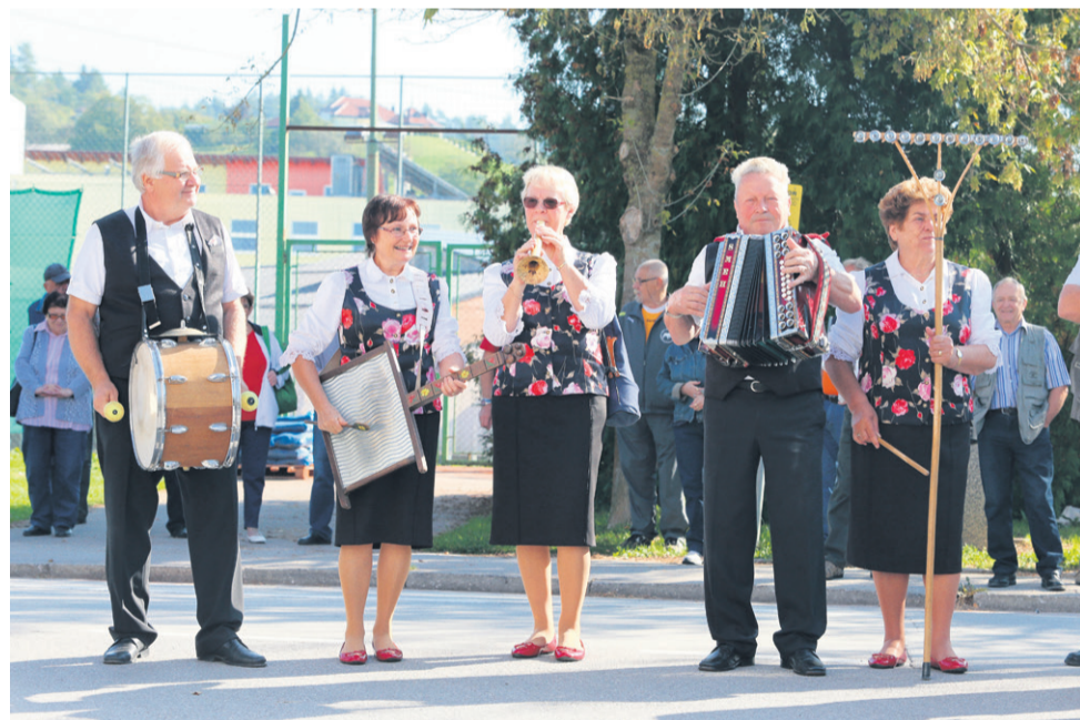
Joškova banda je zaigrala na ljudska glasbila.

Vsem občankam in občanom čestitamo ob občinskem prazniku, našim strankam pa se iskreno zahvaljujemo za zaupanje!