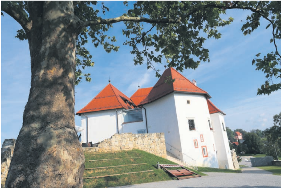
Pogled na grad Komenda z grajskega dvorišča, ki ga krasi več kot sto let stara platana.