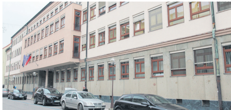
Marsikoga je tokratna popolnoma drugačna odločitev celjskega sodišča presenetila.