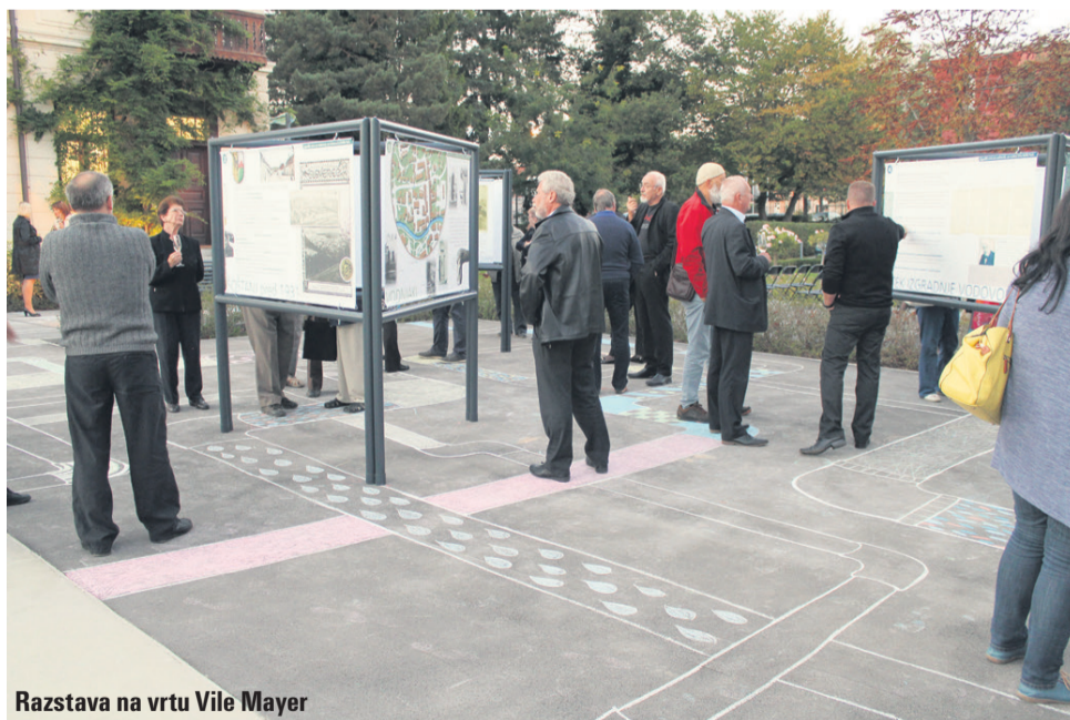
Razstava na vrtu Vile Mayer

Prvi javni vodovod v Šaleški dolini je bil največji komunalni dosežek od konca prve in do začetka druge svetovne vojne, ki je vplival na modernizacijo in izboljšal kakovost življenja meščanov v Šoštanju. Občina Šoštanj želi s plakatno razstavo o vodovodu v mestu poudariti pomembnost dogodka za samo mesto kot tudi za Šaleško dolino. Na razstavi je najprej predstavljeno oskrbovanje z vodo pred vodovodom, kar je dokumentirano s starimi fotografijami. Glavni del razstave predstavlja gradnja vodovoda. »Projekt se je zelo hitro končal. V približno štirih mesecih je 120