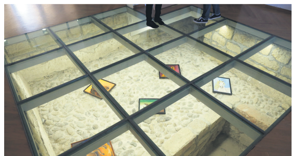
V osrčju gradu so vidni ostanki obrambnega stolpa, ki velja za najstarejšo stavbo na Polzeli. Obnovljeni in zaščiteni deli stolpa predstavljajo tudi svojevrstno galerijo.