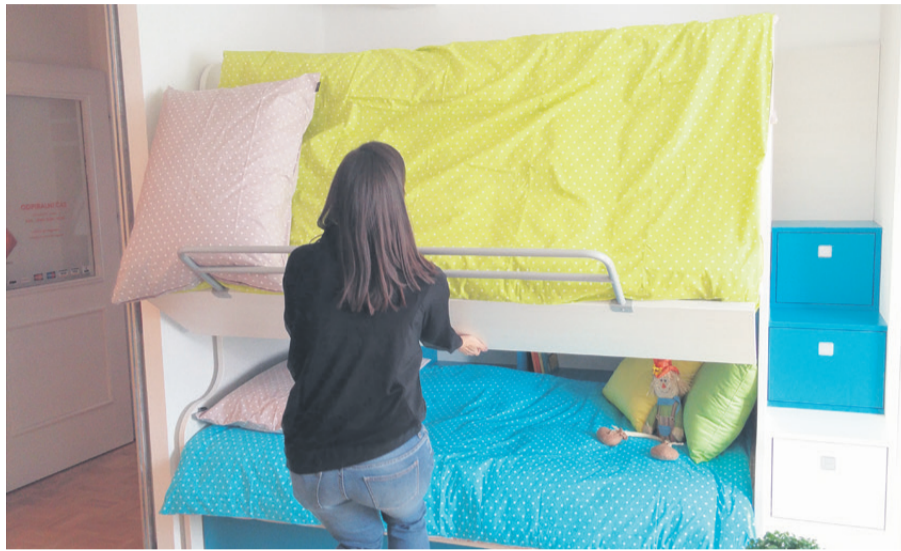
Eden od njihovih izumov je pomični pograd. S pomočjo posebnega mehanizma lahko posteljo spustimo, kar nam omogoča lažjo menjavo posteljnih prevlek.

V podjetju že dlje zaposlujejo tudi invalide. Gre predvsem za gluhe in naglušne s