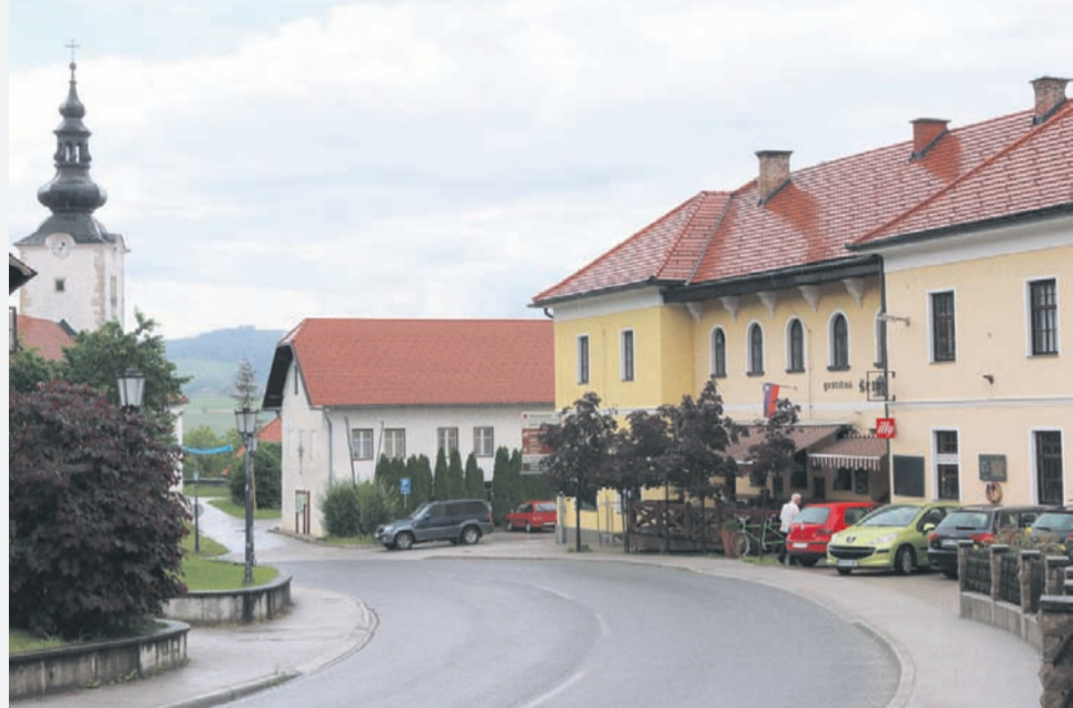
Nad Bistrico ob Sotli še vedno visi breme vračila evropskih sredstev.