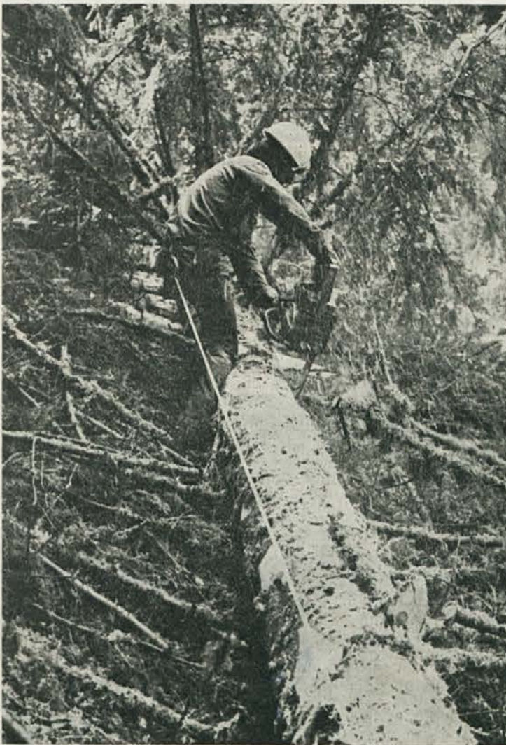
Pravilna tehnika dela zagotavlja najbolj varno delo

Preko oglasnih desk in predsednikov vaših samoupravnih delovnih skupin smo vas skozi celo polletje sproti obveščali o rezultatih poslovanja. Na podlagi sprotnih obvestil smo lahko ugotavljali, da gospodarimo boljše kakor v lanskem letu. To prepričanje je potrdil tudi polletni obračun poslovanja. Dobre rezultate smo dosegli zaradi: povečanja obsega proizvodnje za 24%, povečanja obsega celotnega prihodka za 29,47%, povečanja produktivnosti za 16,21%, povečane ekonomičnosti poslovanja za 0,39% in povečane rentabilnosti za 31%. Podatki nam povedo, da smo plan za letošnje leto izpolnjevali dobro; količinsko smo proizvodnjo realizirali s 46%, vrednostno pa z 48%, plan prihodka smo dosegli v višini 49,94%, plan produktivnosti dela s 100,78% in planirano rentabilnost z 247,04%. Skupaj je rezultat delovne organizacije ugoden. (Nadaljevanje na 2. strani)