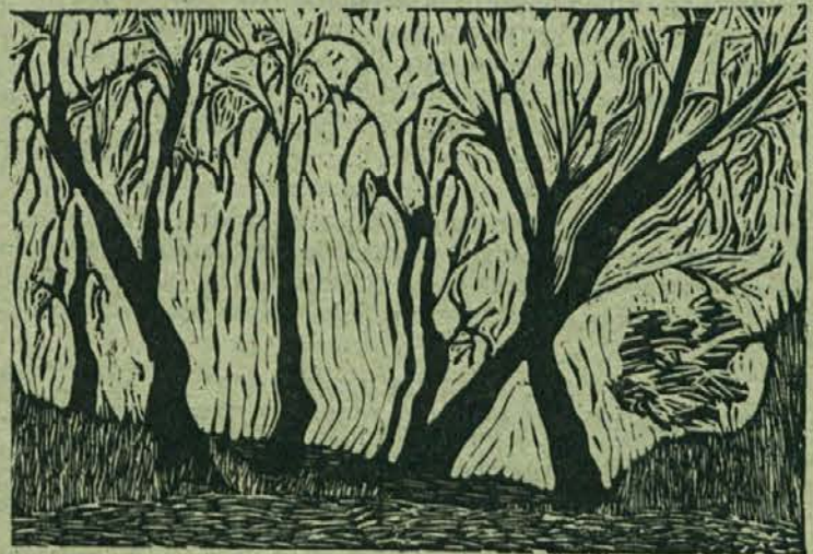
Org. linorez Drevje

Istočasno z naporji za iskanje meril in osnov delitve sredstev za osebne dohodke in izdelavo pravilnika o osnovah in merilih za delitev osebnih dohodkov po delu in rezultatih dela, je aktivnost usmerjena tudi k reševanju vprašanj pridobivanja dohodka v TOZD in delovnih organizacijah, oz. v izdelavo samoupravnih sporazumov o urejanju medsebojnih odnosov pri pridobivanju skupnega prihodka, še posebej v tistih delovnih organizacijah, ki so med seboj dohodkovno povezane.