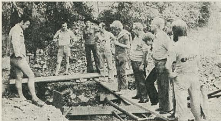
Mesto na delovišču (vodovod), ki je od brigadirjev zahtevalo izredne napore

Koncem julija je obiskala brigadirje in njihovo delovišče delegacija predstavnikov ZB, Občinske konference ZSMS in pokroviteljev — LESNE. Iz tega obiska objavljamo nekaj fotografij, ki so bežna beležka iz življenja in dela brigadirjev v Goriških brdih.