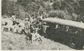
Šranganje, ki se je zaradi bližine meje spremenilo v carinjnje...

Že v prejšnji številki VIHARNIKA smo vas obvestili, da je odšla iz Slovenj Gradca v Goriška brda mladinska delovna brigada Zdravka Črbularja-Rada. Zapisali smo, da so pokroviteljstvo nad to brigado prevzeli naše TOZD v občini Slovenj Gradec ter da bodo naši mladinci v Brdih pri Kožbani gradili vodovod in urejali ter razširili cesto, ki bo za domačine pomenila stik s svetom.