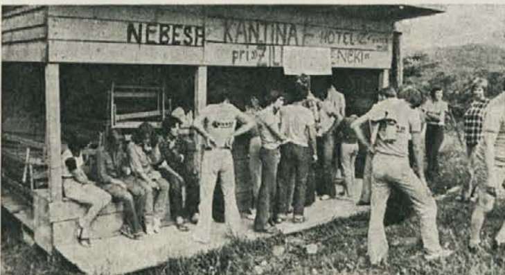
»Nebeska« vrata so se odprla — najbolj priljubljen brigadir je prav gotovo »sv. Peter«, ki skrbi za žejna grla.