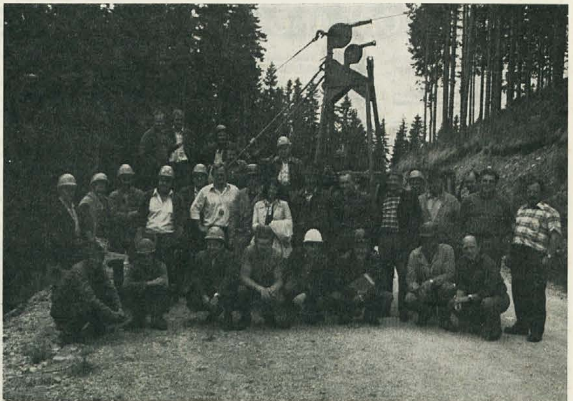
Udeleženci delovnega tečaja: Tečaj je izredno uspel. Tako izobraževanje je treba še poglobiti