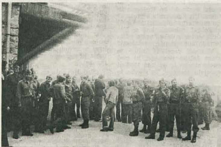
Kljub jutranji megli, ki ni bila nič kaj prijetna, so se brigadirji pripravljali na odhod na delovišče — na bodoča smučišča.

Na prošnjo TOZD Gradnje in turizem, da bi mladina naše delovne organizacije in občinskih konferenc ZSMS v regiji s prostovoljnim delom pomagala pri čiščenju novih smučišč na Kopah, je koordinacijski svet ZSMS LESNE na svoji seji zavzel sklep, da prevzame, v sodelovanju z občinsko konferenco ZSMS Slovenj Gradec, organizacijo mladinskih delovnih akcij na Kopah.