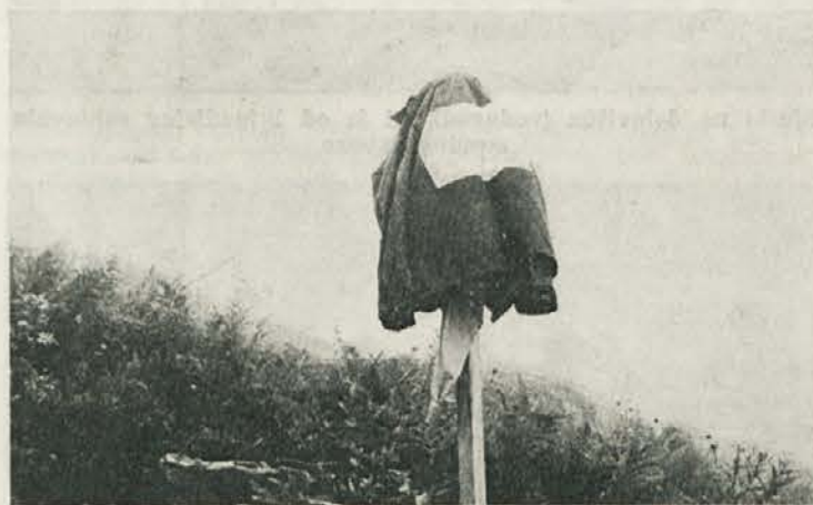
Nekaterim je postalo rahlo vroče.