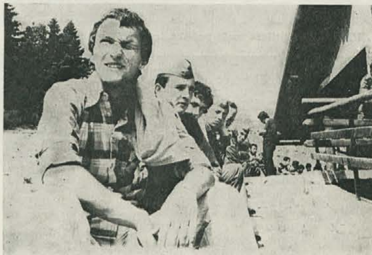
Jo, soncece ti zlato, kako prav si prišlo. In moje noge in roke, uh kako se prileže počitek.