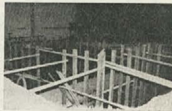
Iz tovarne iverčnih plošč v Otiškem vrhu: Rekonstrukcija v TIP je v polnem teku

Pisali smo že, da so v iverici pričeli z rekonstrukcijo in da bodo postavili novo linijo za oplemenitenje iverčnih plošč. Dela so v polnem teku o čemer priča tudi ta fotozapis.