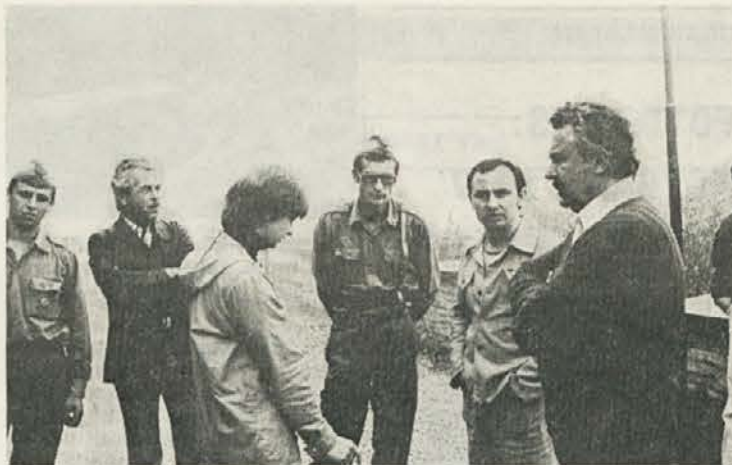
Še kratek posvet pred odhodom na akcijo.