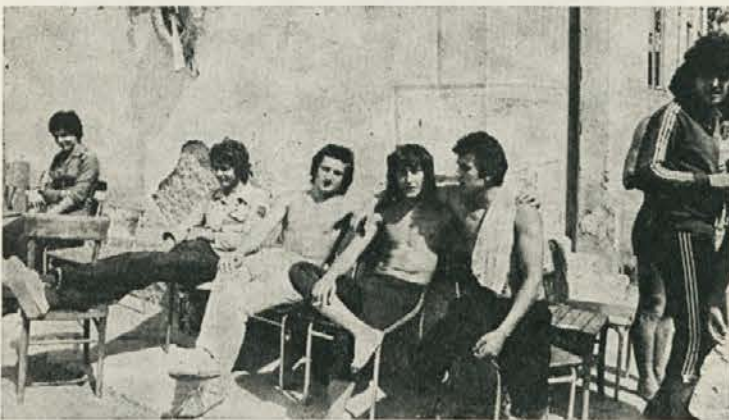
Uh, kako se prileže malo počitka trudnim nogam in rokam