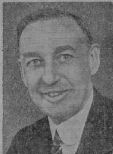
Earl Stanhope, novi angleški mornariški minister