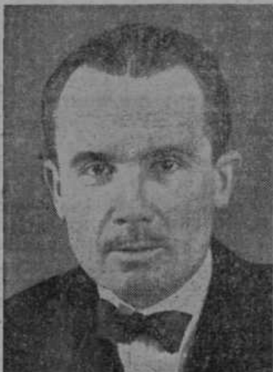
Coulondre, novi francoski poslanik v Berlinu