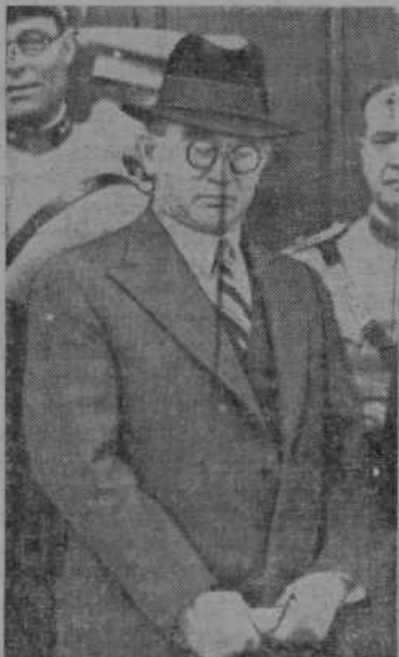
Paul Reynaud, novi francoski finančni minister