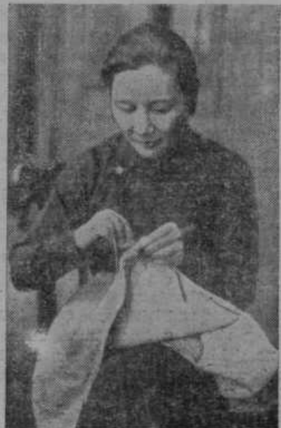
Soproga kitajskega maršala Čankajsega neumorno šiva za vojaštvo in begunce.