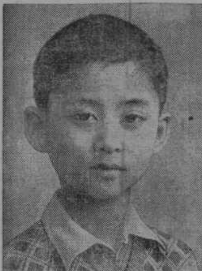
Ananda Mahidol, 12 letni kralj Siama (v Aziji), se je vrnil iz šole v Švici v svojo domovino.

kradel na kor neki zlobnež in pokvaril harmonij, da se ni moglo igrati in je bila sv. maša tiha. Vsi smo obsojali to dejanje. Ne moremo pa za-