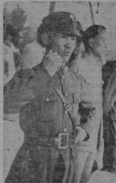
Kitajski general Chen-Cheng izjavlja, da bo nadaljevala Kitajska vojno toliko časa, dokler ne bo pregnan zadnji sovražnik s Kitajske,

Slov. Konjice. Kako zaželena in nujno potrebna je bila izpeljava nove ceste na pokopališče, je dokaz, ko so za praznik Vseh svetnikov ogromne množice župljanov hitele obiskavat grobove svo-