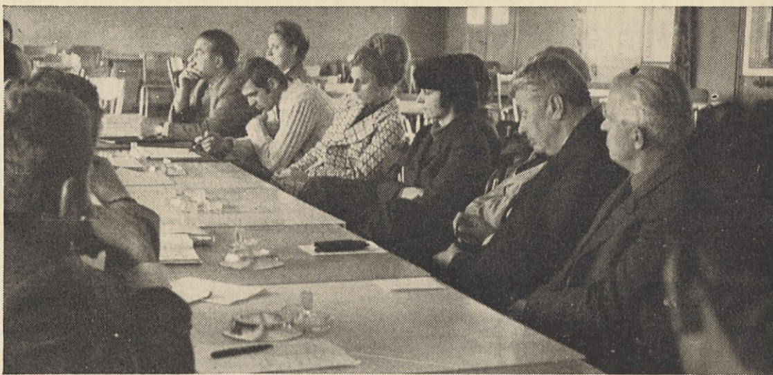
»Kako uresničiti smernice, sklepe, kakšne in katere so osnovne naloge komunistov v tem trenutku, ki pomeni določeno obdobje v zgodovini partije?«

14. Kadrovska služba mora izdelati pregled članov kolektiva, ki so v sorodstvenem odnosu in so istočasno v odnosu nadrejen — podrejen. V spornih primerih mora ustrezno ukrepati.