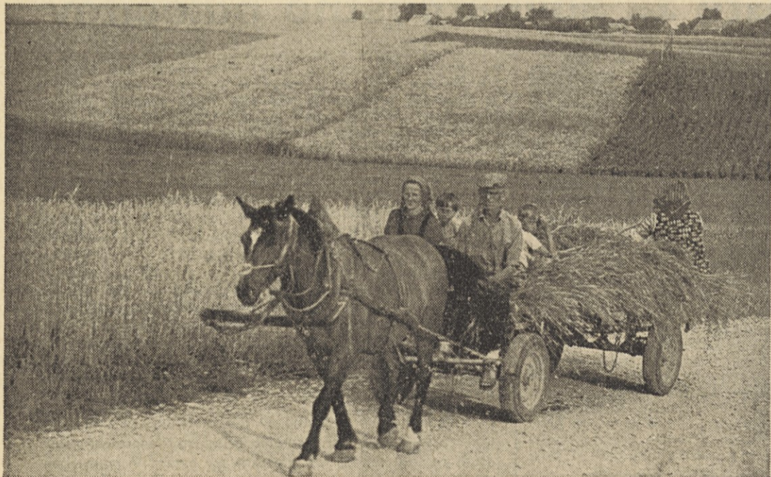
Združitev delavskega in kmečkega zavarovanja bi bilo po našem mnenju pravična, saj vsj doprinašamo naši boljši prihodnosti.

Gorenjsko. Na združitve obeh zavarovanj je treba gledati iz zgodovinskega vidika tako glede na razvoj Gorenjske kot glede na razvoj naše republike. Pred pol stoletja je prevladoval na Gorenjskem izključno kmečki živelj, ki je predstavljal zaledje delovne sile za nastajajočo industrijo že v stari Jugoslaviji. Vsi se še dobro spominjamo, da je bil v času narodnoosvobodilne borbe kmeti, ki je našim osvobodilnim enotam ne samo materialno pomagal, ne samo, da je s svojim obstojem omogočil nastanek in uspešen razvoj NOB, temveč je tudi sam aktivno, skupaj z delavci in ostalimi