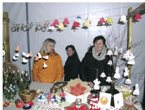
Rokodelci iz Moravske doline