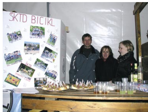
ŠKTD Bicikl iz Hriba