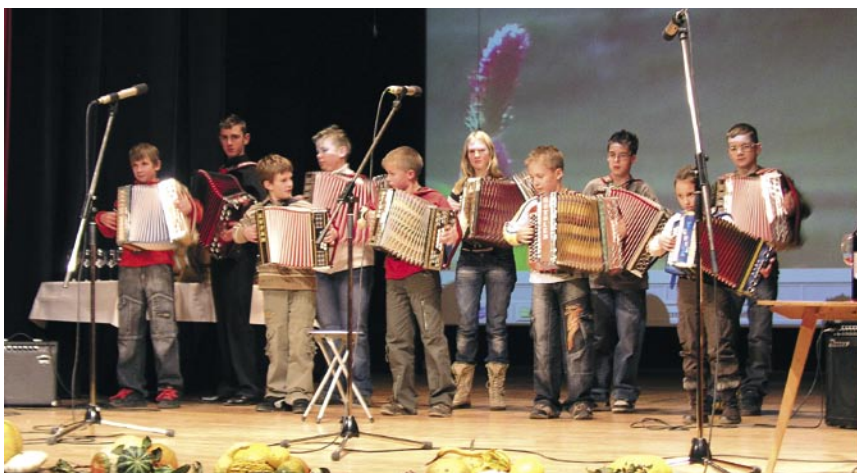
mladi harmonikarji na Martinovem večeru

ob sladkem prigrizku Podeželskih žena. Oboje je bilo okusno. Lansko leto prvič, dve uri pred Martinovim večerom, smo pred Kulturnim domom, na prostem, organizirali Martinov sejem. Letos smo na ta sejem povabili društva iz občine, da se predstavijo na stojnicah, predstavijo svoje