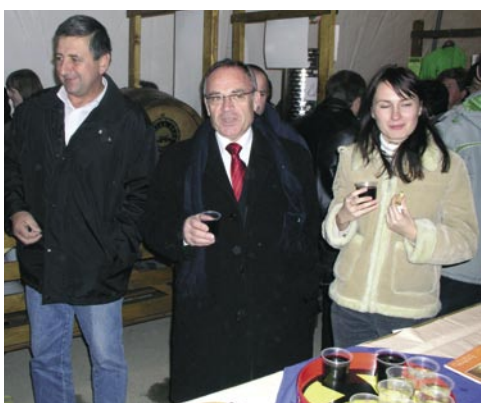
Vzdušje pod šotorom je bilo pravo!