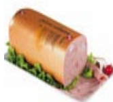
SAL.PIZZA 1kg MERC. 4,13 EUR/kg