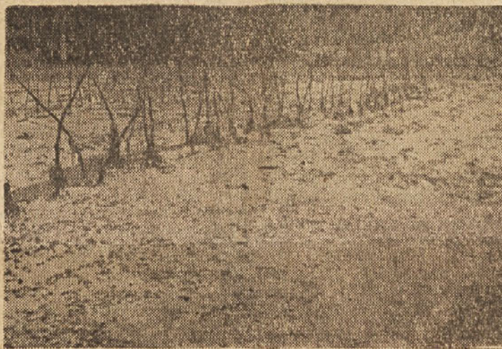
NJIVA OB CESTI

je le-ti še semena, s katerimi bi zasejali še tiste površine na katerih so posevki popolnoma uničeni. Tako bodo potrebovali še: 136.300 kg semenskega krompirja, 4.000 kg koruze hiterce, 6.700 kg koruze za silos, 900 kg prosa, 3.500 kg grašice, 1.400 kg lupine in 1.900 kg detelje. S temi semeni bi zasejali 991 ha nanovo preoranih njiv in 44 ha travnikov. Potrebovali bi pa še velike količine umetnih gnojil, tako: 91 ton apnenamonijskega solit-111 ton superfosfata in 91 ton kalijeve soli. Te količine semen in gnojila je dala na razpolago prizadetim skupnost.