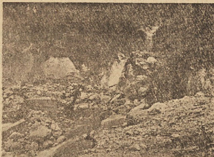
CESTO KRŠKO—GORA NI VEČ ZA SPOZNATI

Pri Blanci je porušen 12-metrski most in podporni zid na cesti Blanca—Poklek so porušeni trije mostovi, na štirih mestih je odrgalo cesto v dolžini 300 metrov in 40 metrov podpornega zidu. Na cesti Šmarje—Planina je na treh mestih odtrgan podporni zid, na enem mestu v dolžini 60 m, odneslo pa je tudi 14-metrski most v Podgorju. Na cesti Lončarjev dol—Zabukovje je potegnilo 40 m dolg plaz in odneslo betonski prepušt ter ves gramoz. Cesto Krško—Gora—Golek je dobesedno zabrisalo, odneslo je tudi ves podporni zid. Samo na tej cesti je za približno 7 milijonov škoda. Na cesti Ribnica—Nova vas pa je odneslo propust. Plazovi so še na drugih cestah, kjer je odneslo in podsoljo gramoz, cestišča tako da promet še ni vzpostavljen. Ce vzamemo samo to, da bo treba zgraditi mostove povsod tam, kjer jih je voda podrla ali pa odnesla, bi potrebovali nad 170 milijonov dinarjev ker se moramo zavarovati za primer ponovnega neurja.