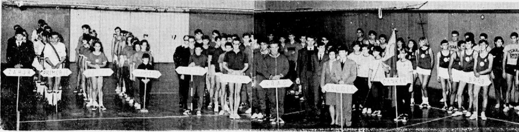
SODELUJOČE EKIPE NA 8. SPORTNEM TEDNU »BORA«

Se toplo marmelado vlijemo v kozarce in hladno zavežemo. MARTINA