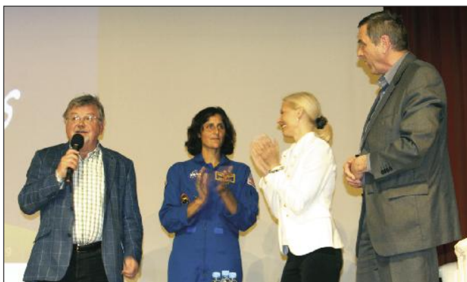
Dolga nedelja na Bledu se je končala s predavanjem v Festivalni dvorani.