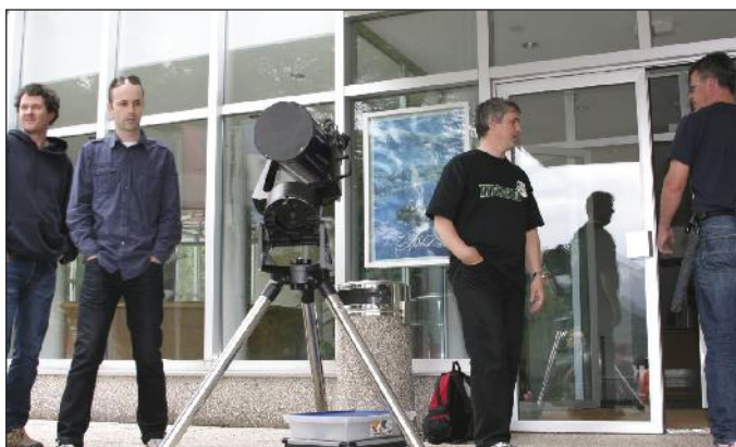
Člani astronomskega društva Nova pred festivalno dvorano s teleskopi - zaman so čakali na sonce!