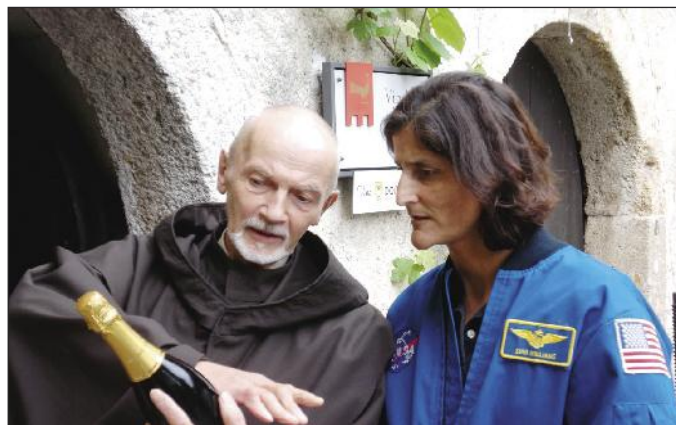
Grajski vinar ji je podaril posebno vino.