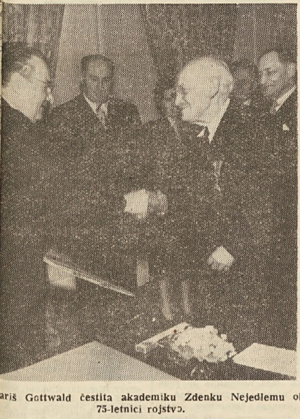
Gottwald čestita akademiku Zdenku Nejedlemu ob 75-letnici rojstva.

Sin revne kmečke družine - Hitra uveljavitev v mednarodnem delavskem gibanju - Utrditev LR Čsoslavoške v treh letih njegovega vodstva