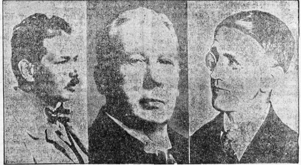
Komisija, ki preiskuje zapuščino polarnega raziskovalca Andréa-a

V Angliji je nedavno umrl vojvoda northumberlandski, dedič plemenitega imena in silnega premoženja. On ni nosil le vojvodskega naslova, ampak je imel pravico še nositi naslove »Carl Percy«, »earl Beverley«, »lord Lovaine« in »baron Alwice«. Vojvoda je bil potomec znane staroangleške plemenitaške rodbine. Njegov praded je bil Viljem Percy, vojvoda normanski, ki je skupaj z Viljemom Osvojevalcem I. 1066 prišel v Anglijo. Rodbina ima v Angliji mnogo grajščin, ogromna veleposestva in bogate rudnike, zlasti premogovnike. Kot lastnika rudnikov ga pa rudarji niso posebno radi imeli, ker je bil proti njim zelo trd. Politično je bil skrajno konservativen in hud protivnik socialistov. Vojvoda Northumberland je dočkal komaj 56 let. V svoji mladosti pa je uganil tudi marsi katero posebno. Tako je stavil enkrat za guvernerjem Kanade, da bo peš pretekel pot od Montreala do Otave, to je pot, ki je dolga 112 angleških milj ali 180 kilometrov. Vojvoda je res pretekel vso pot v treh dneh, vsak dan po 60 kilometrov, in je stavo dobil Olajšana pa mu je bila stava s tem, da ni tekel poleti, da bi ga bila morila vročina, ampak pozimi.