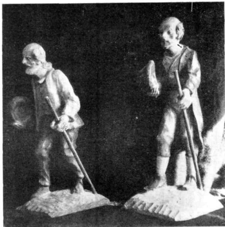
Tone Klemenčič: Pastirja.